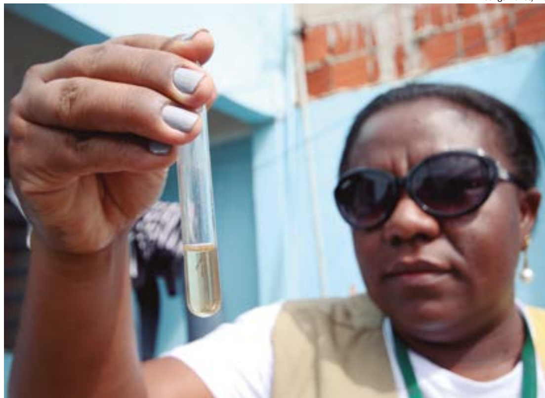
Até o momento, o estado notificou 38.138 casos de dengue, dos quais 21.814 foram confirmados e outros 22.706 têm status de prováveis

O novo informe também aponta que 74 municípios, listados no final da matéria, estão classificados como Alto Risco para dengue, Zika e Chikungunya. Esses municípios, identificados pela cor vermelha, apresentaram uma incidência de casos acumulados maior ou igual a 300 casos por 100 mil habitantes.