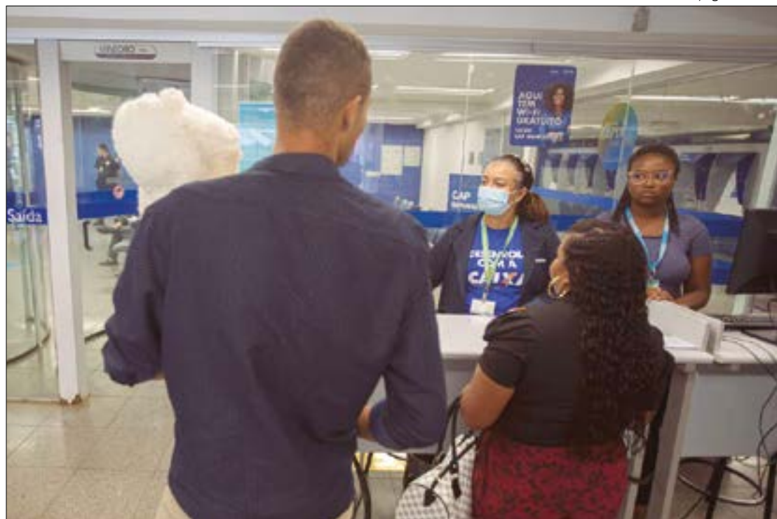
Joédson Alves/Agência Brasil

“Pense em alguém que ficou com o orçamento mais apertado em função de uma despesa inesperada ou que perdeu o emprego ou mesmo alguém que não consegue fechar as contas no curto prazo. Vai preferir isso [prazo mais longo]. Nesse caso, o risco para as pessoas é ir alongando muito e contratando outras dívidas. Em dez anos, podem ocorrer diversas alterações na renda das pessoas”, ponderou.