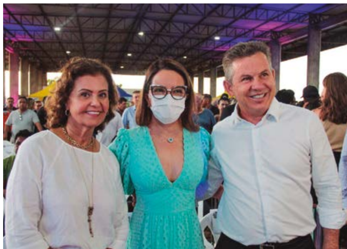
A ilustre aniversariante da quinta-feira (20), Dia Internacional do Amigo (não poderia ter nascido em data melhor!), Teté Bezerra, sempre trabalhando por nosso Estado, posa ao lado da primeira-dama Virgínia Mendes e do governador Mauro Mendes, durante evento de entrega de máquinas e veículos para a agricultura familiar de Mato Grosso