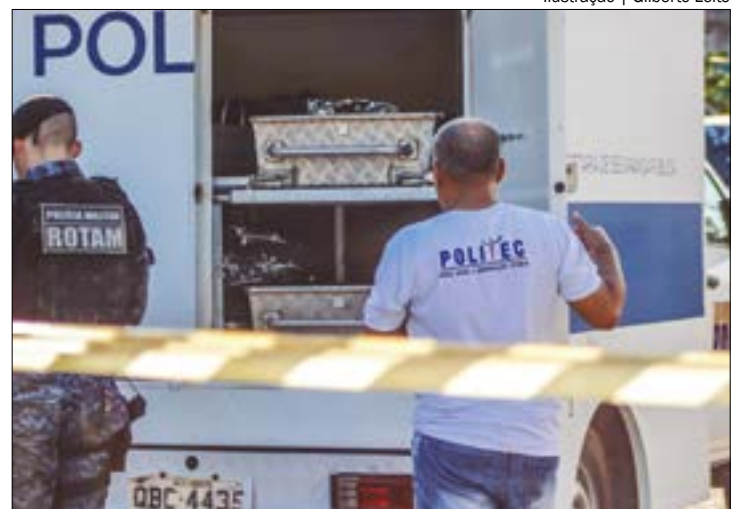
A ação dos bandidos foi registrada por câmeras de segurança e além do bandido morto, outro foi preso