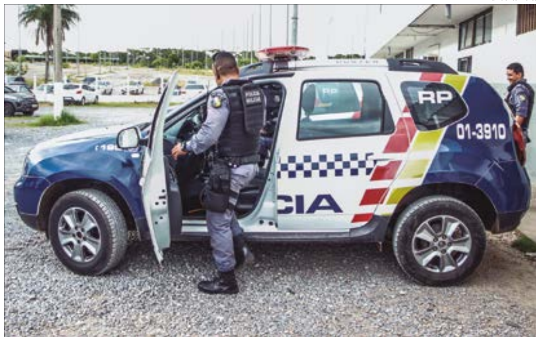
Também será realizada, a Operação Lei Seca, visando a segurança dos motoristas e passageiros que passarem pela rodovia