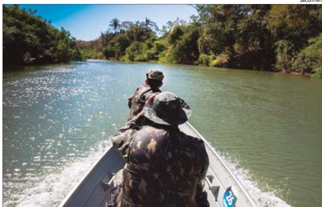
Proibições previstas na lei não alcançam a pesca de subsistência para povos indígenas, originários e quilombolas

A Assembleia Legislativa deverá criar um observatório social para monitorar a melhoria das condições ambientais em decorrência da aplicação da lei, o aumento no estoque pesqueiro dos rios, a evolução do turismo de pesca no Estado, análise econômica das condições da cadeia produtiva da pesca, e avaliação do auxílio financeiro que será ofertado pelo Governo do Estado.