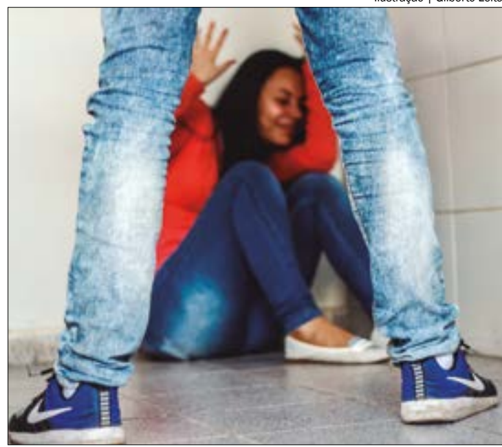
A tentativa de estupro aconteceu dentro de uma loja. O homem ainda ameaçou matar a testemunha