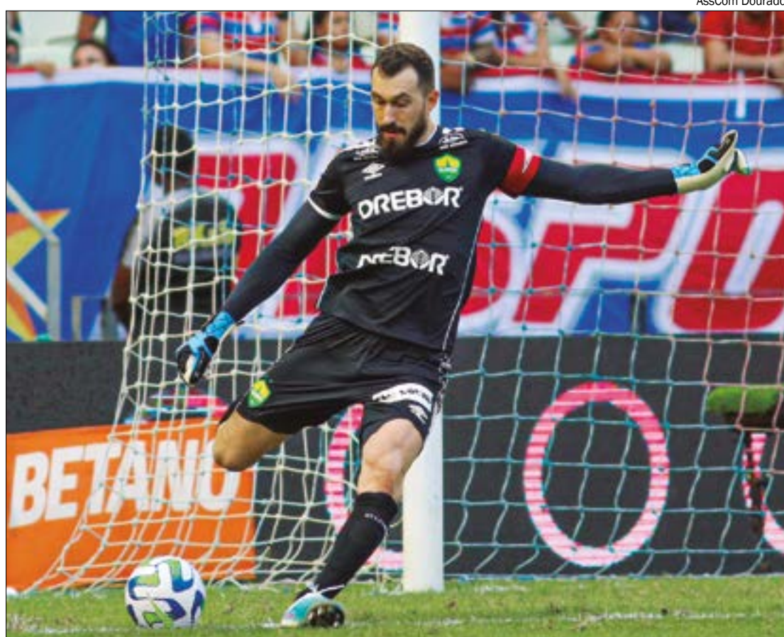
Walter resalta que Cuiabá tem grandes jogadores e capacidade para mirar objetivos maiores no Brasileirão

“A gente sabe que tem grandes jogadores, jogadores experientes, comissão experiente. Já estamos há três anos na Série