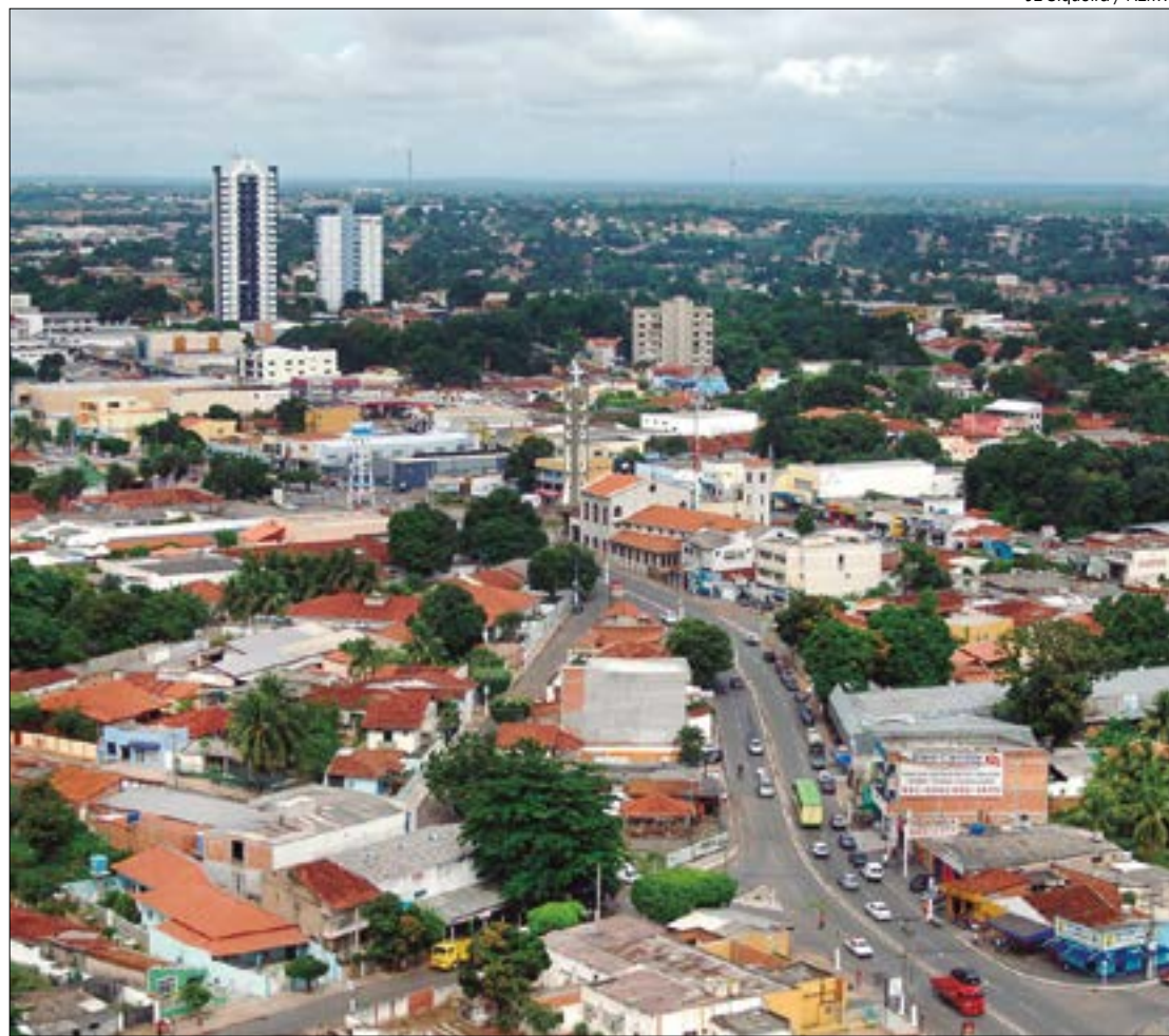
Ticket médio dos imóveis em Várzea Grande está na faixa de R$ 211 mil, quase metade do valor em Cuiabá

Apesar da queda nos valores, houve aumento no número de 1,3% no uni-