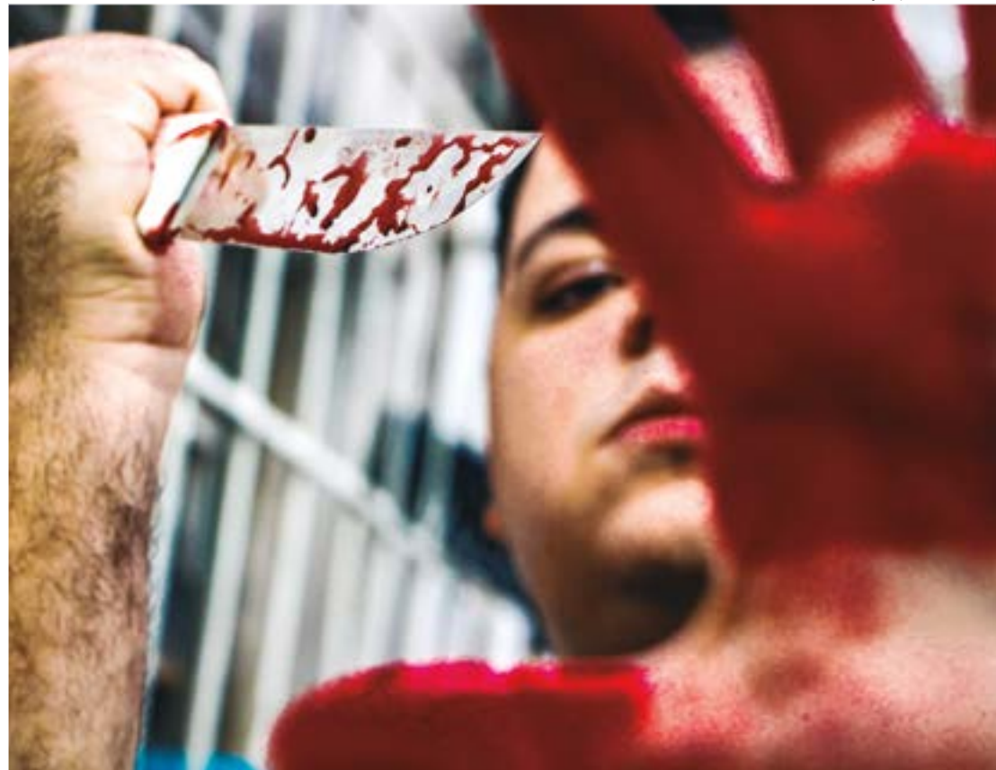
Sorriso apresenta uma taxa de mortes de 70,5 a cada 100 mil moradores