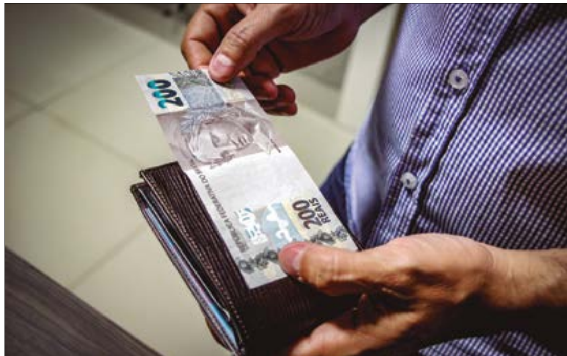
Criminosos aproveitam o programa do governo federal para aplicar golpes por meio de links falsos