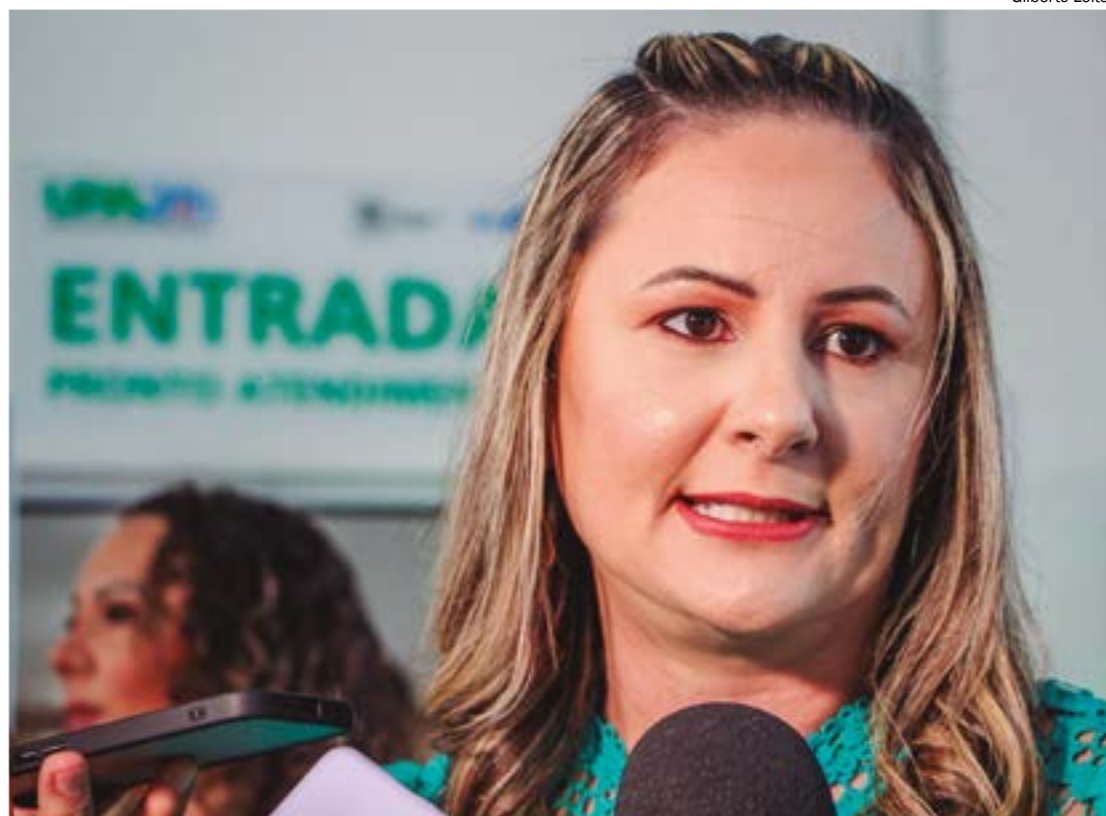
Interventora aponta que a própria Justiça determinou a suspensão do contrato e dos pagamentos à LG Med

O documento foi publicado na edição extra do Diário Oficial do Estado (DOE) que circulou na quarta-feira, 19 de julho. A empresa fornecia médicos plantonistas para atender todas as Unidades de Pronto Atendimento (UPAs) da capital.