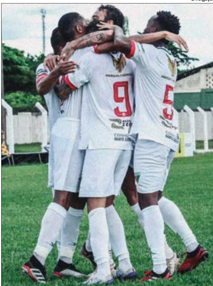
Uma vitória no próximo jogo pode pavimentar o caminho do Chicote para a próxima fase da Série D

O Operário volta a jogar neste sábado, 15 de julho, no estádio Dito Souza, em Várzea Grande. O duelo contra o Real Ariquemes começa às 15h.