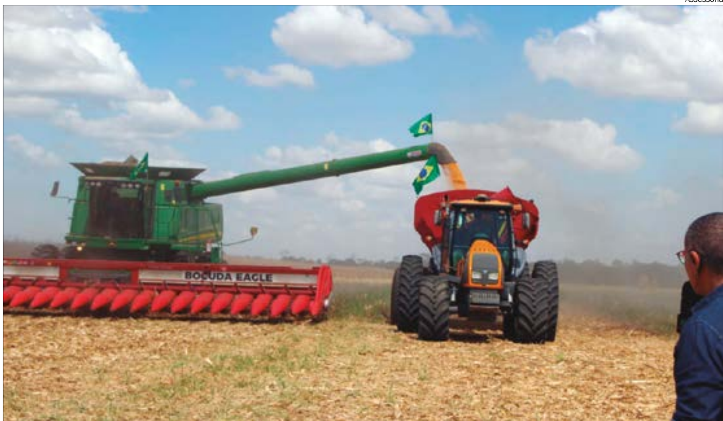
Safra de milho deve atingir 50 milhões de toneladas e ultrapassar a de soja, mas traz desafios aos produtores

Esse percentual é seriamente inferior ao recomendado pela Organização das Nações Unidas