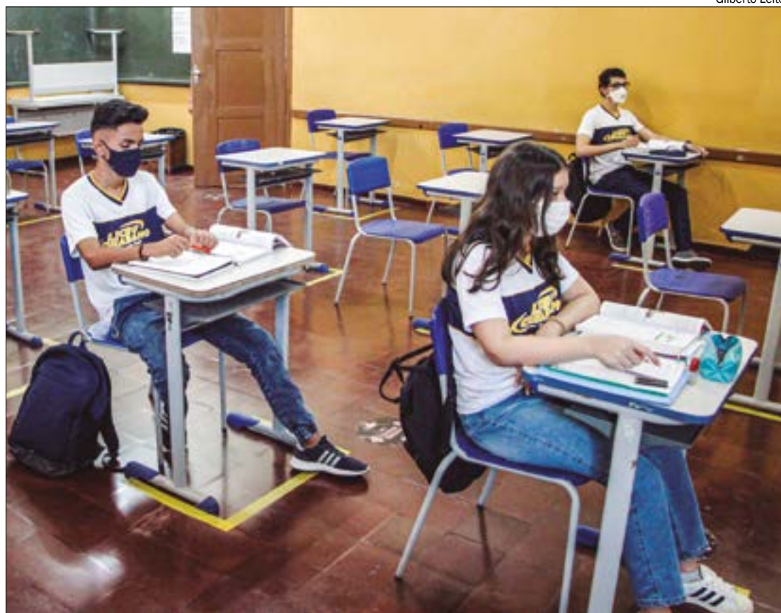
O Programa Nacional de Escolas Cívico-Militares (Pecim), foi criado em 2019 na gestão do então presidente Jair Bolsonaro (PL)

Mas a desvantagem não para por aí, conforme explica Monteiro. O mestre destaca que esse método de disciplina acaba interferindo no futuro desses es-