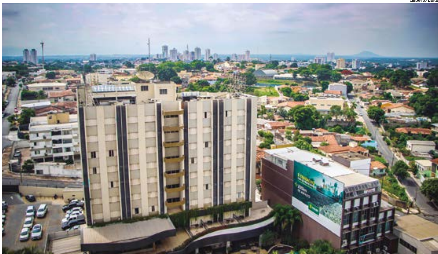
Pesquisa também apontou queda na procura por terrenos e casas, confirmando tendência de contenção de gastos com imóveis

Também houve queda no ticket médio dos imóveis comercializados, saindo de R$ 476,1 mil no primeiro trimestre para R$ 403,1 mil no segundo, uma redução de 15,3%. Porém, em relação ao segundo trimestre de 2022, quando o ticket