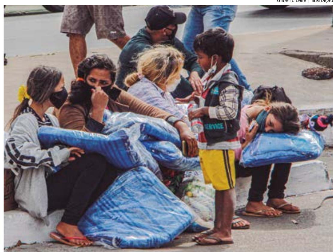
O Peti envolve as famílias e a oferta de serviços socioeducativos para crianças e adolescentes em situação de trabalho infantil

Todas as formas de trabalho infantil são proibidas para crianças e adolescentes com menos de 16 anos de idade (Art. 7º, inciso XXXIII da Constituição Federal de 1988). A única exceção é a Aprendizagem Profissional, a partir dos 14 anos.