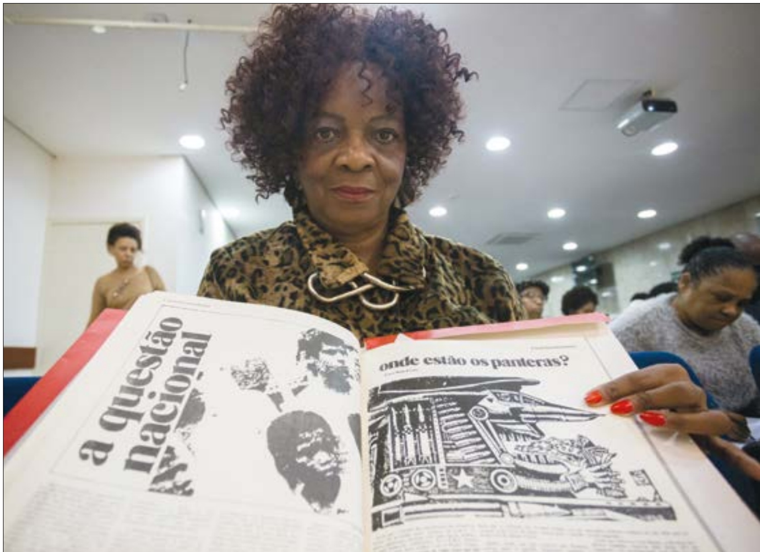
Programação online do Museu da Arte Sacra estimula o debate sobre o preconceito e a luta antirracismo

"São conhecimentos que levam à crença de que a saúde, a educação, moradia, esporte, lazer, segurança, justiça, meio ambiente e direito à terra se cruzam e se inter-relacionam", adianta a quilombola.