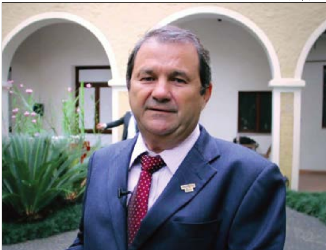
Prefeito de Cáceres defende lockdown, mas diz haver resistência nos demais municípios da região Oeste

O Supremo Tribunal Federal (STF) já determi-