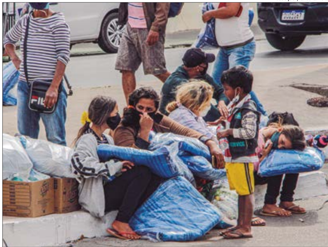
Ilustração | Gilberto Leite

Caso você queira denunciar casos de trabalho infantil, acesse o canal da Auditoria Fiscal do Trabalho em ipetrabalhoinfantil.trabalho.gov.br ou ligue gratuitamente para o Disque Direitos Humanos - Disque 100.