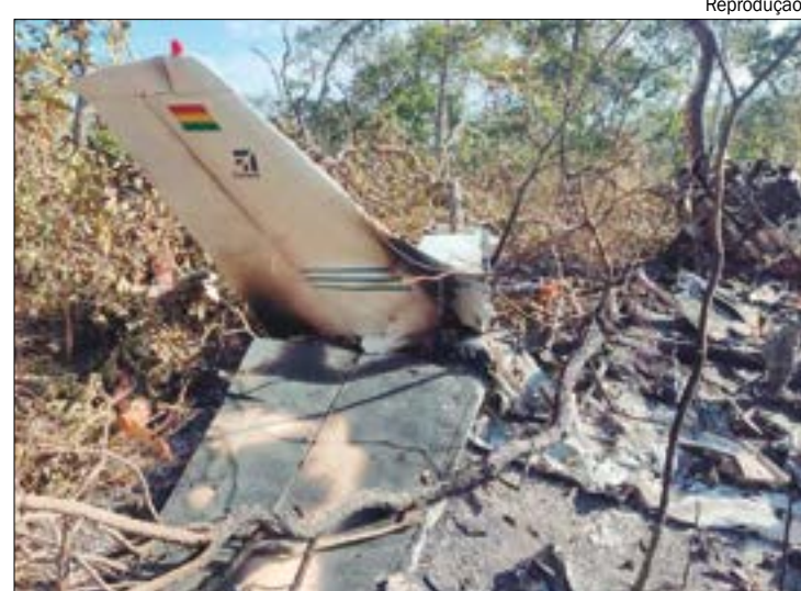
Os destroços foram localizados na tarde de terça-feira (20) em uma operação conjunta de militares