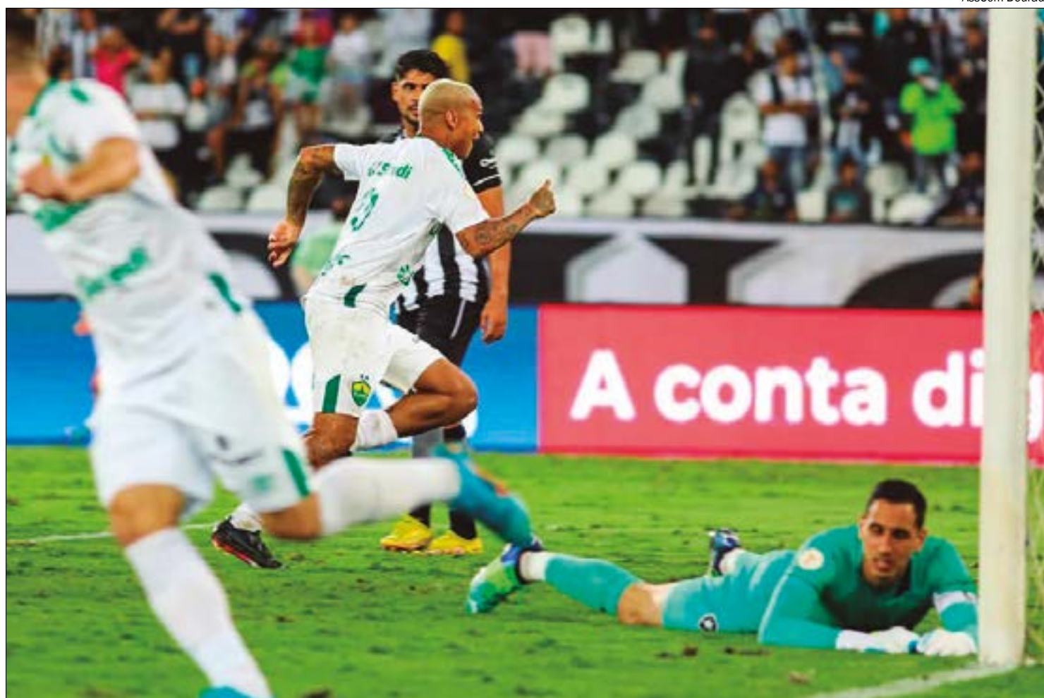
Cuiabá saiu vitorioso nas duas vezes em que enfrentou o Botafogo pelo Brasileirão, em 2022

O início do período invicto veio logo no ano seguinte e pela mesma competição. Desta vez, Cuiabá e Botafogo se enfrentaram pela primeira fase da Copa do Brasil, em dois jogos. Na par-