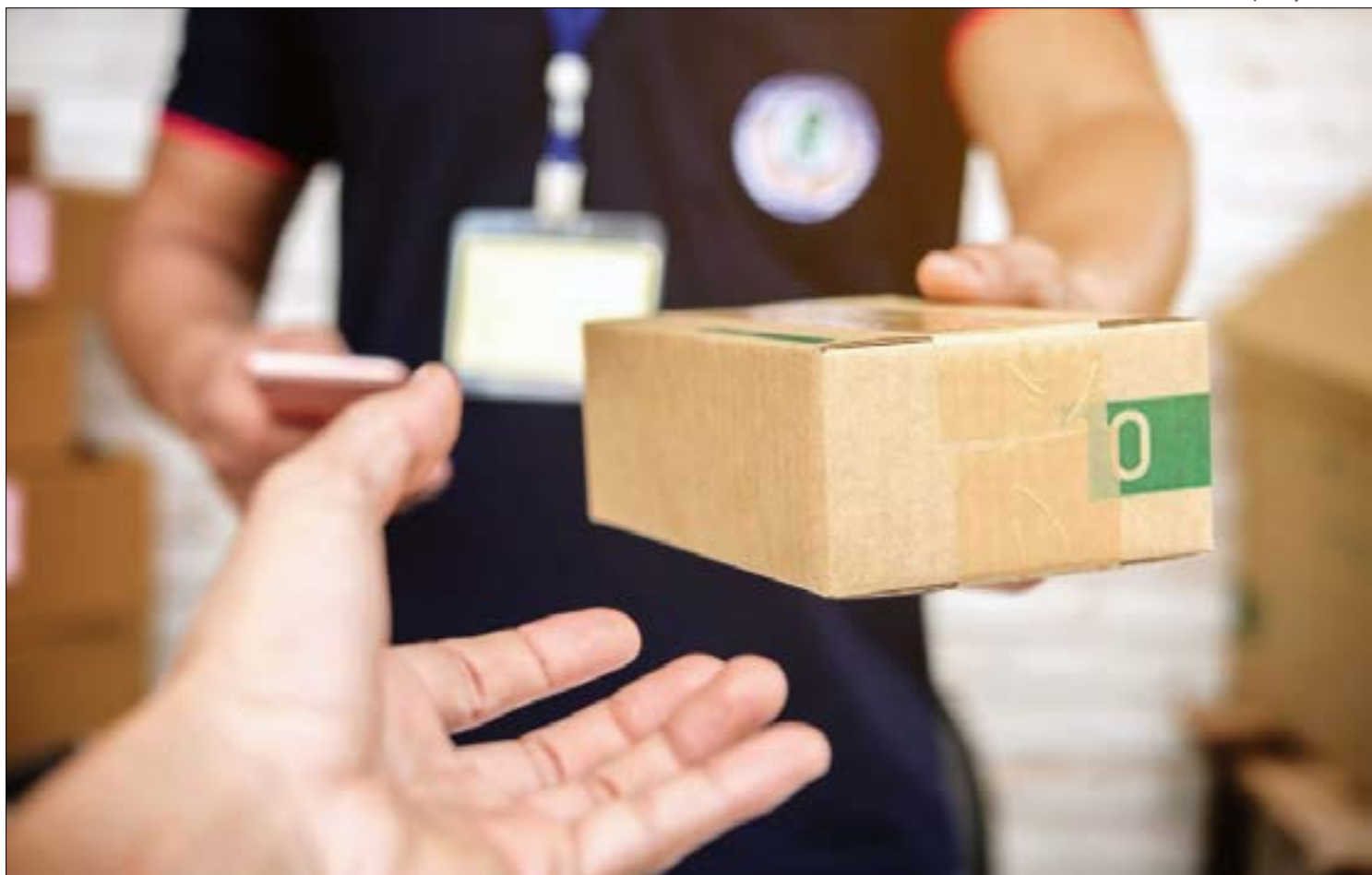
Em abril deste ano o número de pedidos registrou 1,26 milhão, mas logística tem dificultado entregas

Segundo a Federação das Indústrias de Mato Grosso (Fiemt), a pandemia aumentou a discre-