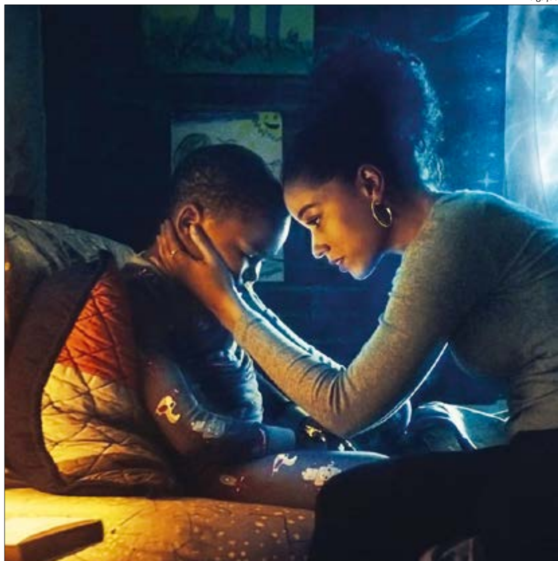
Em 'Criando Dion', os desafios de uma mãe solo e do preconceito são potencializados quando o pequeno descobre ter superpoderes

Os dramas normais de criar um filho como