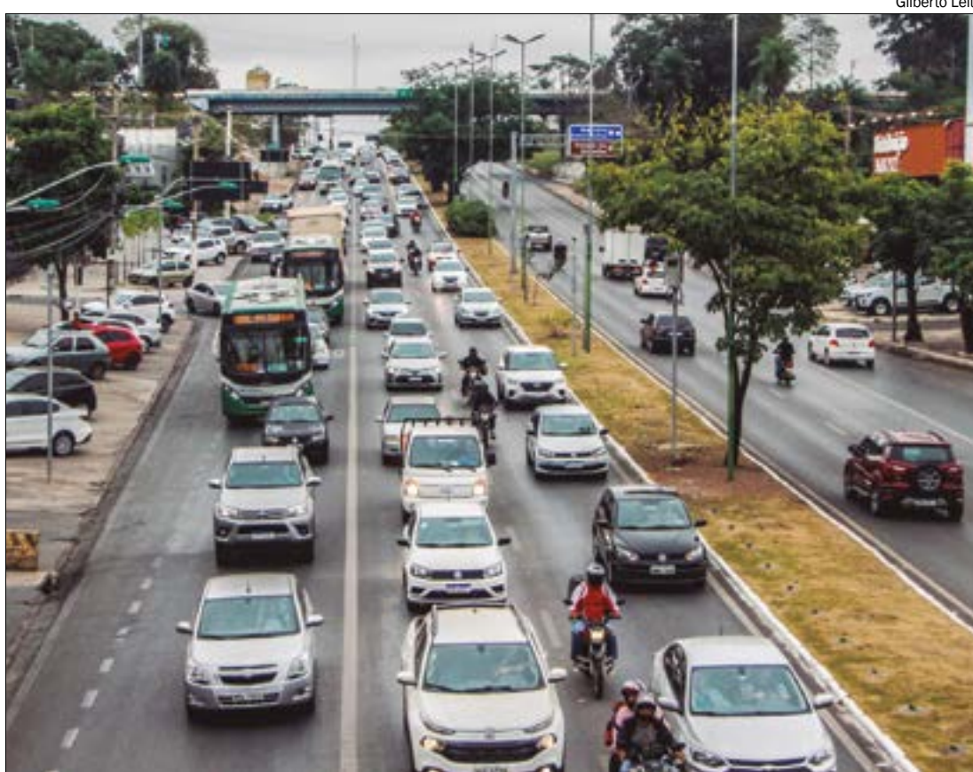
Combinando o pagamento à vista com benefício da Nota MT, motoristas conseguem desconto de até 25% no IPVA

Em Mato Grosso, estão isentos do pagamento de IPVA os motoristas de aplicativo que utilizam veículos movidos a Gás Natural Veicular (GNV) com até 1.600 cilindradas - o popular motor 1.6 -, desde que o veículo esteja registrado e licenciado em Mato Grosso, em nome de uma pessoa física.