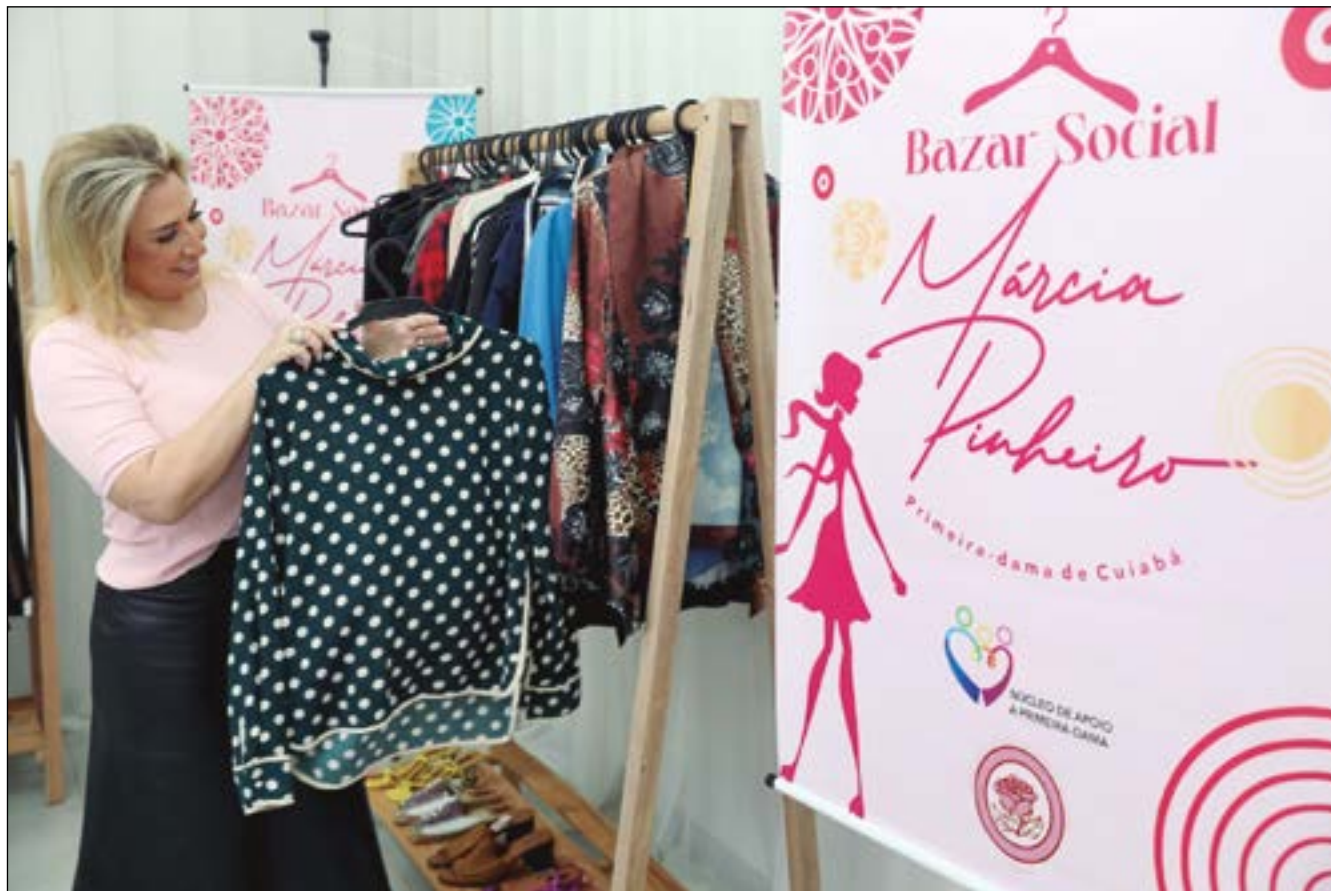
O Bazar Solidário da Primeira-dama Márcia Pinheiro acontece no próximo dia 06 e 07 de junho, na Secretaria Municipal da Mulher. Serão mais de 5 mil peças de roupas, calçados e acessórios para vestuário feminino, masculino e infantil. Toda renda arrecadada será revertida para Rede Feminina de Combate ao Câncer. Vamos participar!