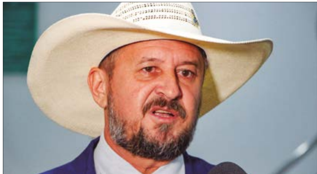
Cattani divulgou vídeo em que pede desculpas às vacas por compará-las às mulheres feministas