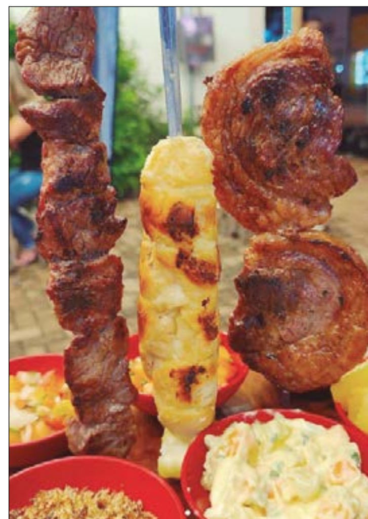
Deu água na boca, né!? Então se prepare que acaba de chegar em Cuiabá o Mirante Grill. Vamos lá conhecer na Avenida Isaac Póvoas?

O multi-talento ator e cantor Silvero Pereira desembarca em Cuiabá no próximo dia 10, no Teatro da UFMT, para interpretar as canções de Belchior. No show, o público irá lembrar músicas conhecidas do grande artista cearense, entre elas "Como Nossos Pais", "Sujeito de Sorte", "Medo de Avião", "A Palo Seco", "Paralelas", entre outros. Vai ser um sucesso! Ingressos à venda em ingressodigital.com