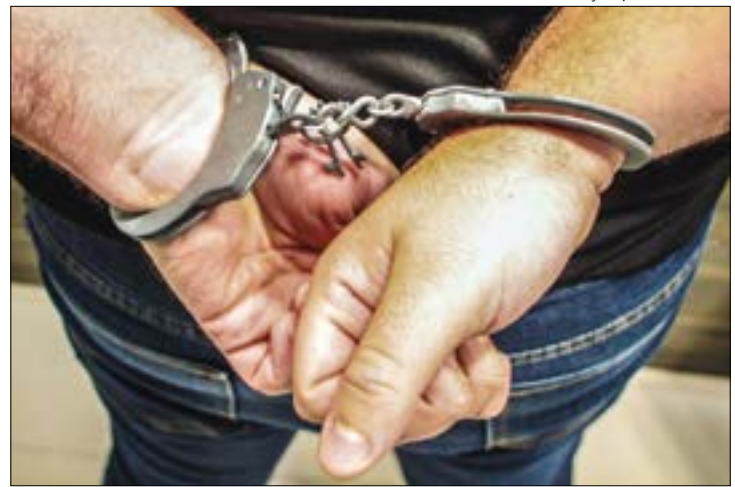
Além dos netos, o idoso agrediu o próprio filho, de 28 anos, que tentou defender as crianças