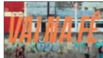
VAI NA FÉ Globo - 19h15

Quinta-feira (25) - A gangue Pedalzeira elogia o plano de sucesso do Rodinha (Dimitri) e dão um novo apelido para o novato: "Crânio". Nath, Ian e Ellen visitam a estufa de Clara e encontram com Lorenzo, o papagaio de estimação de Clara. Despropositadamente, Julieta e Romeu se deparam no jardim da fonte. Romeu pede desculpa por não conseguir se encontrar com Julieta outro dia e eles resolvem o impasse, se desbloqueando nas redes sociais. Romeu conta para Julieta que ele e Rosalina só têm amizade e Julieta diz o mesmo sobre a relação com Patrick. Romeu sugere que eles mantenham a amizade em segredo e que finjam provocação na frente dos amigos.