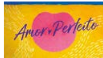
AMOR PERFEITO Globo - 18h15

Os resumos dos capítulos de todas as novelas são de responsabilidade de cada emissora. Os capítulos que vão ao ar estão sujeitos a eventuais reedições