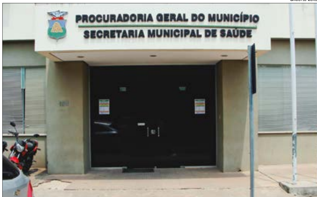
O prefeito Emanuel Pinheiro solicitou acesso aos documentos que comprovem que as mortes foram causadas por demora na fila

Segundo Emanuel, além desses problemas, internamente o gabinete exonerou centenas de profissionais, assediou outros e fez contratos com empresa ilegais. "Isso é uma prova cabal de que essa intervenção não tem perfil técnico e muito menos o compromisso de cuidar das pessoas, e sim uma motivação política. Infelizmente, além de comprometer o avanço de políticas públicas de saúde, a intervenção promove a bagunça e o desmonte da saúde municipal", comentou Pinheiro.