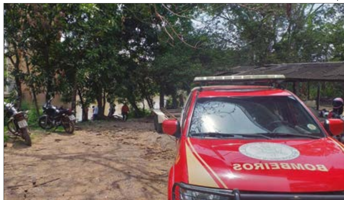
O homem teria ingerido bebida alcoólica e ido nadar, quando desapareceu. O corpo foi encontrado pelo Corpo de Bombeiros boiando no rio Cuiabá

Já na manhã desta segunda-feira, os mergulhadores voltaram à região e encontraram o corpo da vítima boiando. O homem foi retirado da água e a equipe da Perícia Oficial de Identificação Técnica (Politec) foi chamada para encaminhar o corpo do homem para o Instituto Médico Legal (IML).