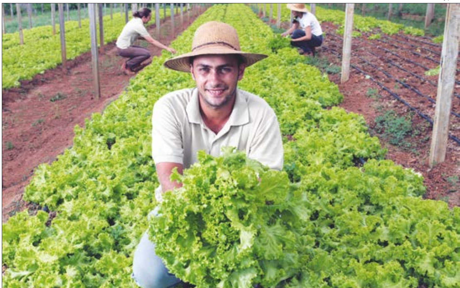
Compra direta com o agricultor passou a ser o principal caminho de escoamento da produção familiar

Antes da pandemia, os agricultores já realizavam vendas online, mas o principal mercado vinha a partir do Programa Nacional de Alimentação Escolar (Pnae). O programa garante que pelo menos 30% da alimentação escolar venha de produtos da agricultura familiar, mas foi interrompido com a suspensão das aulas. As