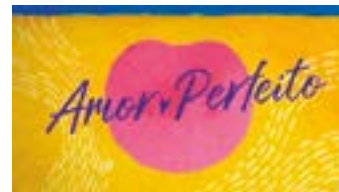
AMOR PERFEITO Globo – 18h15

Os resumos dos capítulos de todas as novelas são de responsabilidade de cada emissora. Os capítulos que vão ao ar estão sujeitos a eventuais reedições