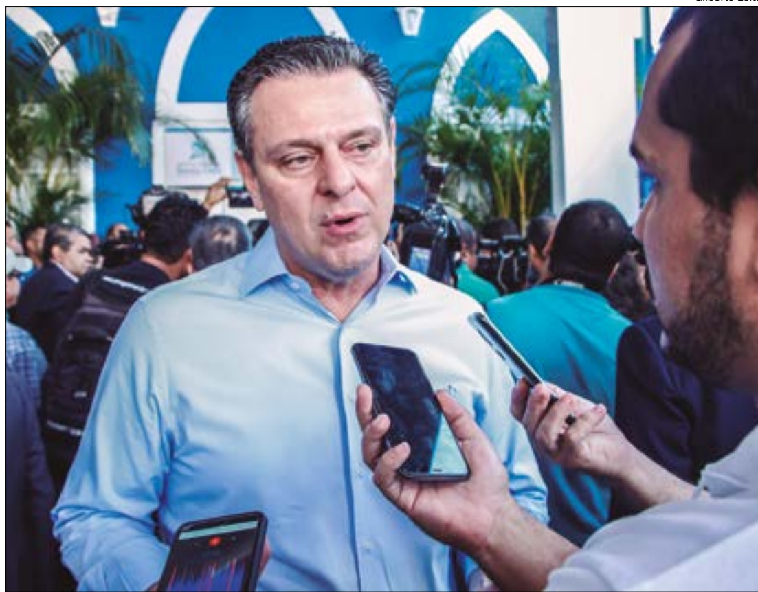
O ministro anunciou o aporte de US$ 400 milhões no BID Pantanal

"Precisamos do conjunto de ações da sociedade para revisarmos rapidamente esse projeto para