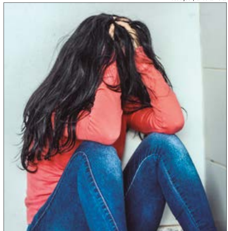
Ao descobrir que o ex-marido abusava da filha, ela fugiu com os filhos para a casa de amigos, e o homem foi atrás