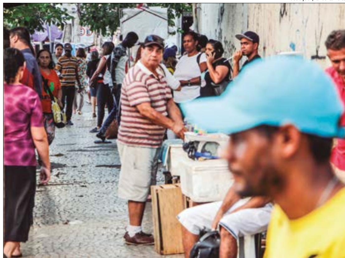
Mato Grosso registrou uma morte causada pela nova varíola. Outros 188 casos foram descartados

SITUAÇÃO ATUAL - Na última semana, a Organização Mundial de Saúde (OMS) anunciou que a nova varíola não é mais uma Emergência de Saúde de Importância Internacional. O monkeypox chegou ao alerta de surto no início do segundo semestre do ano passado. A mudança ocorre devido à queda dos registros da doença pelo mundo.