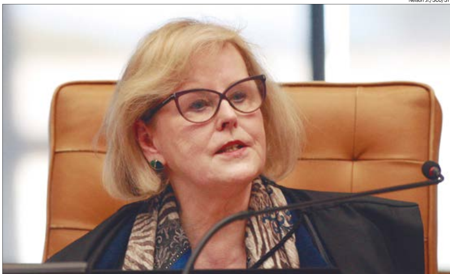
Rosa Weber aponta que decisão que determinou intervenção tem natureza político-administrativa e não cabe recurso

“Por esse exato motivo, a deliberação em-