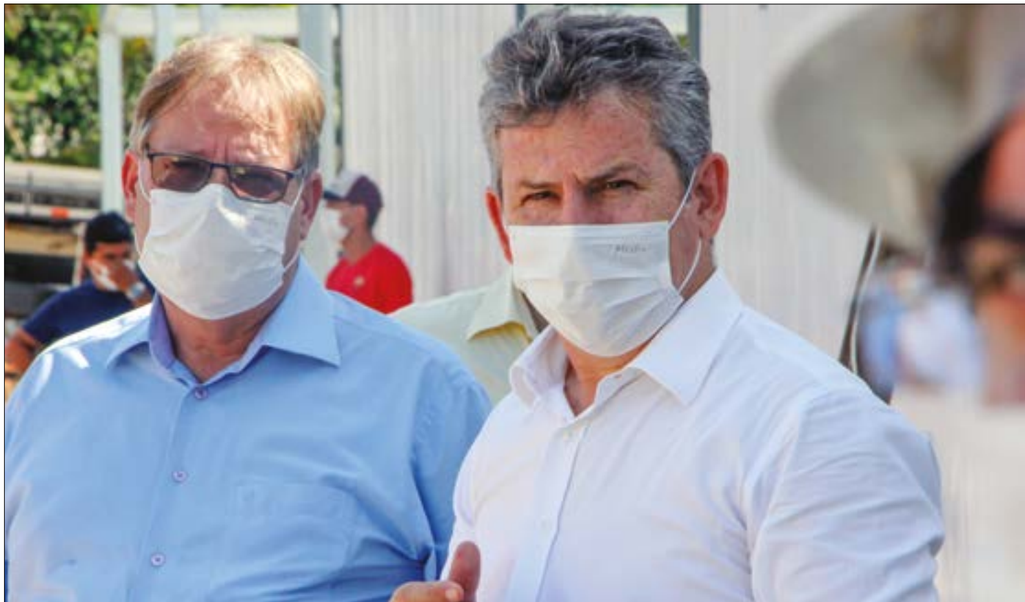
Preocupado com o colapso da Saúde, secretário faz alerta para que a população fique em casa e se previna

“Quem vai na policlínica precisa ser testado. As prefeituras receberam recursos e testes do governo federal. Porque se o paciente testou e já começa um tratamento, talvez