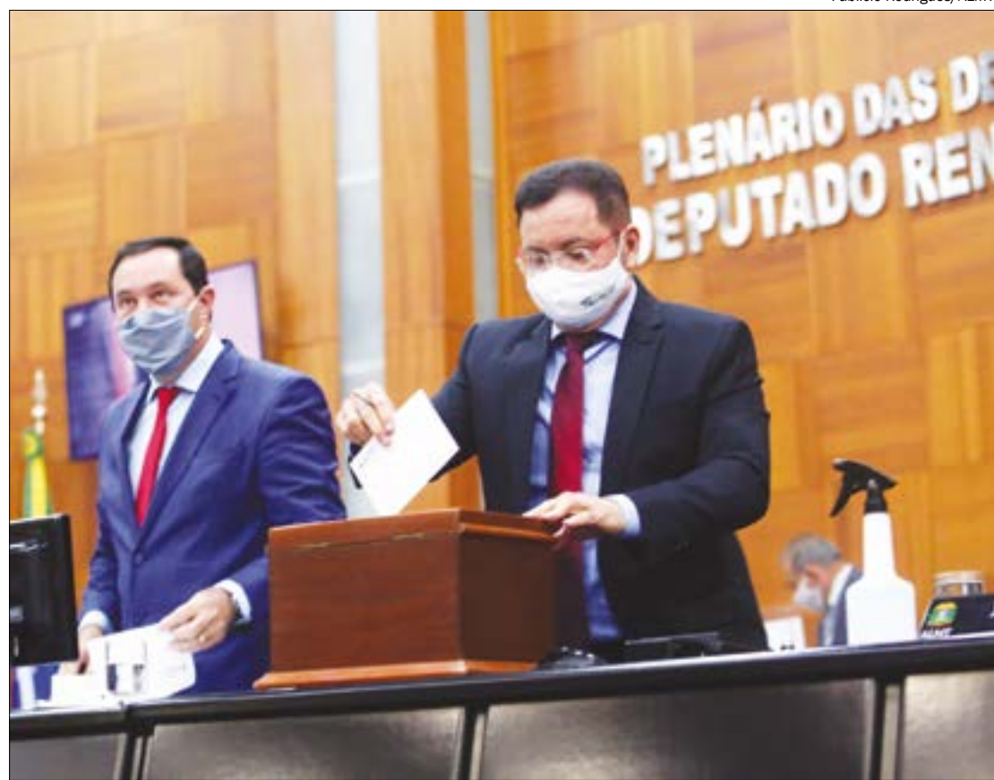
Reeleito, Botelho destacou economia de recursos para ajudar no combate à pandemia