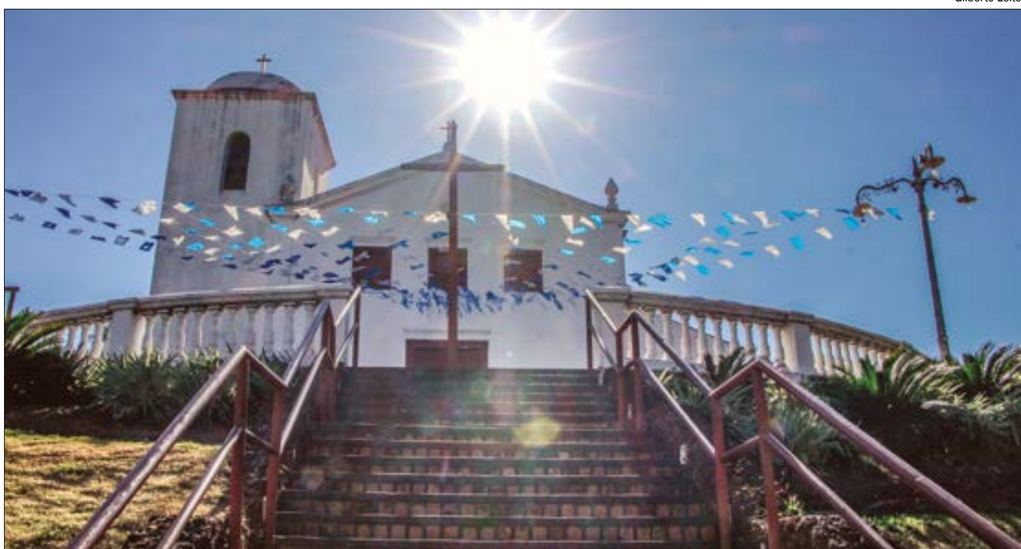
A Igreja de Nossa Senhora do Rosário e São Benedito realiza a Santa Missa no Ginásio São Gonçalo a partir das 15h30

MISSA PRESENCIAL - A Santa Missa acontecerá este ano às 9h na Catedral Basílica do Senhor Bom Jesus de Cuiabá (respeitando o distanciamento social, a utilização de máscaras e a redução na capacidade de fiéis dentro da Igreja), sendo presidida pelo arcebispo metropolitano de Cuiabá, Dom Milton Santos, sdb. Para a participação da Igreja Doméstica (Família em Casa) será transmitida pelo site da Arquidiocese de Cuiabá (www.arquidiocesecuiaba.org.br) e redes sociais.