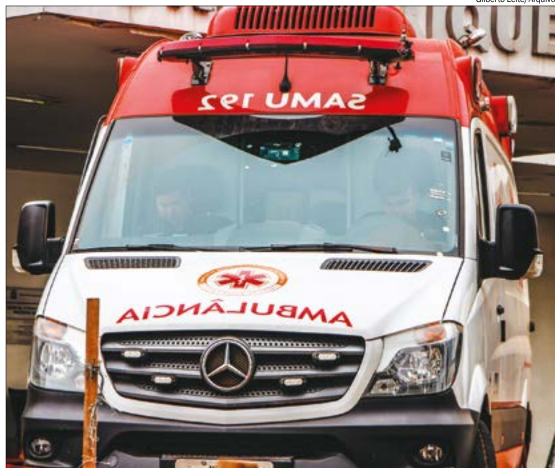
Decreto do governador transferia gestão do Samu para o Corpo de Bombeiros