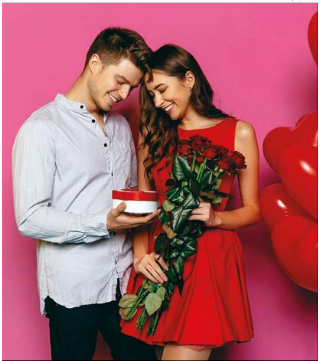
Mais de 81% dos casais cuiabanos presentearão no Dia dos Namorados, aponta pesquisa da CDL Cuiabá

Questionados sobre o que levam em consideração na hora de escolher o presente, 51,5% dos entrevistados disseram considerar o desejo do