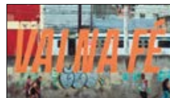
VAI NA FÉ Globo - 19h15

Sexta-feira (12) - Após o crime, Poliana diz que vai para a escola e apoia a família para também seguir em frente. Ruth comenta com os sobrinhos que Francisco, policial que conheceu no Ceará, vem para São Paulo para vê-la. Tânia encontra com Violeta. Poliana e João reencontram os amigos. Eric faz as pazes com João. No laboratório, Sara diz a Otto que Pinóquio foi um herói. Jeff expressa a Brenda que deseja dar mais um passo na relação e ela responde o namorado. André aponta a Raquel que não quer viajar, que quer terminar a faculdade. Raquel diz que vai fazer mochião sozinha.