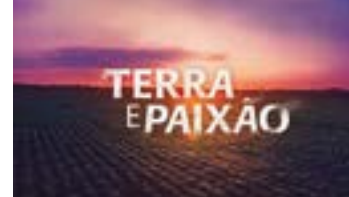
TERRA E PAIXÃO Globo - 21h15

Sexta-feira (12) - Ben questiona Lumiar sobre o motivo da repetição do teste. Clara conversa com Helena sobre o beijo das duas. Erika pede para Ivy filmar Sol e Lui juntos. Ben se aconselha com Mãe Ana. Anthony avisa a Vítinho que Erika publicará sobre a cláusula do contrato de Sol. Jenifer ajuda Hugo em um trabalho. Kate vê Hugo e Jenifer juntos e decide convidar os dois para sair com ela e Rafa. Sol descobre que terá que fazer um novo exame de DNA e se desespera. Lui implora que Erika não poste seu vídeo com Sol. Clara muda o visual. Sol faz confidência para Ben sobre Lui. Rafa consola Jenifer. Lumiar segue o conselho de Ben e pede para Theo desistir de fazer o exame de DNA. Ben, Jenifer e Sol esperam Theo no laboratório.