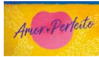
AMOR PERFEITO Globo - 18h15

Os resumos dos capítulos de todas as novelas são de responsabilidade de cada emissora. Os capítulos que vão ao ar estão sujeitos a eventuais reedições