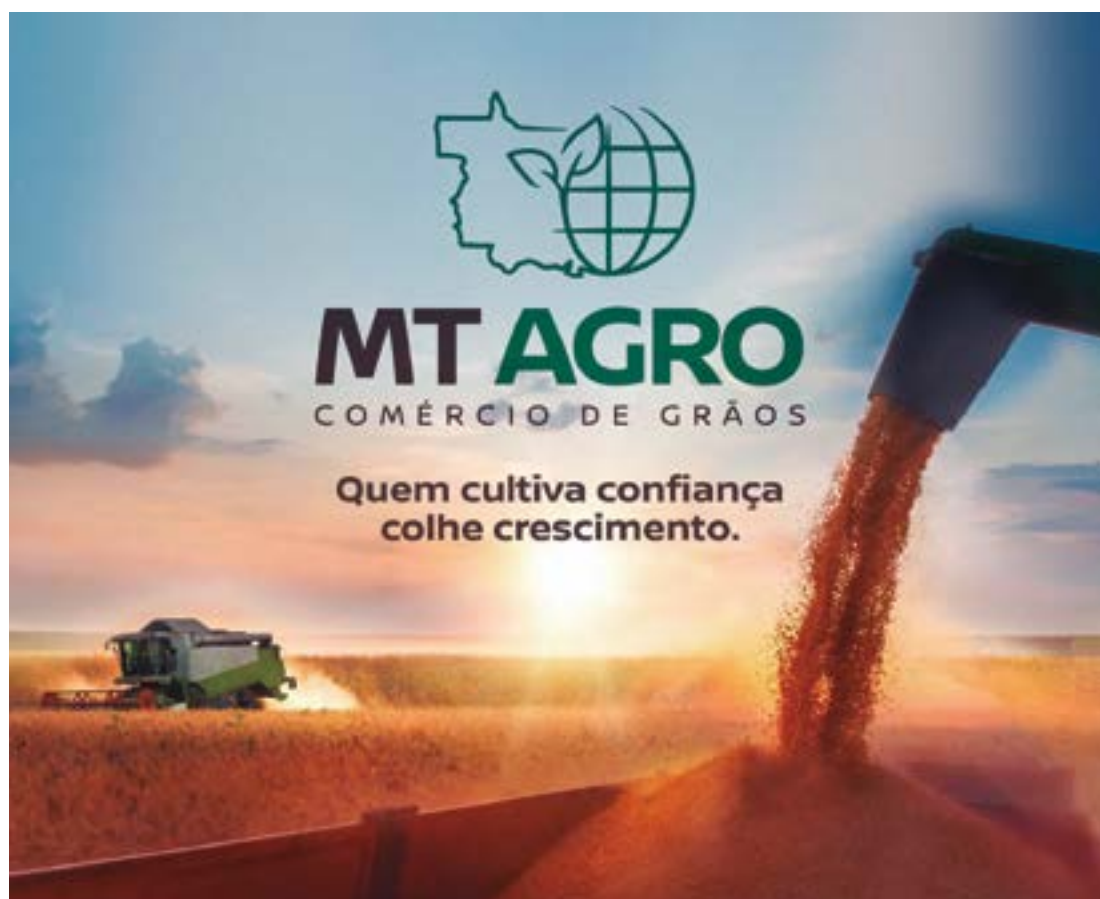
MT Agro, a nova empresa de compra e venda de grãos com sede em Cuiabá