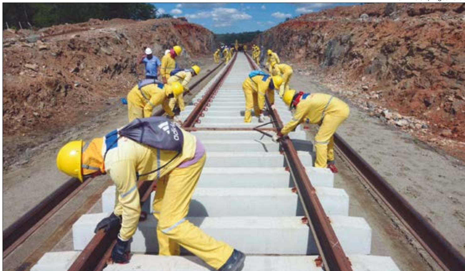
Ferrovia de Integração do Centro-Oeste está sendo construída pela Vale, com investimento de R$ 2,73 bilhões

Este será o primeiro leilão de ferrovias do governo Lula (PT), que trabalha para apresentar o projeto à iniciativa privada até o final do primeiro semestre. A ideia preliminar é oferecer a concessão da Fico em um pacote que inclui dois trechos da Ferrovia de Integração Leste-Oeste (Fiol).