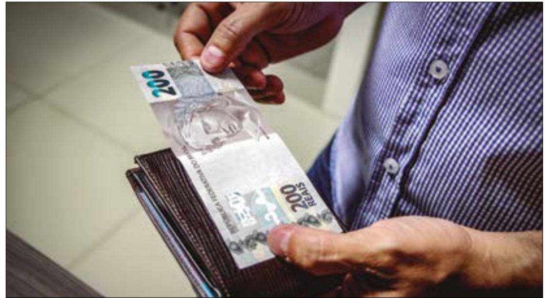
Texto prevê que salário mínimo será reajustado anualmente pela inflação do INPC, mais a taxa de crescimento do PIB

A proposta será analisada na Câmara dos Deputados e no Senado Federal.