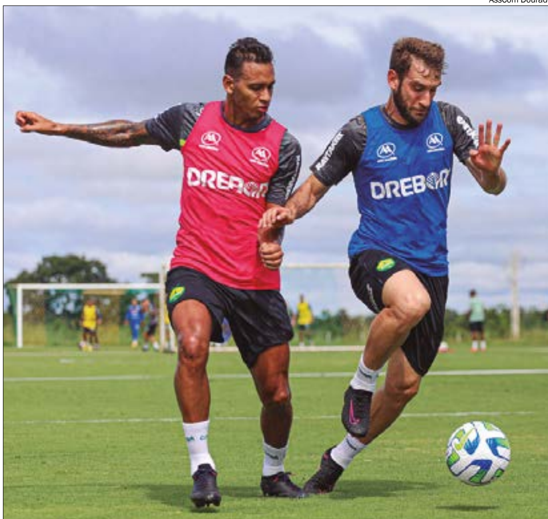
Cuiabá poderá contar com força total contra o Grêmio, adversário que nunca venceu na história

Grêmio: Gabriel; Fábio, Kannemann, Bruno Alves e Diogo Barbosa; Lucas Silva, Nathan, Bitello, Cristaldo e Vina; Luis Suárez.