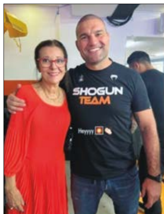
O campeão Maurício Rua, o Shogun, esteve na inauguração. Na foto com Ireniza Canavarros