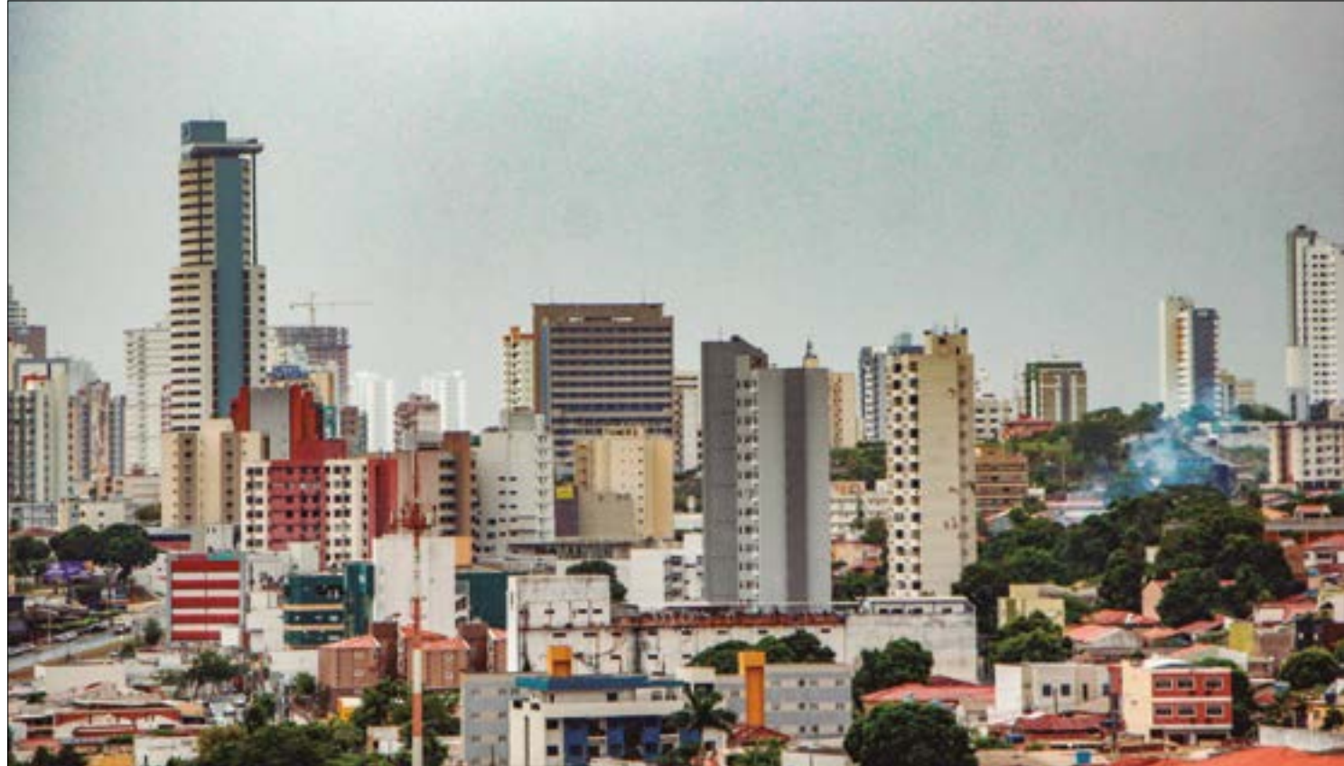
A Prefeitura de Cuiabá tem enfrentado dificuldades em executar a cobrança do IPTU 2023