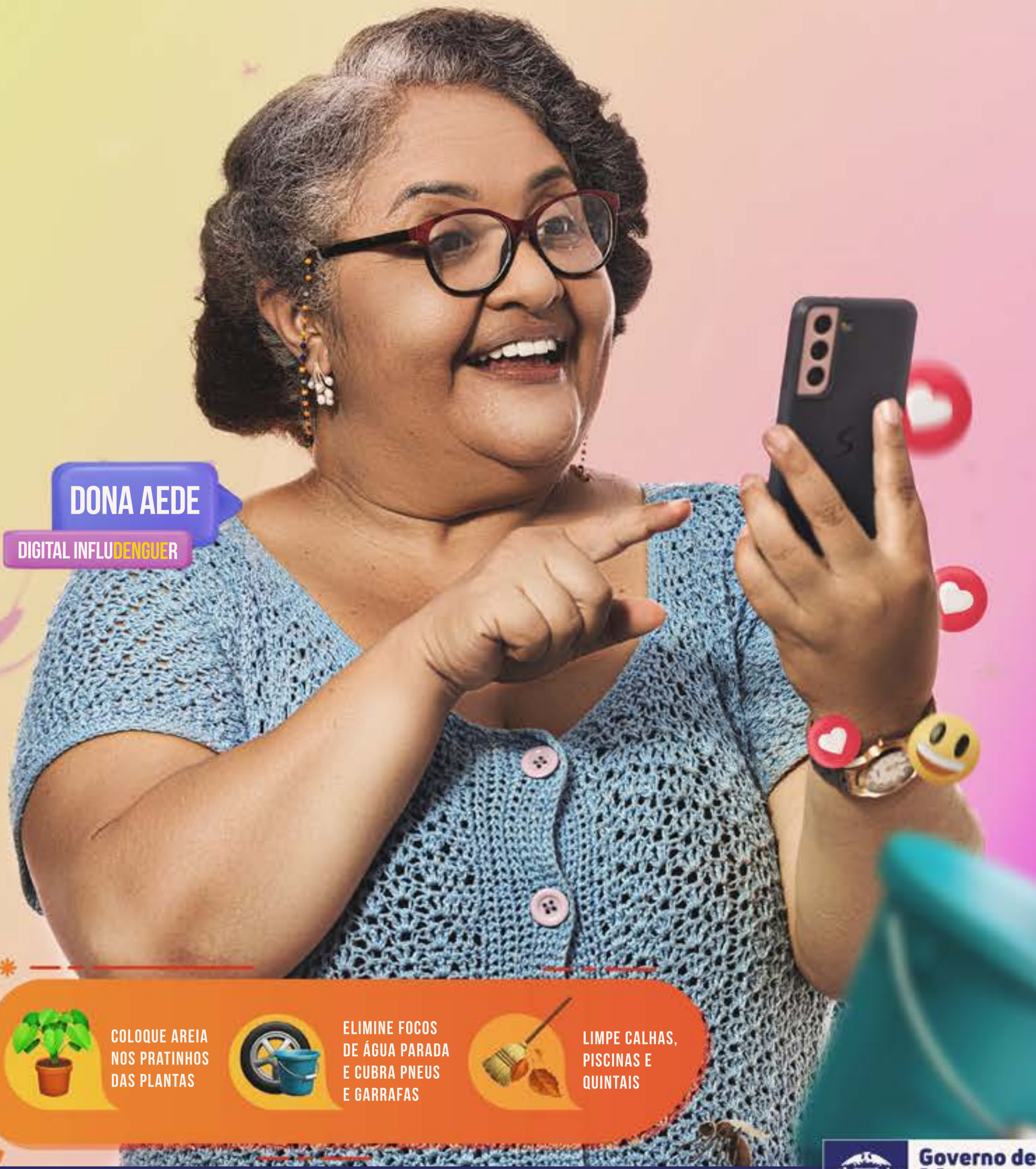
DONA AEDE DIGITAL INFLUENCER