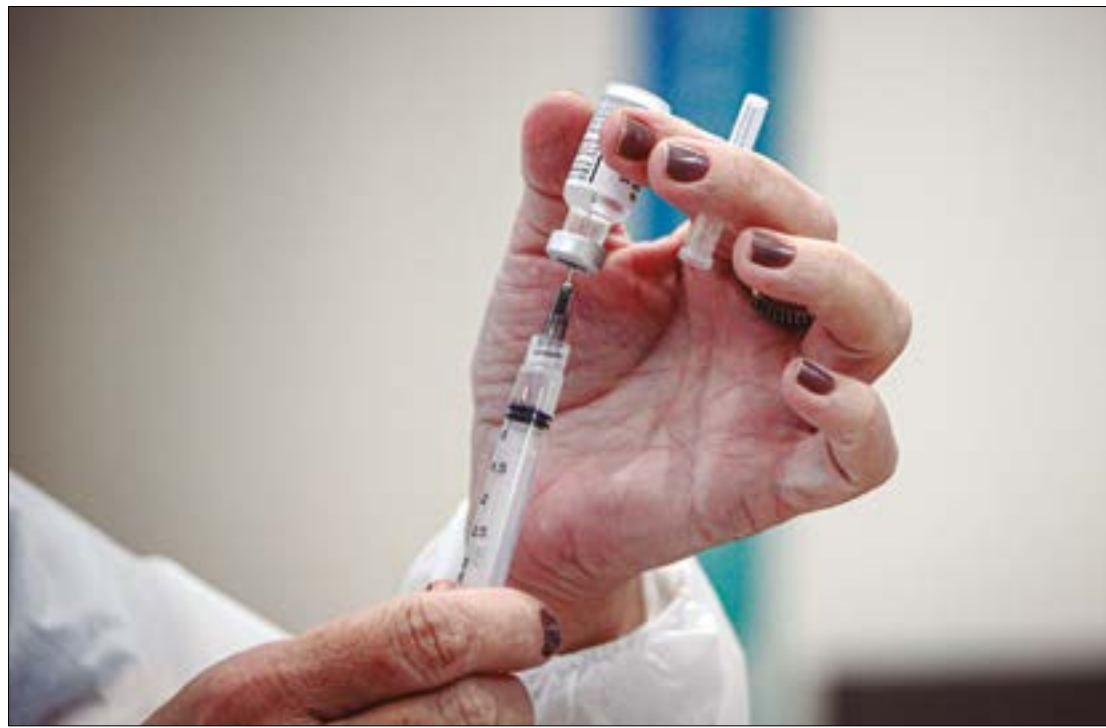
A vacina é recomendada para pessoas que já foram devidamente imunizadas com pelo menos duas doses da vacina monovalente