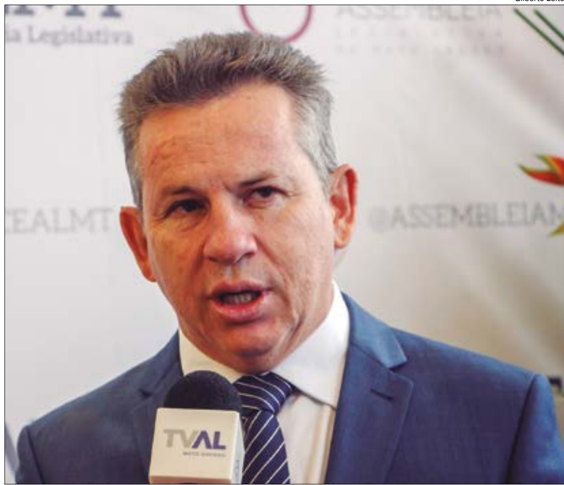
Mauro tenta agilizar análise de processos no TCU e diz já ter dinheiro em caixa para iniciar obras de duplicação da BR-163

Além disso, ele anunciou que o engenheiro Luciano Uchoa Carneiro da Cunha vai chefiar a concessão da BR-163 assim que for concluído todo o trâmite para que o governo assuma a administração da rodovia seja concluída.