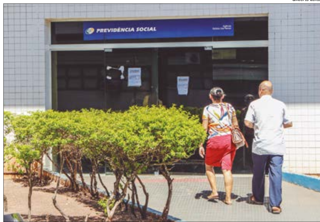
Lupi reiterou que pretende eliminar a fila do INSS até o fim do ano e pede reforço no orçamento

Lupi reiterou que pretende eliminar a fila do INSS até o fim do ano. Ele prometeu que todos os beneficiários terão os processos de pedidos de benefícios decididos em até 45 dias, prazo tradicional de análise do INSS.