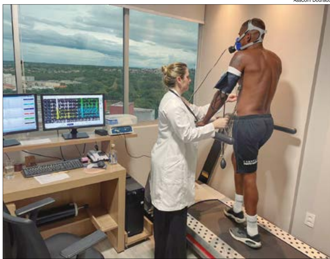
Atletas são submetidos a um controle rigoroso, que vai desde a alimentação até monitoramento físico