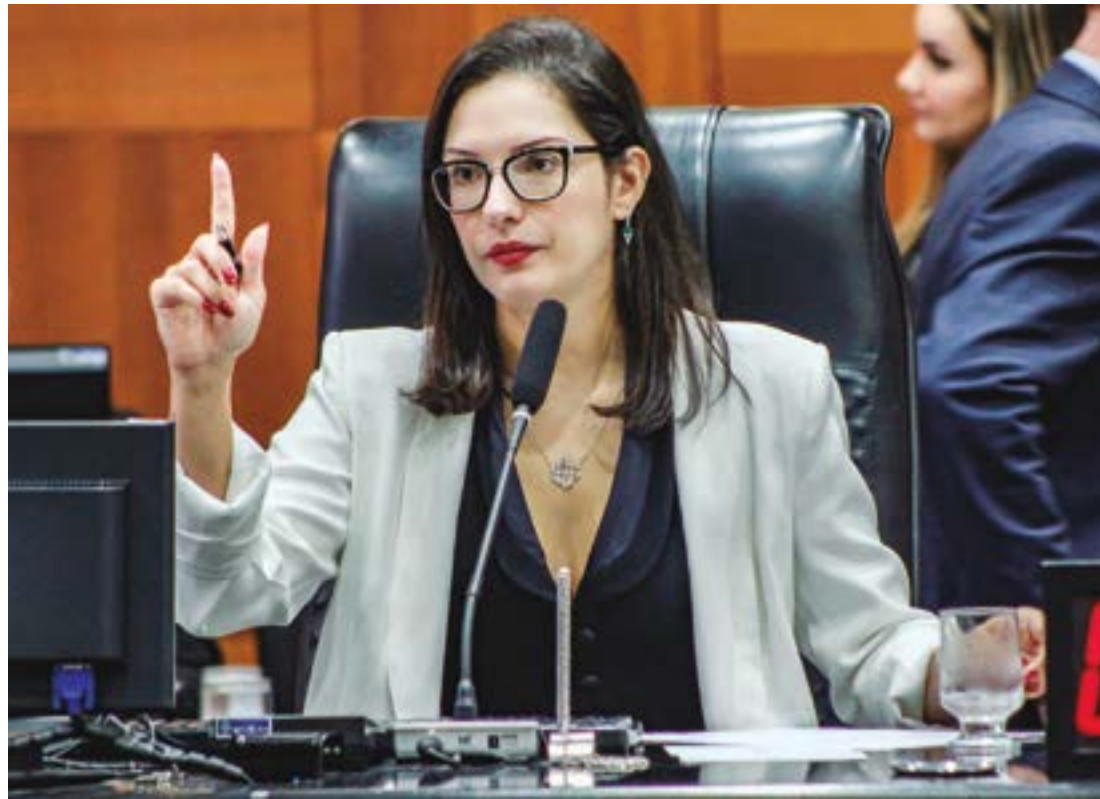
Janaina também defendeu a instalação de câmeras e detectores de metais nas unidades escolares

“Nós apresentamos um projeto de lei, para que todas as escolas estaduais tenham uma mensagem, ‘diga não ao bullying’, em todos os uniformes desses alunos. É algo que vai ficar ali, de uma forma chamativa, na mente desses alunos, para que eles saibam evitar esse tipo de constrangimento que muitas vezes acontece e leva uma criança a uma frustração”, afirmou.