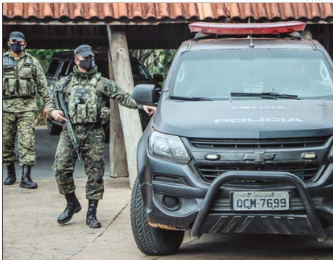
A operação conta com apoio das forças policiais dos Estados de Tocantins, Goiás e Pará