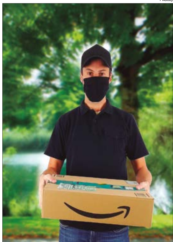
Órgão deve aumentar fiscalização sobre produtos importados, para aplicar alíquota já existente, de 60%