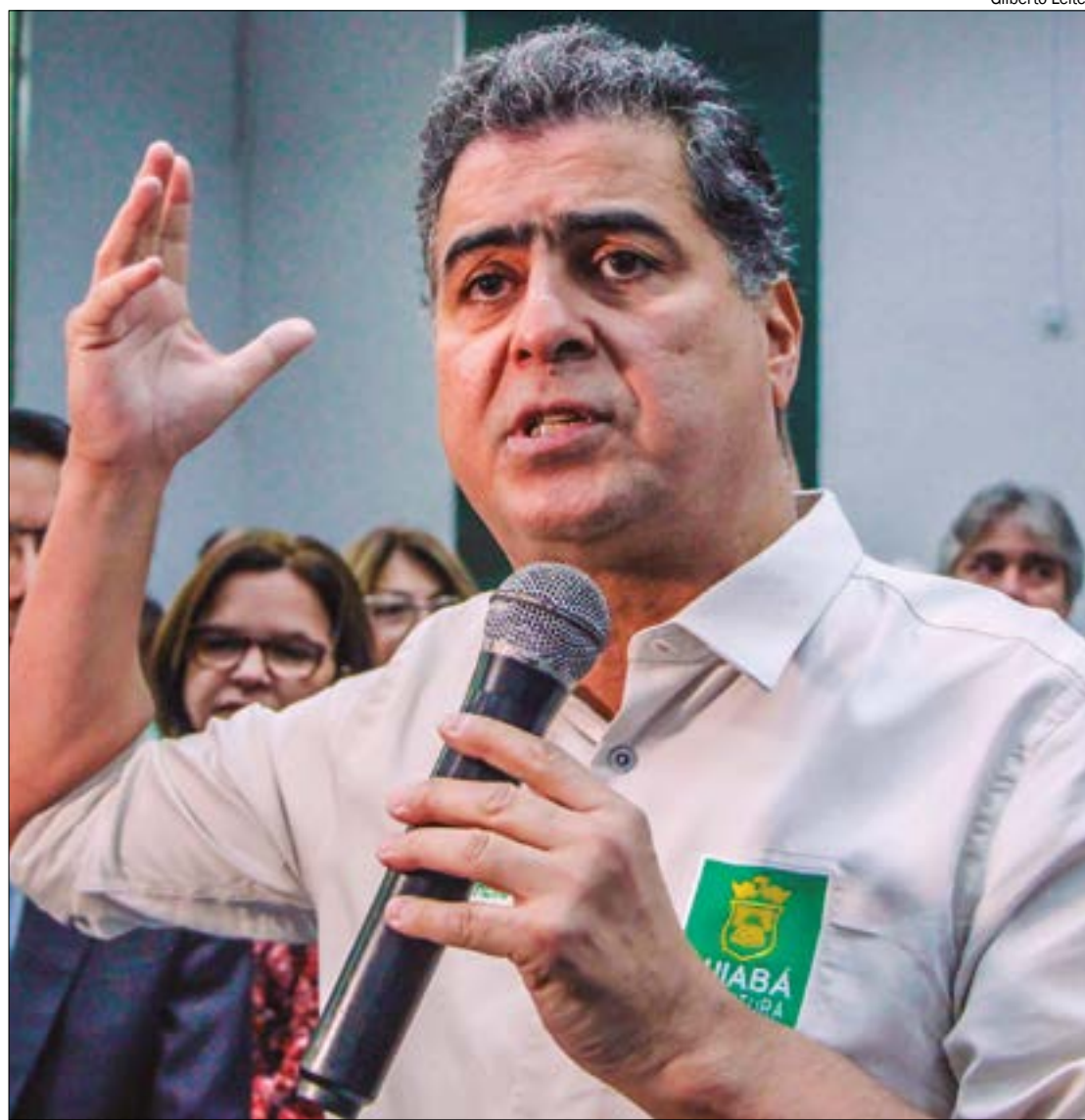
Emanuel quer pacote de medidas preventivas para evitar tragédia em escolas de Cuiabá

“Medida protetiva, a ideia é que o botão de alerta de segurança seja disponibilizado para diretores, coordenadores, professores, profissionais da rede municipal o aparelho vai funcionar como o botão do pânico e se acionado vai alertar forças de segurança para comparecer imediatamente ao ambiente escolar”, disse.