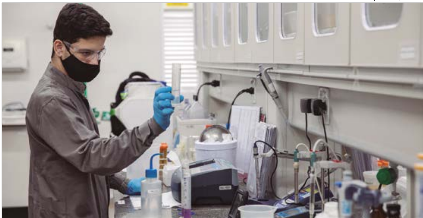
Diferente da cana-de-açúcar, milho permite estocagem, o que dá margem para estabilizar os preços do etanol ao longo do ano

Ao contrário dos demais estados, 75% do etanol de Mato Grosso é feito a partir do milho, garantindo fornecimento do produto durante todo o ano. Já em outros estados, quando ocorre a entressafra da cana-de-açúcar, a oferta do produto cai, aumentando os preços de-