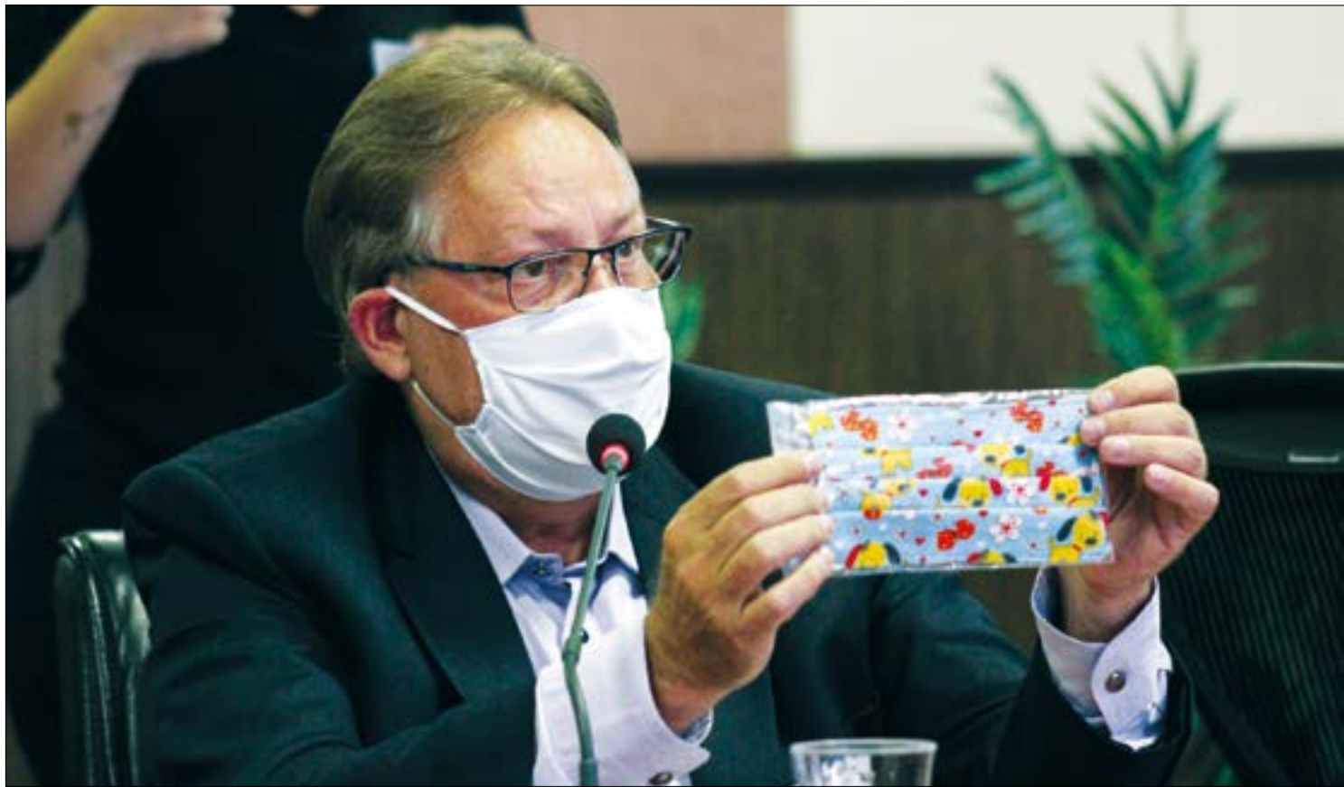
Gilberto Figueiredo admite possibilidade de colapso e cobra que a população respeite as medidas preventivas

O crescimento do número de casos está acontecendo mais rápido do que as projeções do secretário. Na última sexta-feira de maio, dia 28, Gilberto afirmou que os casos iriam dobrar em 15 dias. Naquela manhã, haviam 2.085 casos confirmados e 54 mortes. Em apenas dez dias o número de óbitos mais que dobrou e os casos já estão perto do dobro. O boletim divulgado pela SES neste domingo (7) informa 4.033 casos confirmados e 113 óbitos.