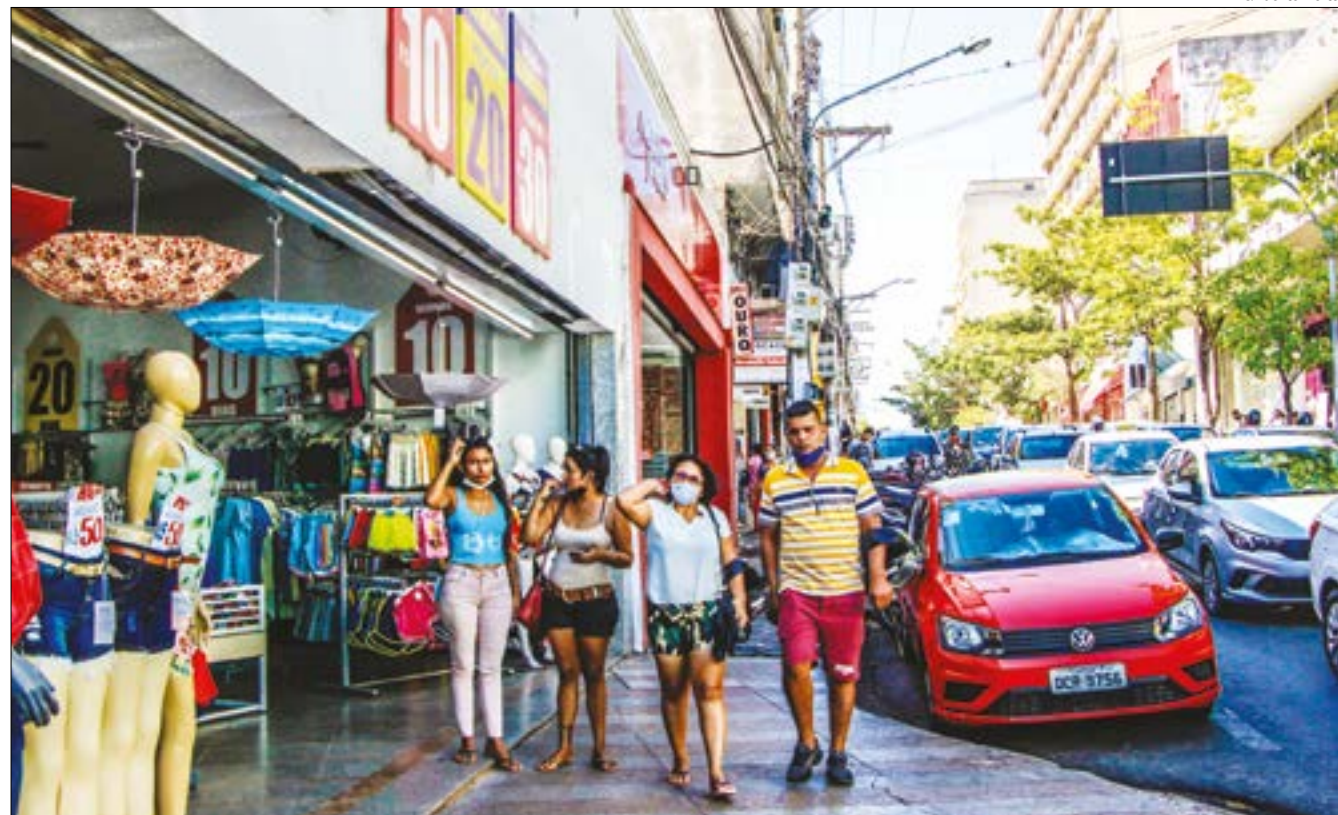
Novo fechamento será pior para os pequenos, já que mais da metade precisou se endividar para reabrir, segundo pesquisa do Sebrae