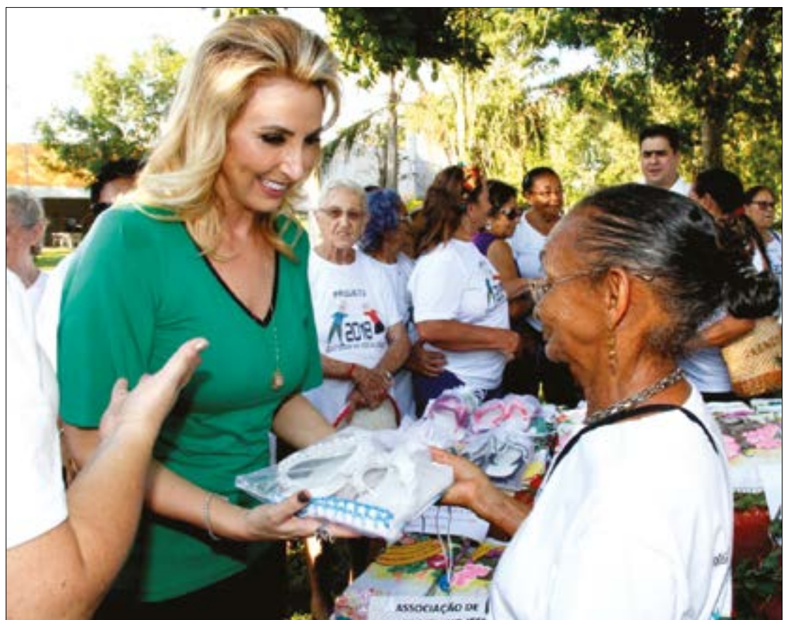
Recebendo o carinho das participantes do projeto Qualifica Cuiabá 300 anos

Outro projeto de grande alcance foi o do Casamento Social 300 Anos, que realizou o sonho de 300 casais com direito a certidão de casamento, vestido de noiva, terno, maquiagem, jantar, orquestra e banda que animou a festa para 3 mil pessoas. O casamento foi realizado no dia 3 de agosto de 2019 e contou com a ajuda de vários parceiros.