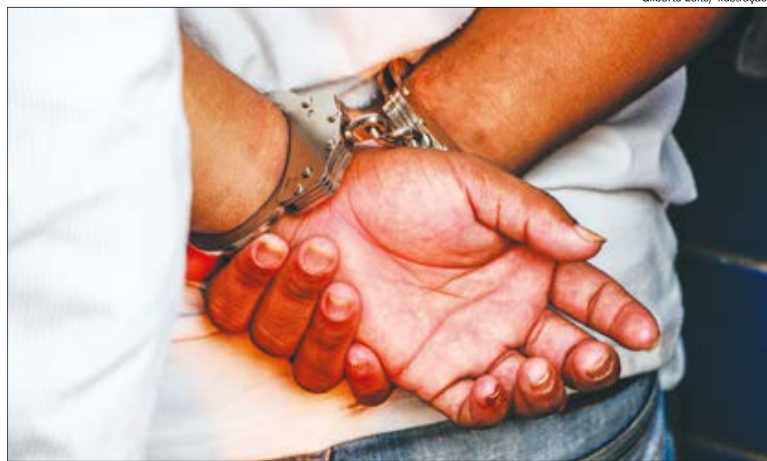
O homem, de 54 anos, foi preso após abusar sexualmente de um garoto de 14 anos e o pai da vítima descobrir