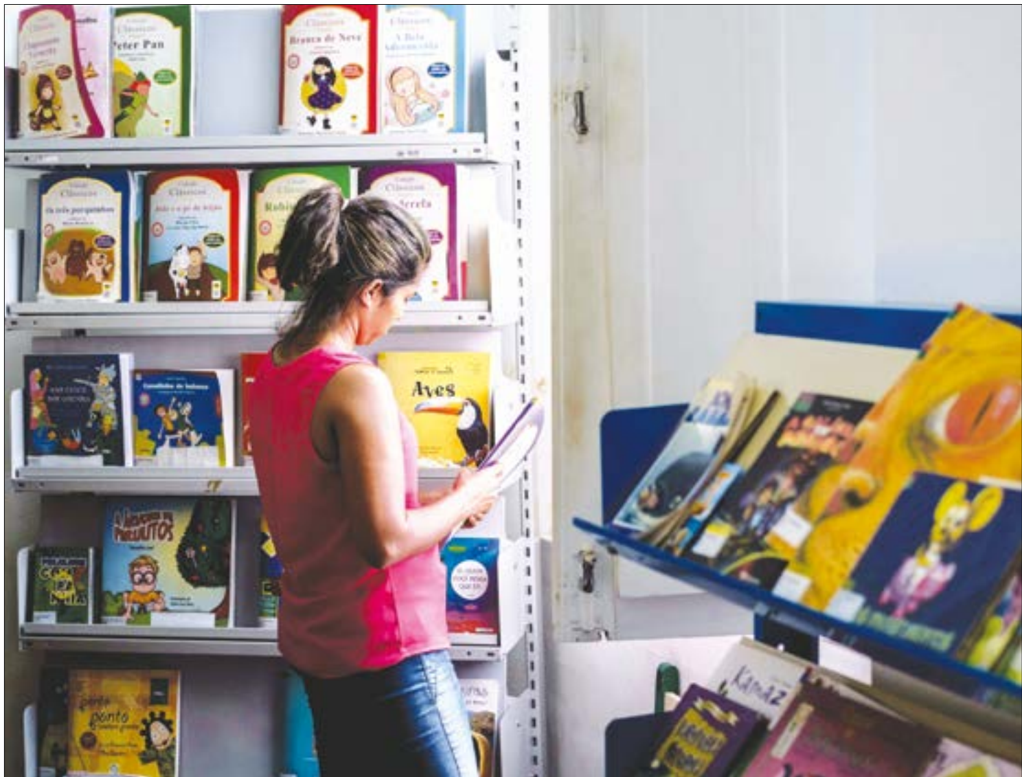
Campanha 'Olha o que estou lendo' compartilha indicações de leitura pela internet, com livros gratuitos

Estevão Curioso - Iniciada em 2019, a ação continua trazendo via internet curiosidades da literatura. Singularidades sobre escritores, publicações