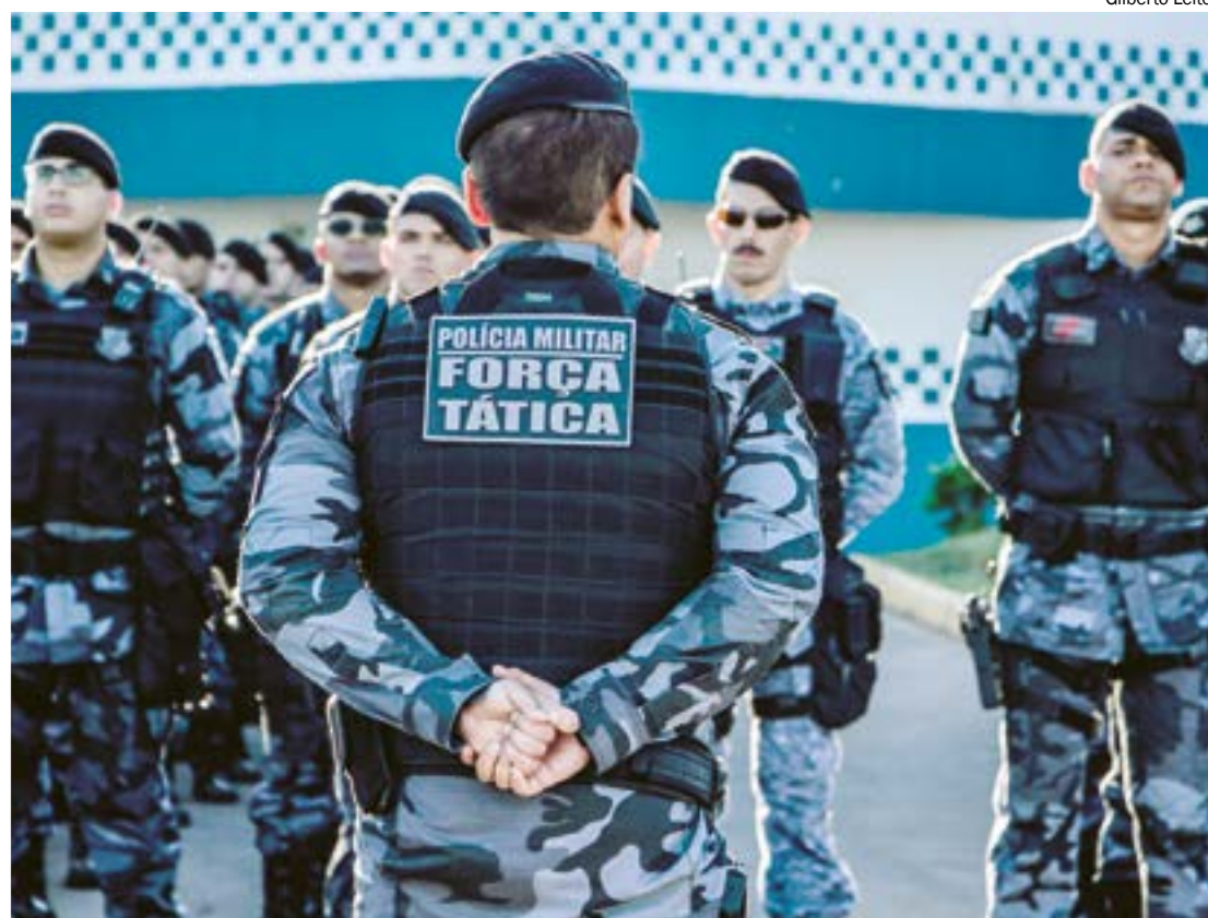
A mobilização nacional inclui ações preventivas e repressivas contra possíveis ataques a escolas em todo o país

“A divulgação de Fake News pode configurar crimes gravíssimos cujas as penas ultrapassam trinta anos de cadeia”, pontua o delegado.