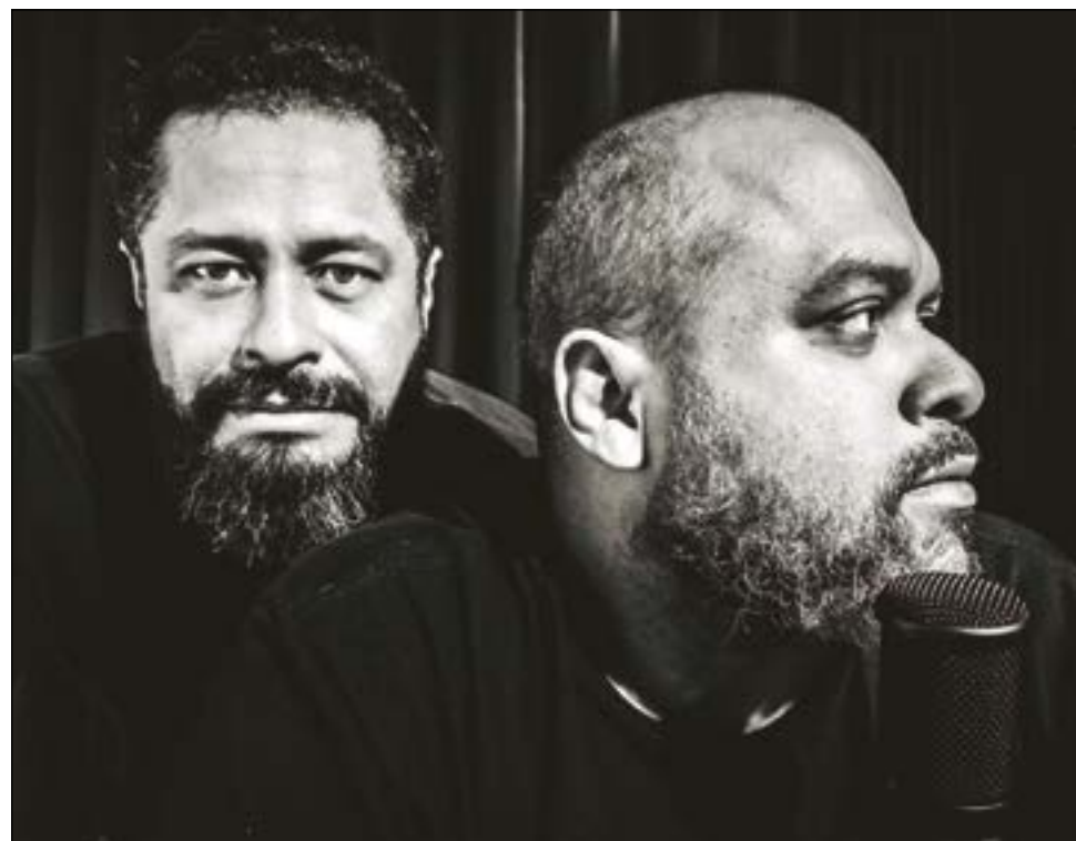
Trilha do Sucesso: Humoristas 'Kbça Pensante' e 'Xômano que mora logo ali'. Depois do podcast Podre de Xique, agora desbravam o estado fazendo stand-up

Um vídeo com cenas chocantes de três onças pintadas sendo torturadas e mortas circula desde março nas redes sociais, gerando grande revolta e indignação pela crueldade das imagens, que mostram uma mãe e seus dois filhotes à mercê dos assassinos. Por isso, o movimento TODOS CONTRA A CAÇA, criado pela união de organizações em defesa dos animais, está promovendo abaixo-assinado solicitando o envolvimento de toda a sociedade para pressionar o Poder Legislativo brasileiro a acabar com a impunidade contra os animais no território brasileiro, para que os responsáveis sejam punidos pelo crime. Aqui em Mato Grosso, que é o paraíso das onças pintadas, é preciso que muito mais seja feito em defesa destes animais. Governantes e sociedade civil não podem se omitir.