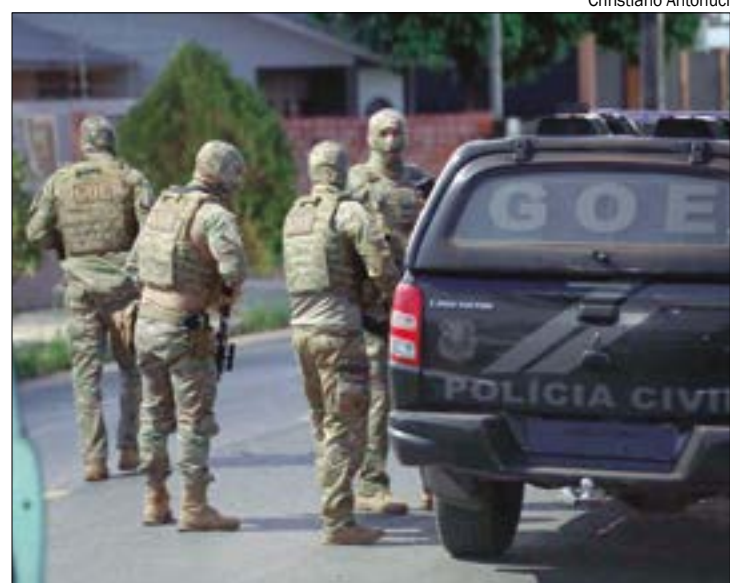
Cerca de 80 homens do Bope, GOE, GCCO e Ciopaer continuam na busca pelos responsáveis no Estado do Tocantins