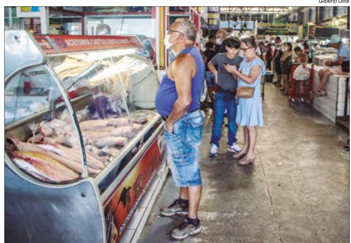
Grupo de alimentação apresentou recuo em março, enquanto combustíveis pressionaram por alta

OUTROS GRUPOS - Na sequência de altas, ficaram saúde e cuidados pessoais (0,82%) e habitação (0,57%). Nos dois casos foram observadas desacelerações em relação a fevereiro, contribuindo com 0,11 pp e 0,09 pp, respectivamente. O grupo saúde e cuidados pessoais foi pressionado, especialmente, pelo