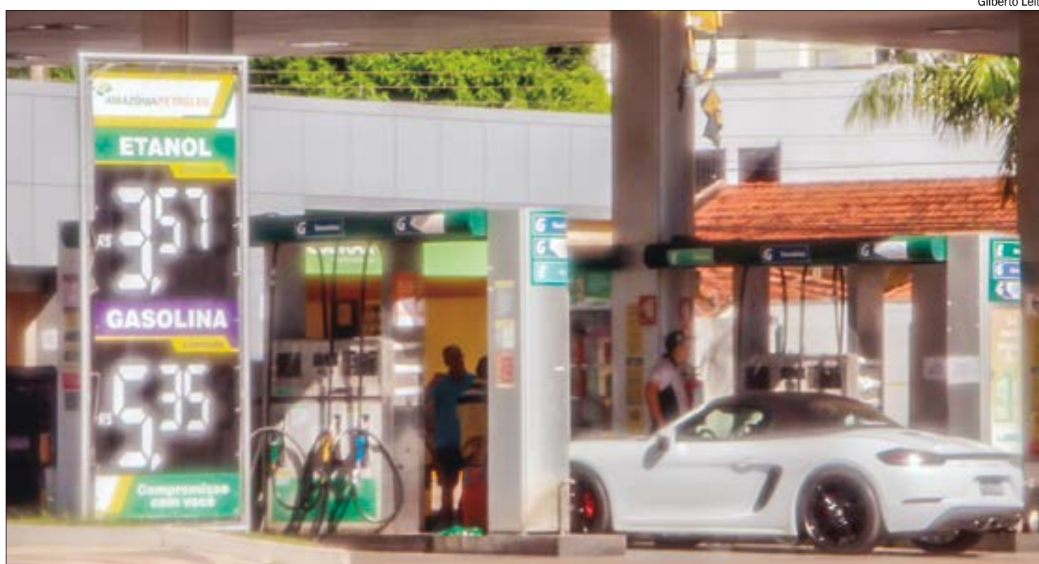
Preços de todos os combustíveis apresentaram recuo em Cuiabá, com destaque para o diesel, que caiu 2%

Já o preço máximo desse derivado do petróleo permaneceu em R$ 5,59. A ANP também deixou de divulgar quais os postos pesquisados, passando a divulgar apenas a quantidade de estabelecimentos sondados. No entanto, o consumidor pode encontrar a gasolina por até R$ 5,15 nesta semana. No preço mínimo, houve queda de 10 centavos, ou 1,9%.