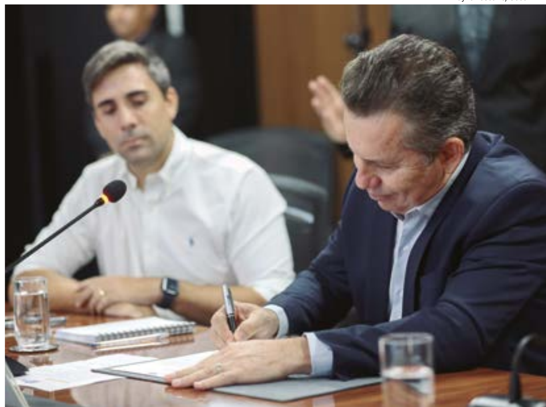
Governador Mauro Mendes anuncia novo valor do repasse para as Apaes

“Eu estou muito emocionada. É com muita alegria que recebemos esse aumento. Essa é uma luta de muitos anos, e representa muito para a gente”, completou.