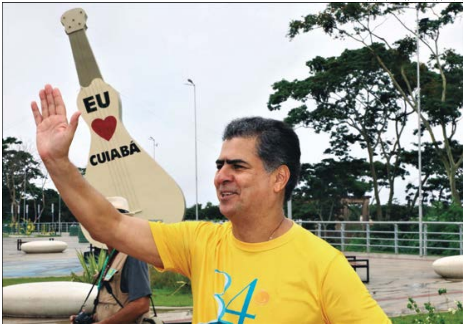
Grande aniversariante de hoje, 12 de abril, o prefeito de Cuiabá, Emanuel Pinheiro

A prefeitura vai encarar o duro desafio de substituir a rede de energia em postes para que sejam subterrâneas, preservando o espaço de arborização. É um trabalho árduo, caro e que exige intenso planejamento. Em cada bairro haverá diálogo com a comunidade para definir o que plantar e onde plantar. Então, de forma democrática e envolvente, vai ser definida e delineada a arborização para os próximos anos. É um corajoso planejamento de Cuiabá para o futuro e o prefeito Emanuel mais uma vez assume uma proposta de transformação em benefício de nossa capital.