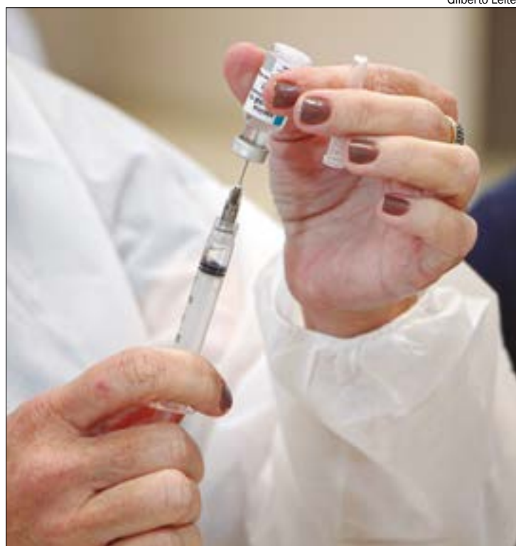
Mato Grosso recebeu 364 mil doses da vacina; municípios devem definir a estratégia para alcançar o público alvo

O que é a influenza? A influenza é uma infecção viral aguda que afeta o sistema respiratório e é de alta transmissibilidade. A estratégia de vacinação contra a influenza foi incorporada no Programa Nacional de Imunizações (PNI) em 1999, com o propósito de reduzir internações, complicações e óbitos na população-alvo.