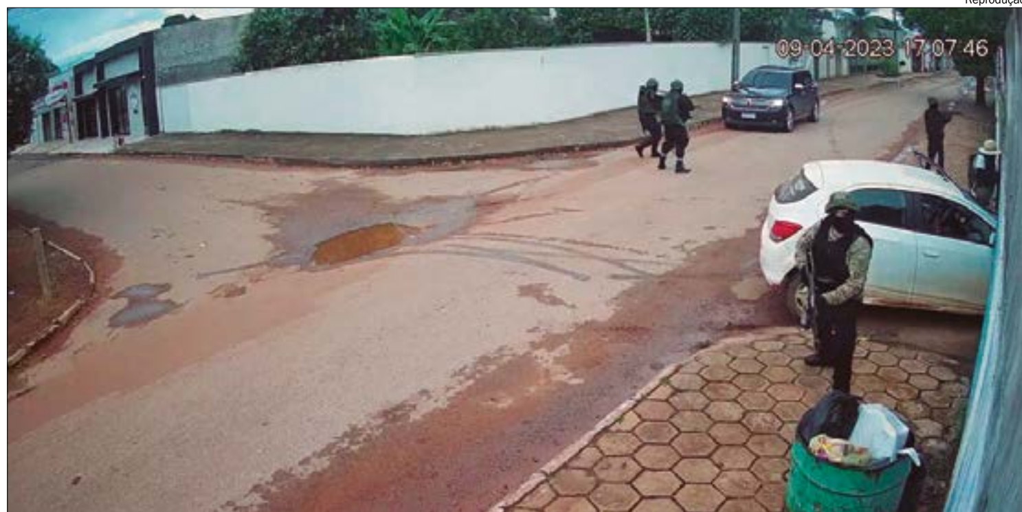
Os bandidos invadiram a cidade para assaltar uma a empresa de transporte de valores Brinks

*Estagiário sob a supervisão do editor Tarley Carvalho