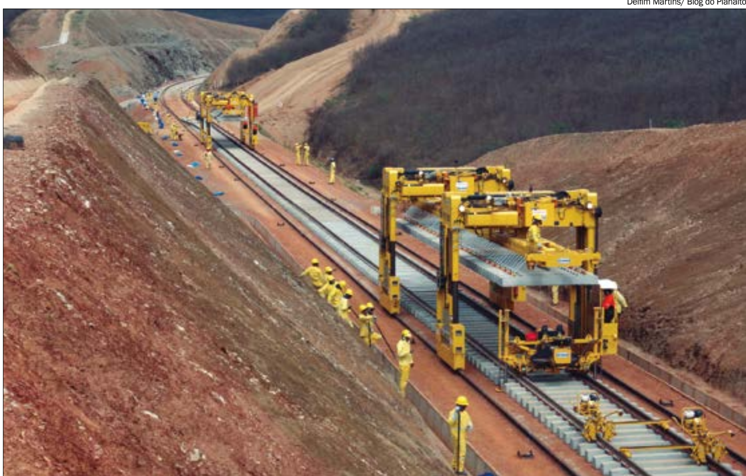
Com a nova licença, Rumo já tem 80 quilômetros liberados para implantação de trilhos em Mato Grosso

Na avaliação do secretário, as obras seguem "a passos largos". Ele tem acompanhado de perto as movimentações para construção da ferrovia até Cuiabá, um sonho antigo de seu pai, o ex-senador Vicente Vuolo. A empresa já informou o local onde o terminal deve ser instalado em Cuiabá e o município está realizando ajustes no plano diretor