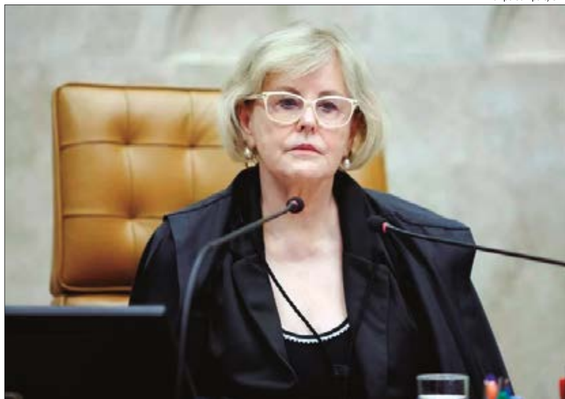
Recurso da Prefeitura está sob relatoria da ministra Rosa Weber, presidente do STF

STF, a Prefeitura de Cuiabá já notificou os bancos para que não recebam o IPTU com valor reajustado.