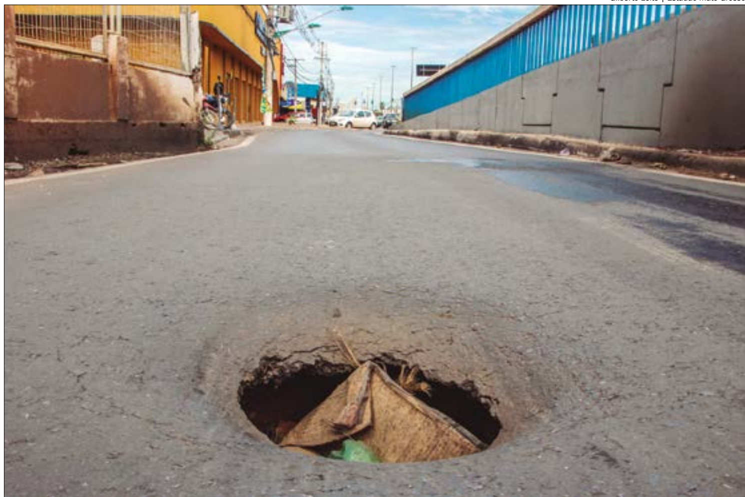
Outro problema enfrentado pelos cuiabanos é a falta de infraestrutura na cidade

Além disso, o presidente também lembrou que além da tragédia que ceifou a vida de Orlando, todos os dias, dezenas de outros motociclistas sofrem com os problemas nas vias. "Toda semana a gente tem motoqueiro acidentado, ralado, com algum membro quebrado,