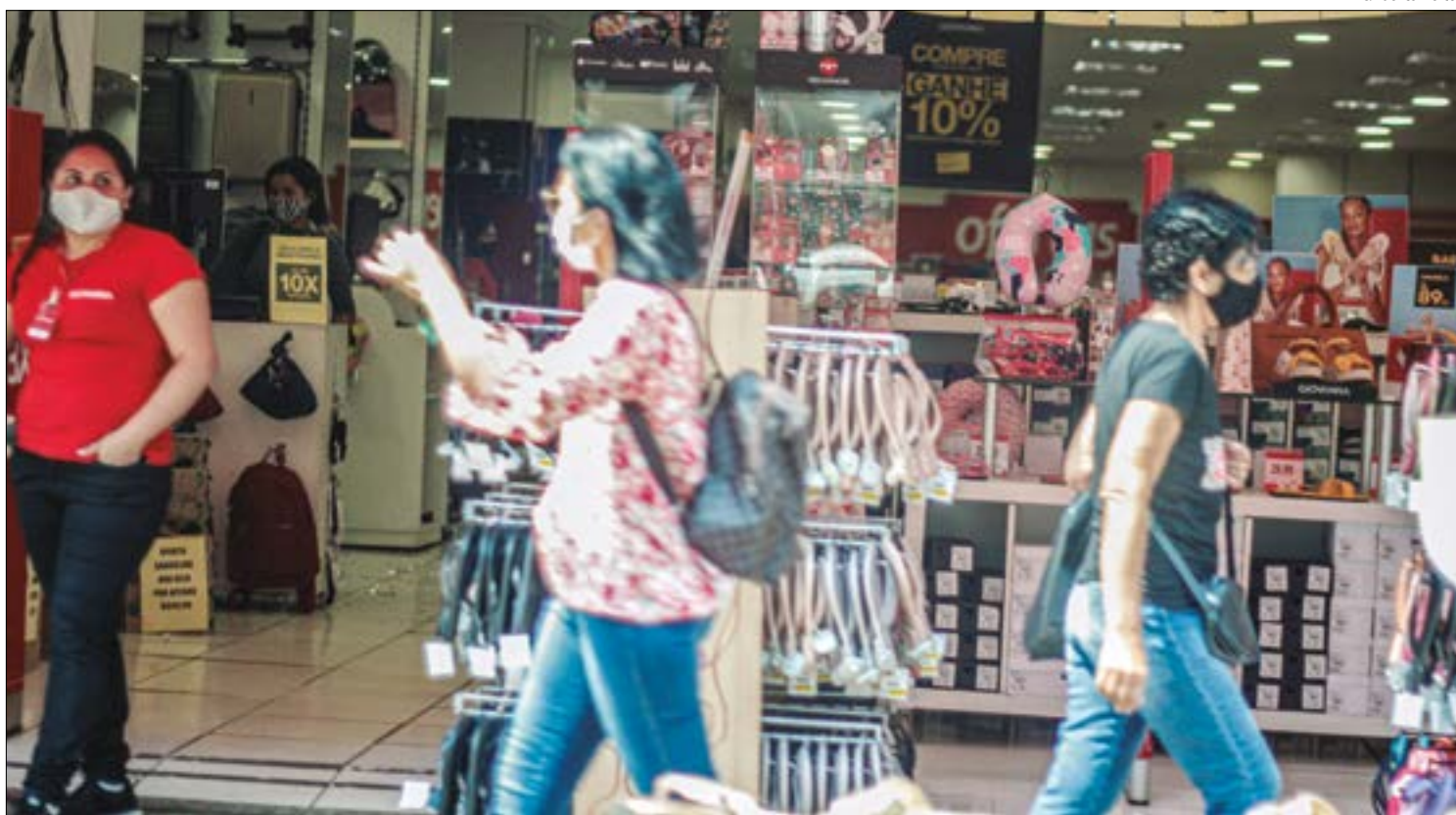
Empresários afirmam que plataformas internacionais burlam a lei para não pagar imposto e praticam concorrência desleal

Fernandes reforça a importância de se taxar essas plataformas de comércio on-line para garantir a justiça com os empresários brasileiros e não prejudicar o país e os cidadãos que aqui vivem. Ele espera que os movimentos em Brasília que buscam cobrar do governo federal essa taxaço