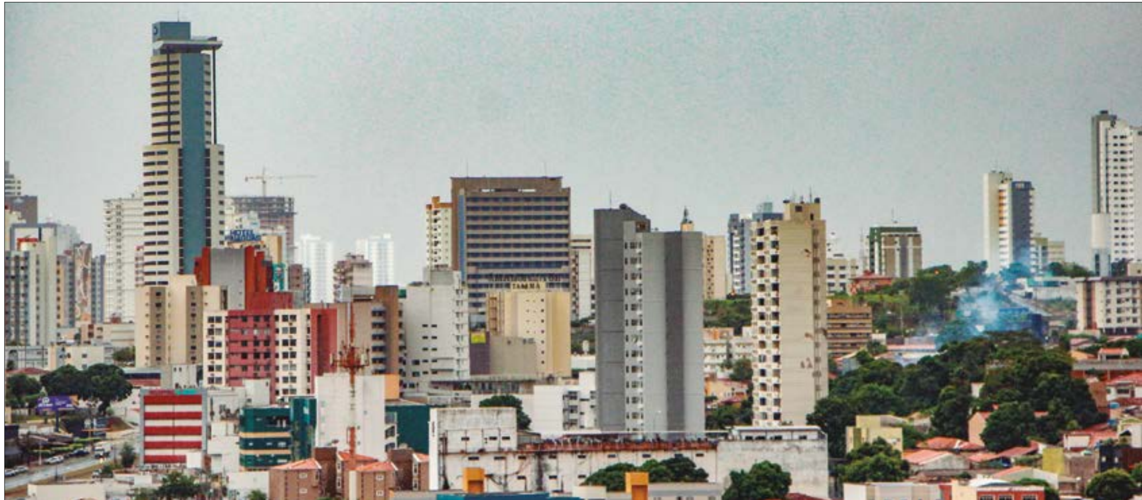
A terrinha mais calorosa do Brasil completa 304 anos neste sábado, 8 de abril