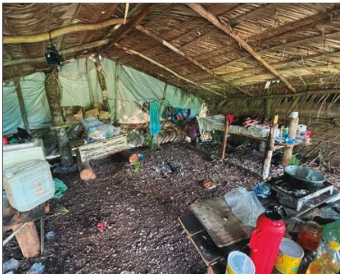
A inserção do nome na "Lista Suja" permanece por 2 anos, sendo retirada após esse período

A inclusão de empregadores flagrados na situação ilegal é prevista na Portaria Interministerial MTPS/MMIRDH nº 4 de 11/05/2016 e ocorre desde 2003, sendo atualizada semestralmente pelo MTE com a finalidade de dar transparência