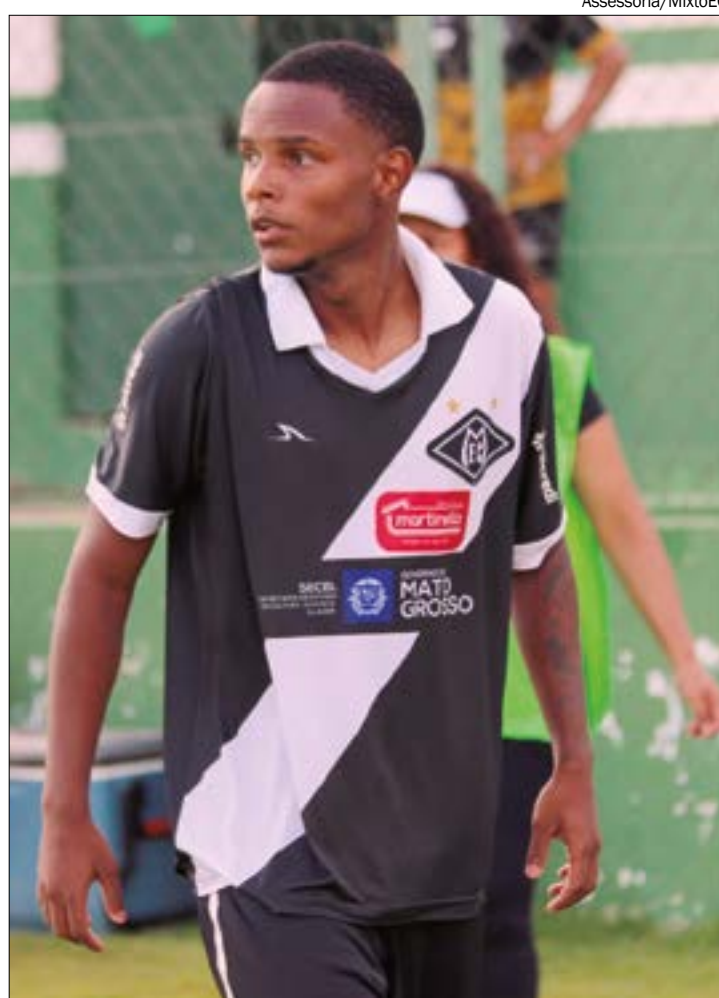
Anthony se destacou entre os profissionais no Campeonato Mato-grossense e conquistou o respeito da diretoria

*Estagiário sob supervisão do editor Gabriel Soares