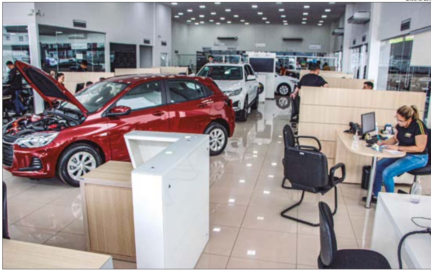
Veículos comerciais leves foram destaque no mês, com aumento de 53,79% em relação a fevereiro

Nesse segmento, a Fiat Strada lidera as vendas, com 1.028 unidades, na frente da Toyota Hilux, que emplacou 803. Em