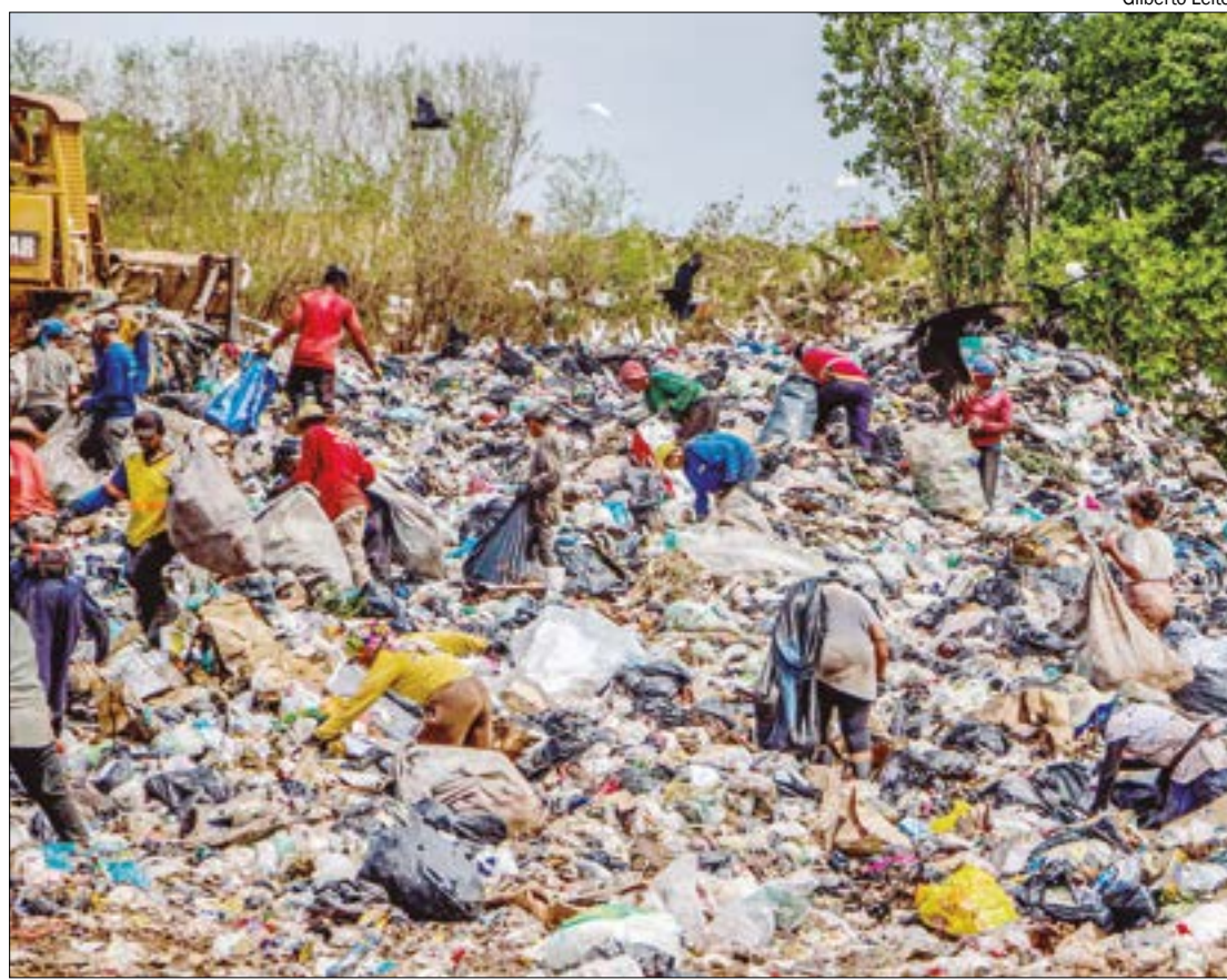
A nova estrutura possui uma série de tecnologias de proteção ambiental e é a primeira deste tipo na região Centro-Oeste.

(Com informações da Assessoria de Imprensa)