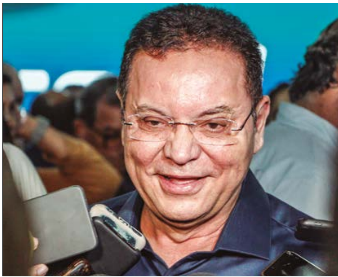
Segundo Botelho, Fachin disse não ver inconstitucionalidade na lei que proíbe PCHs no Rio Cuiabá

“Nós explicamos pra ele que nós não estamos invadindo a competência da União, nós estamos apenas fazendo uma restrição a um trecho que corre perigo de destruir todo o Pantanal. Mostra-