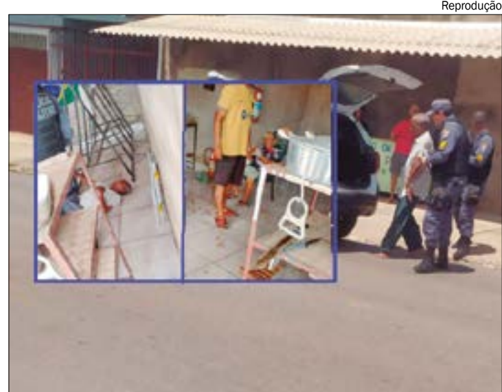
O homem mais novo levou golpes de faca na cabeça enquanto que o mais velho foi ferido na mão