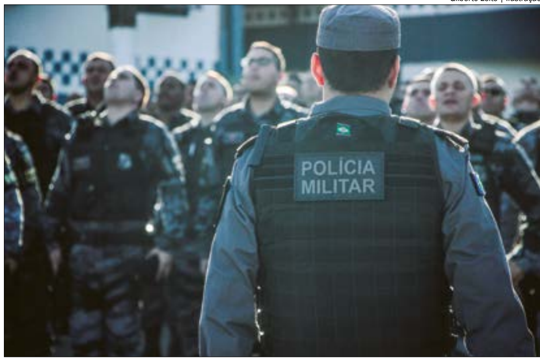
MT também vai implantar o programa “Vigia Mais MT”, que vai colocar 15 mil câmeras nas fardas de policiais