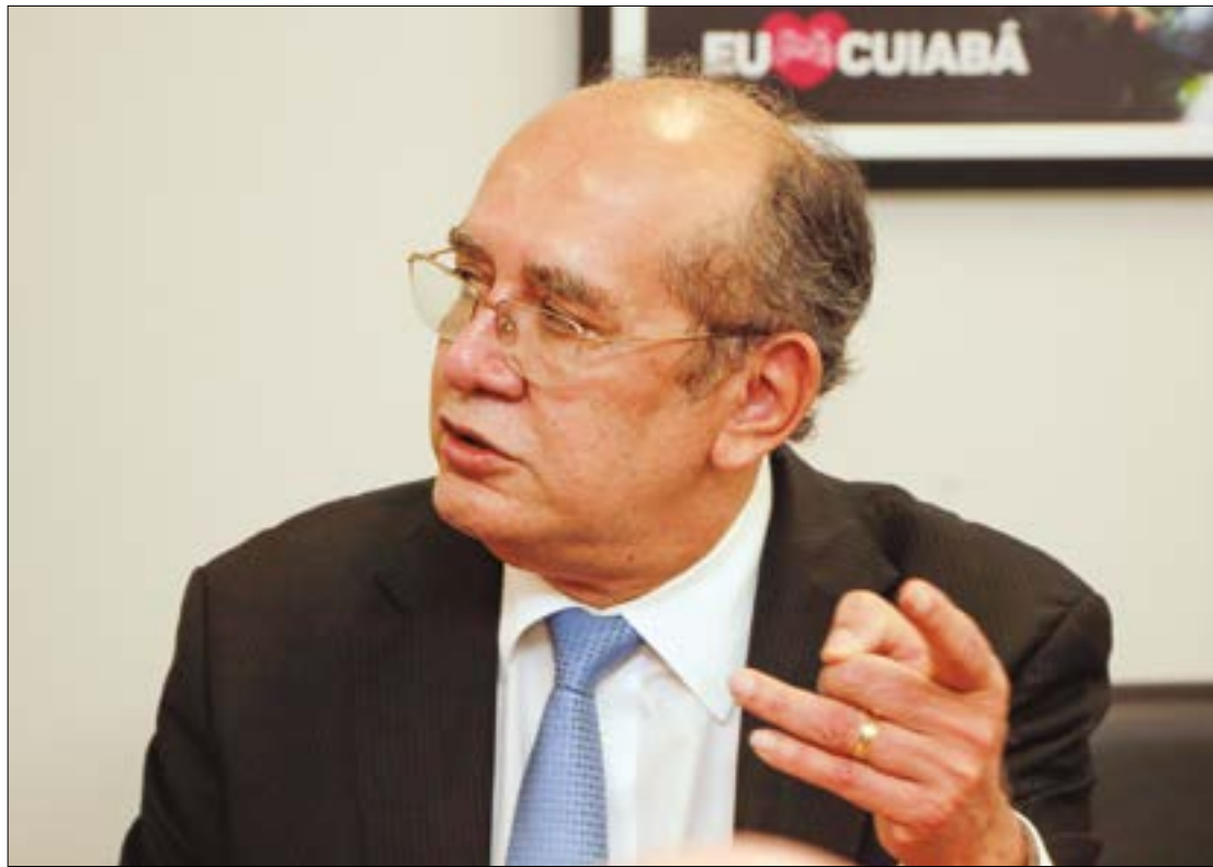
Ações que contestam o Fethab estão sob relatoria do ministro Gilmar Mendes

Já a Advocacia-Geral da União (AGU) se manifestou pela rejeição da ação da Abiec. O processo está parado na Suprema Corte desde fevereiro de 2021.