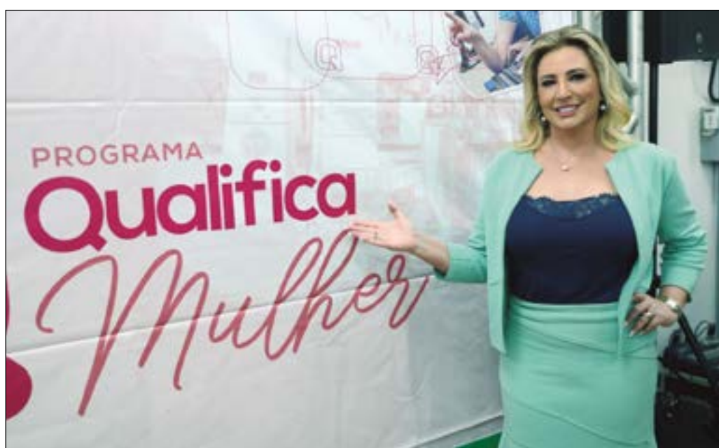
A primeira-dama de Cuiabá, Márcia Pinheiro, lançou mais 600 vagas em cursos de qualificação, em parceria com o Serviço Nacional de Aprendizagem Comercial (Senac). As vagas são referentes à segunda etapa do programa Qualifica Mulher, uma ramificação do Qualifica Cuiabá, programa este que já certificou mais de 6 mil pessoas, sendo 80% mulheres. Parabéns à primeira-dama pela nobre iniciativa!