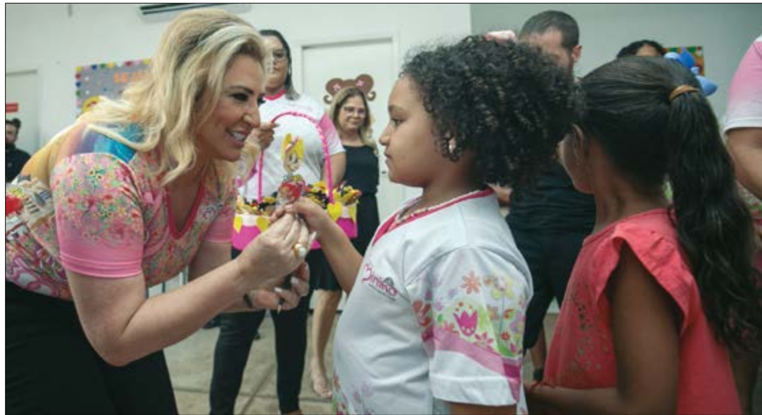
A primeira-dama Márcia Pinheiro acompanhou a abertura das atividades do Programa Siminina