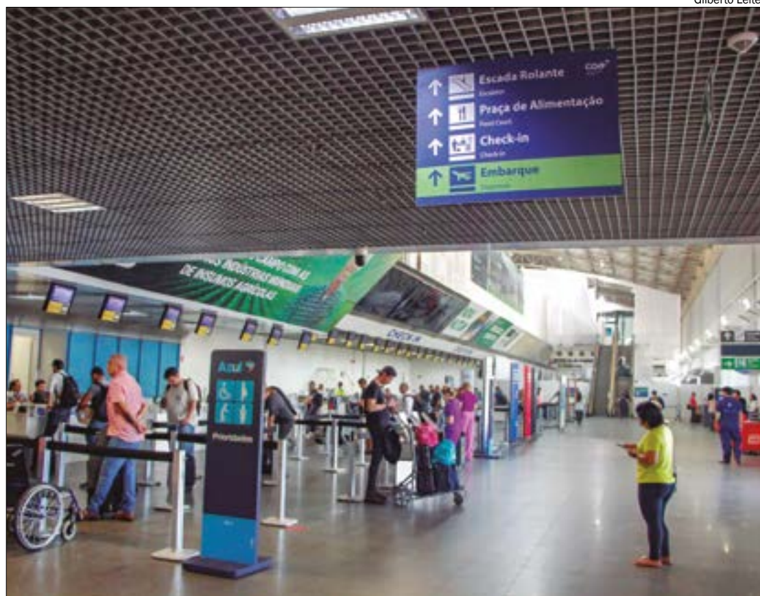
Obras para internacionalização do Aeroporto Marechal Rondon devem ser concluídas até dezembro, diz concessionária