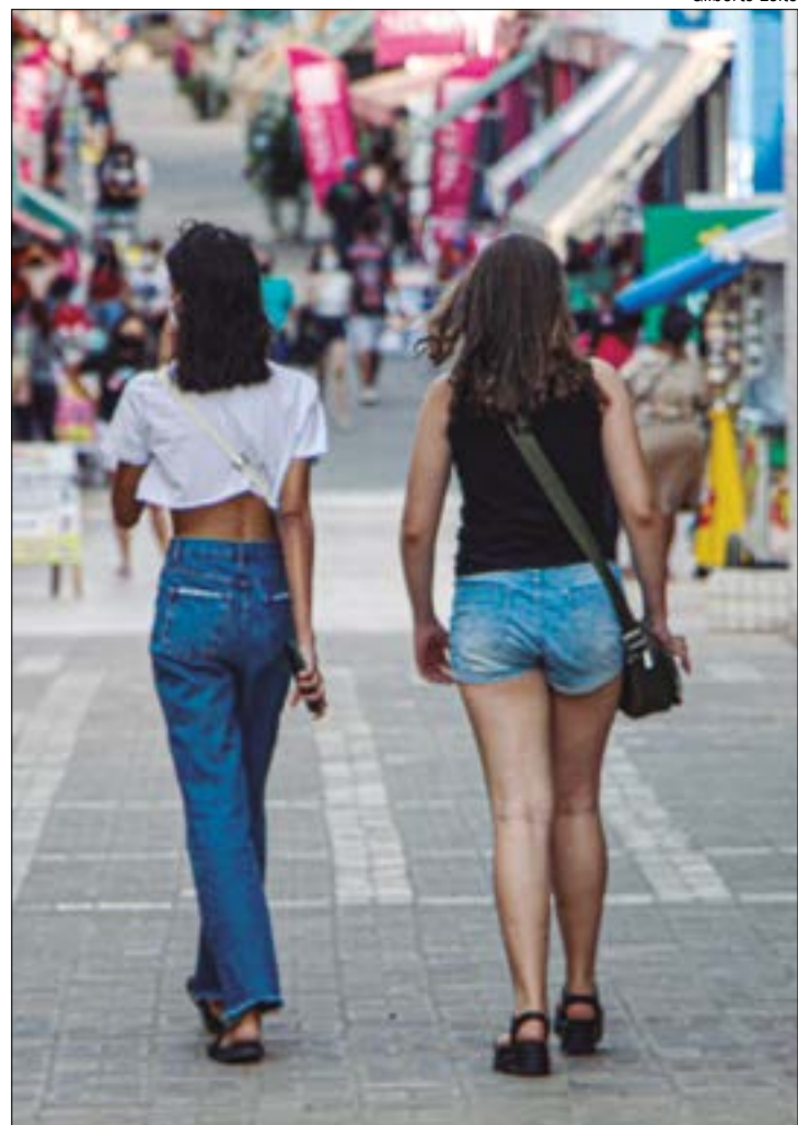
Pesquisa indica que mulheres são maioria entre consumidores com dívidas atrasadas