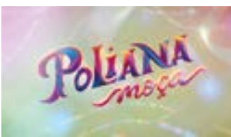
POLIANA MOÇA SBT – 20h30

Quinta-feira (9) – Lumiar é grosseira com Marlene e causa estranheza em Ben. Yuri sai da cadeia. Kate repara no des controle de Jenifer ao ficar perto de Eduardo. Lumiar reclama contrariada quando Ben diz que quer trabalhar com os alunos dela no ICAES. Yuri leva o abaixo-assinado para falar com o reitor do ICAES. Sol conversa com o DJ Be-Air sobre o seu sonho e fica frustrada. Jenifer conhece Isabel, mãe de Tatá. Yuri, Bela e Ben participam da reunião do coletivo negro. Sol se encontra com Lumiar no escritório. Com dor nas costas, Simas pede ajuda a Theo. Lumiar sugere que Sol conte a verdade para Jenifer, e as duas discutem. Sol deixa a sala de Lumiar e se desespera ao ver Theo.