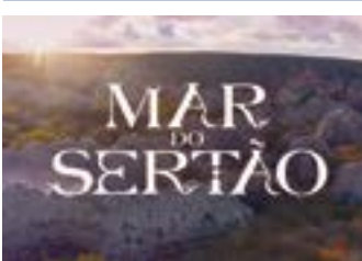
MAR DO SERTÃO Globo – 18h15

Os resumos dos capítulos de todas as novelas são de responsabilidade de cada emissora. Os capítulos que vão ao ar estão sujeitos a eventuais reedições