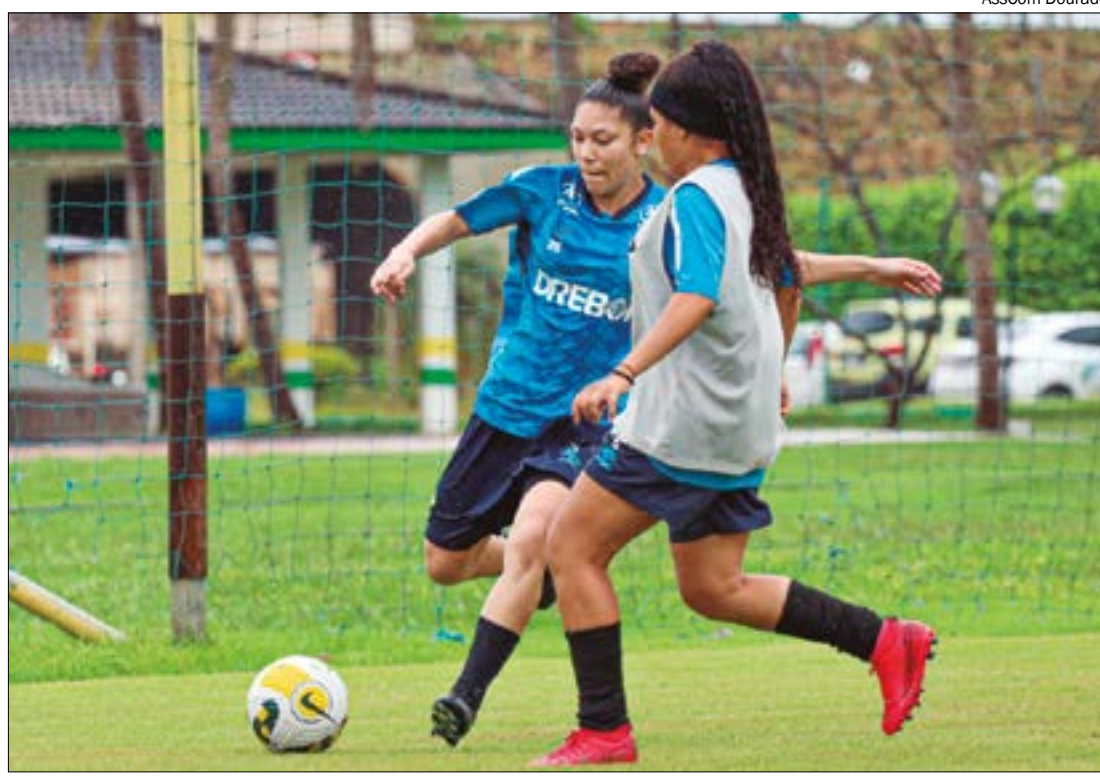
Primeira competição a ser disputada é o Campeonato Mato-grossense da categoria sub-20

As meninas do Dourado seguem em treinamento e, nas próximas semanas, vão disputar alguns amistosos e jogos-treinos para aprimorar ainda mais a preparação para os desafios da temporada. Os treinos do time feminino do Cuiabá acontecem no CT da Beira-rio, no CT do Dourado e também no CT Pé de Moleque, em Várzea Grande.