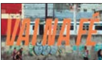
VAI NA FÉ Globo – 19h15

Quinta-feira (9) – Márcio Castro avisa a Deodora que a fazenda Palmeiral pertence a ela novamente. Tertulino fica confuso ao acordar em sua casa na cidade. Deodora revela a Ismênia que se casará com Márcio Castro. Timbó leva Xaviera para morar em sua casa. Candoca descobre que o dinheiro para as obras do hospital foi desviado. Vespertino pede para Eudoro publicar uma matéria sobre o passado de Deodora. Candoca tira satisfação com Floro sobre o dinheiro para a construção do hospital, e Vespertino culpa Deodora. José expulsa Fubá Mimoso do Catende quando ele se recusa a contar quem o contratou para matá-lo. Xaviera pede para Tertulino se entregar à polícia antes que José descubra a verdade. José garante a Candoca que os culpados pelo desvio da verba para o hospital devolverão todo o dinheiro.