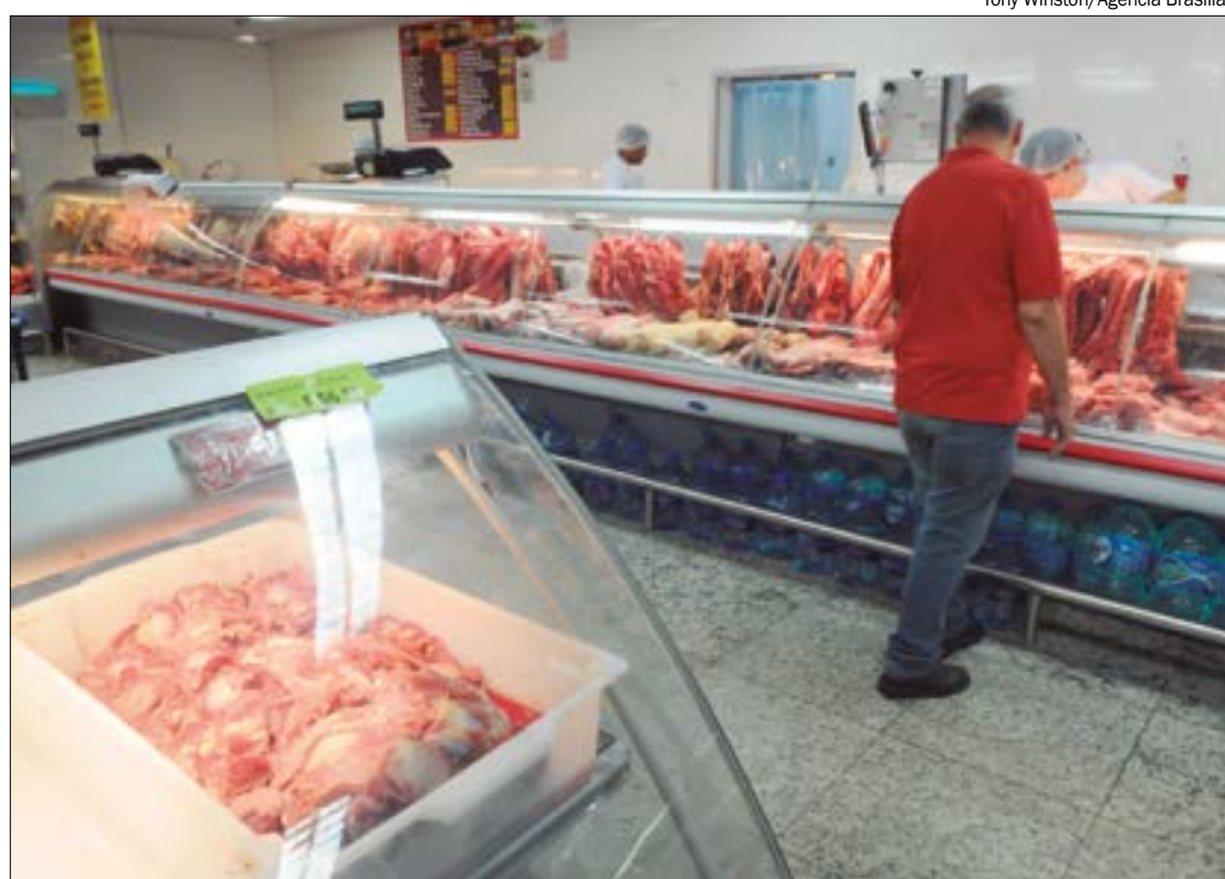
Preços da carne bovina caíram devido ao aumento na oferta de proteína no mercado interno

Na noite dessa terça-feira (7), representantes do Mapa vão se reunir com autoridades sanitárias chinesas para tentar levantar o embargo. Membros do governo trabalham com a hipótese de já retomar as exportações na quinta-fei-