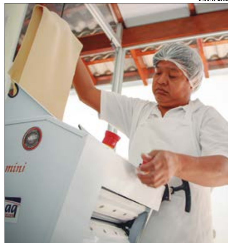
Mesmo nos setores de atividades em que as mulheres são maioria, em média, elas recebem menos