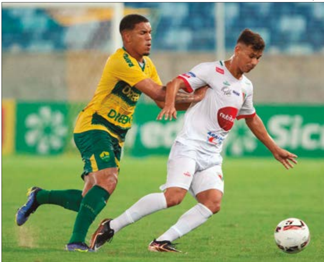
Daniel marcou oito gols em oito jogos, feito que o colocou como artilheiro isolado do Mato-grossense