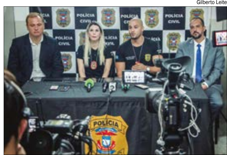
Cerca de 19 pessoas foram lesadas pelo golpe. A soma dos valores tomados das vítimas ultrapassa R$ 1 milhão