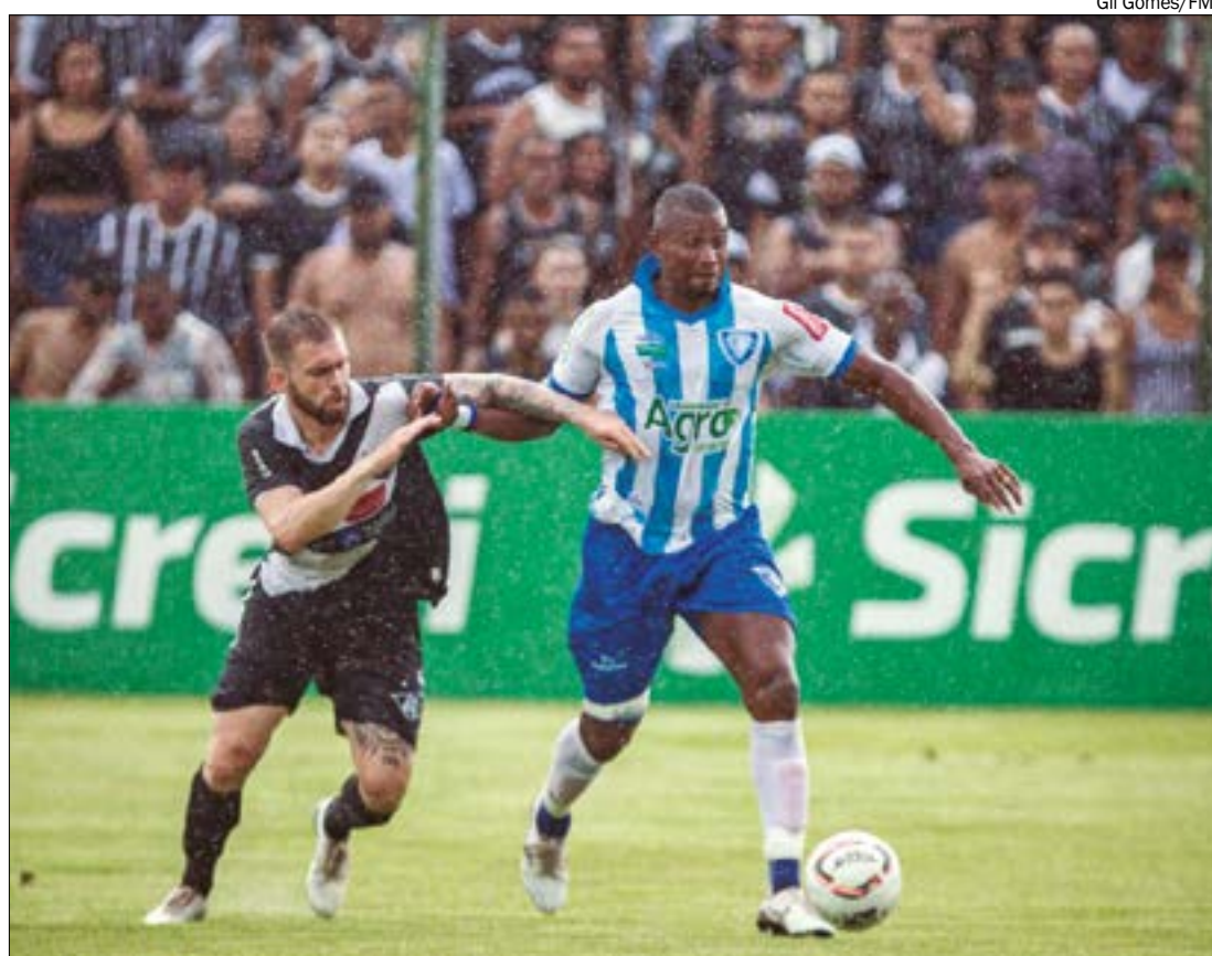
'Lei do ex' pesou contra o Mixto, que não conseguiu sua vaga nas eliminatórias, mas conseguiu escapar da degola

LUVERDENSE X ACADEMIA - O Luverdense venceu o Academia por 2 a 1 e garantiu um feito heroico, ao sair da zona de