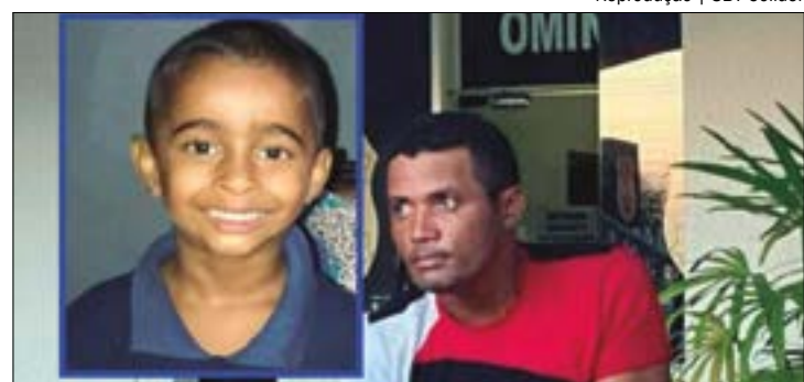
O corpo da criança foi encontrado pelo Corpo de Bombeiros. O homem confessou o crime