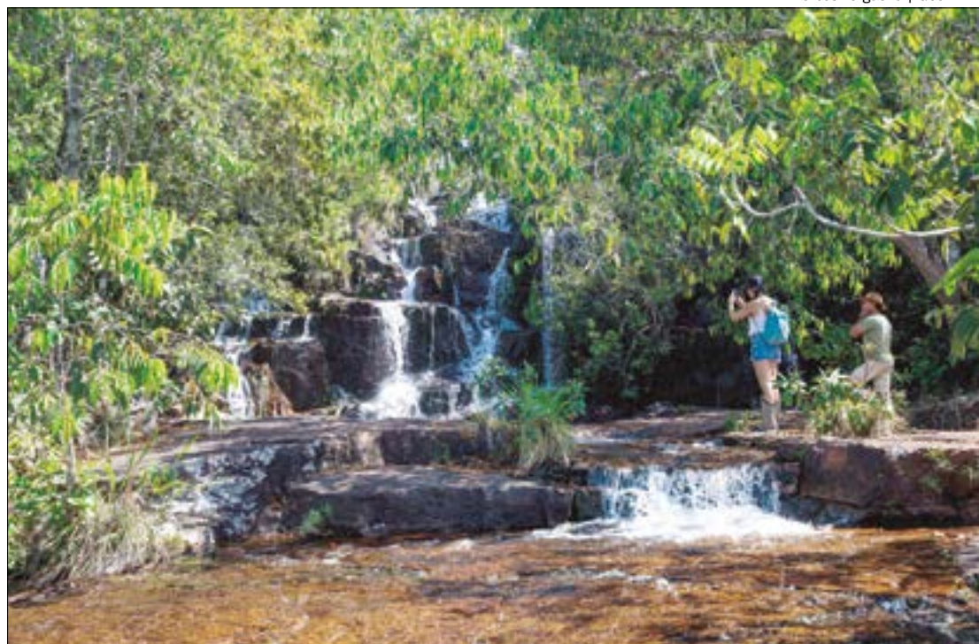
O contrato prevê que a cobrança de ingresso terá aumentos graduais

No recurso, o governo tentava reverter o despacho administrativo que rejeitou a 'Garantia da Proposta' apresentada pela MT-Par. Sem essa garantia, a estatal foi considerada inapta para participar do processo de licitação.