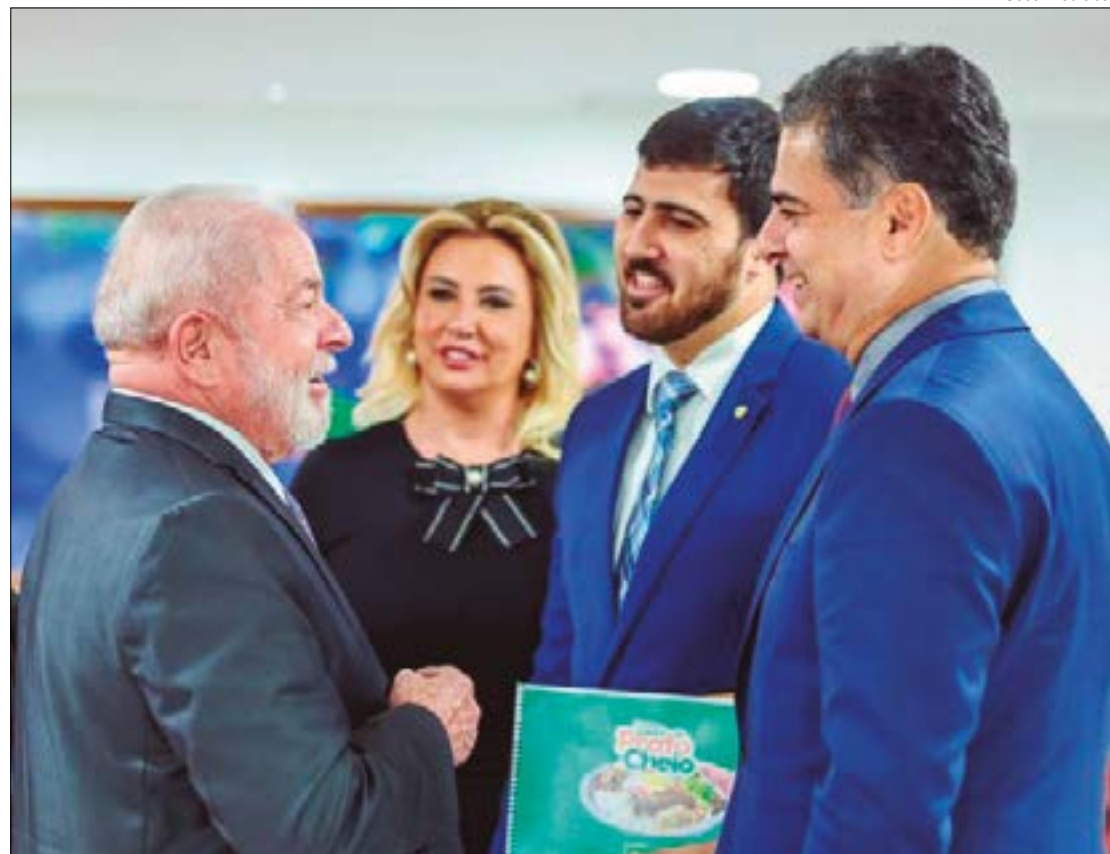
Emanuel articula visita de Lula no aniversário de Cuiabá, para entregar Cuiabanco e UPA do Leblon