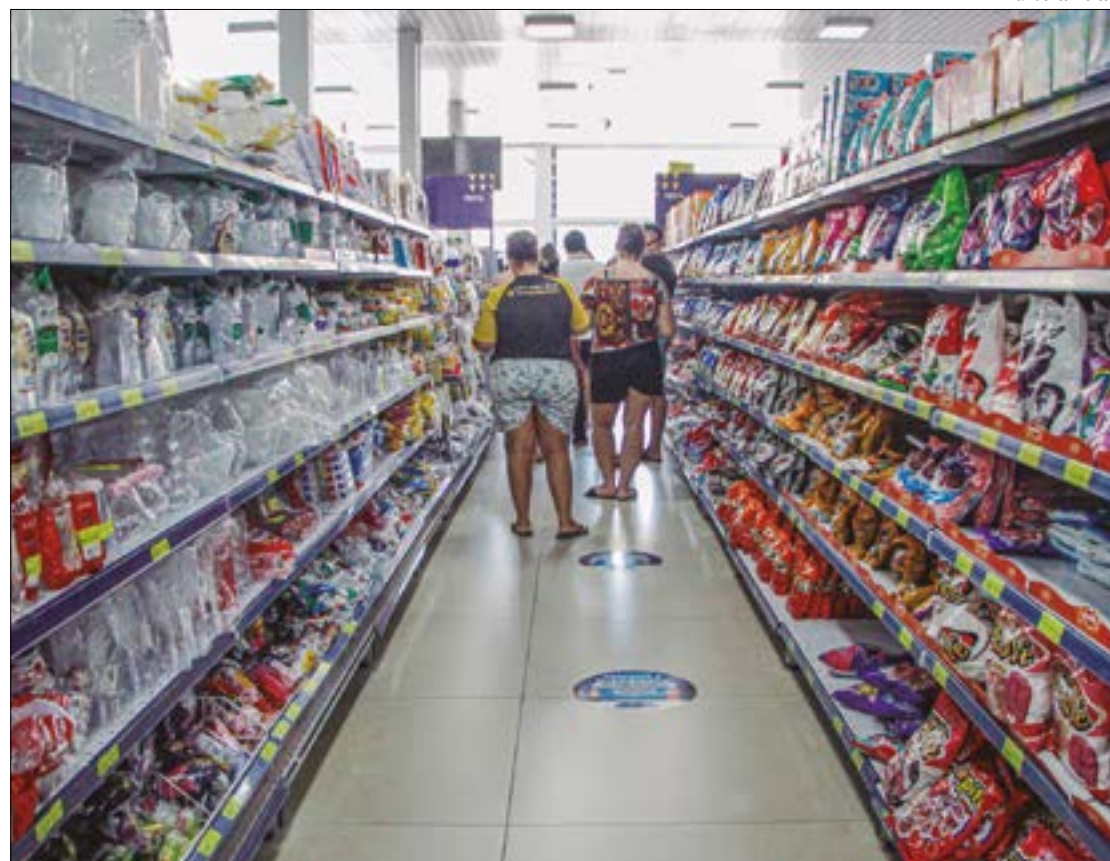
Tomate foi o produto que teve maior aumento na última semana, junto com a batata