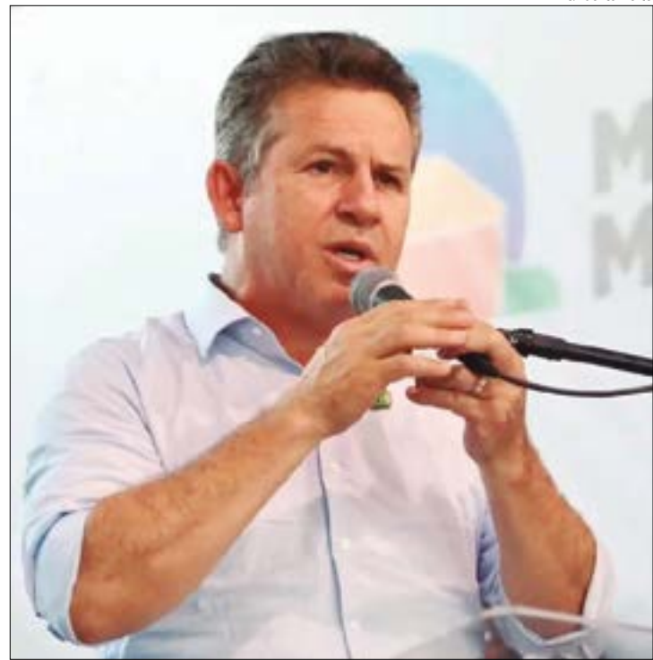
Mauro seguiu Lula e defendeu respeito à democracia, para concentrar esforços em governar