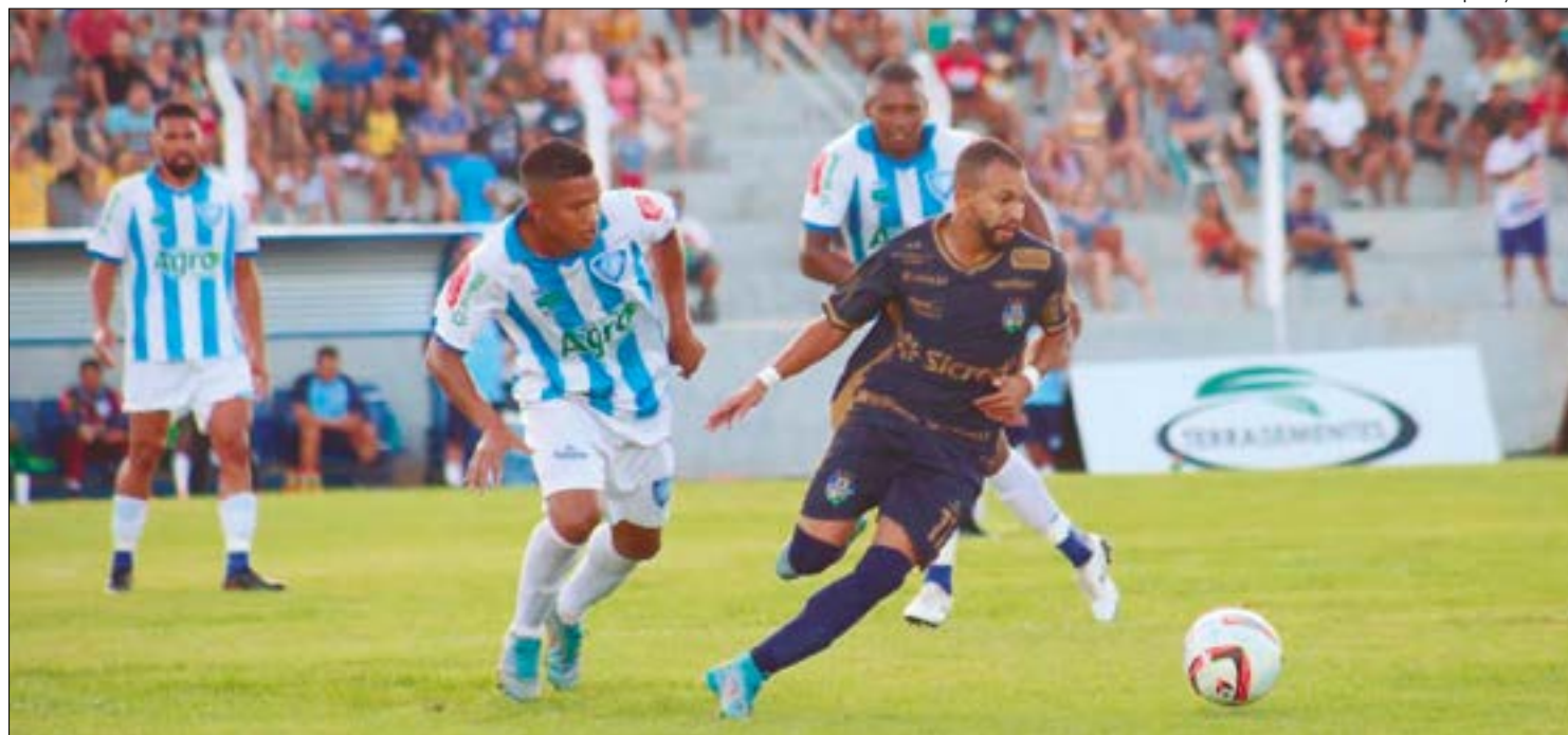
No mais antigo clássico cuiabano, Mixto chega pressionado e precisa da vitória a todo custo