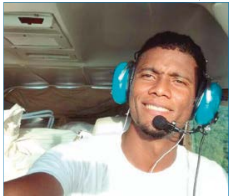
Felipe foi achado morto dentro de sua cela por policiais penais. A causa da morte é investigada