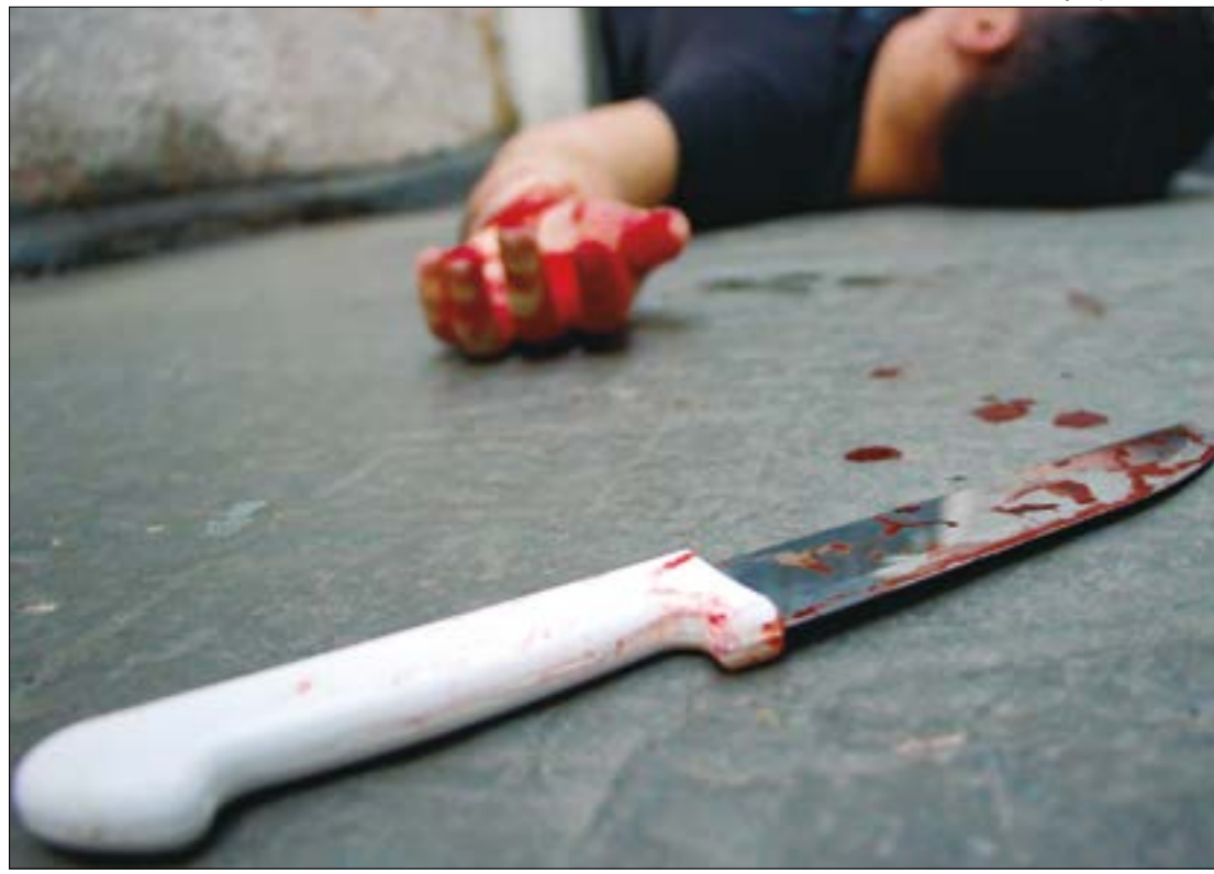
Em Mato Grosso, foram quase 200 mortes a mais de um ano para o outro (2021 e 2022)