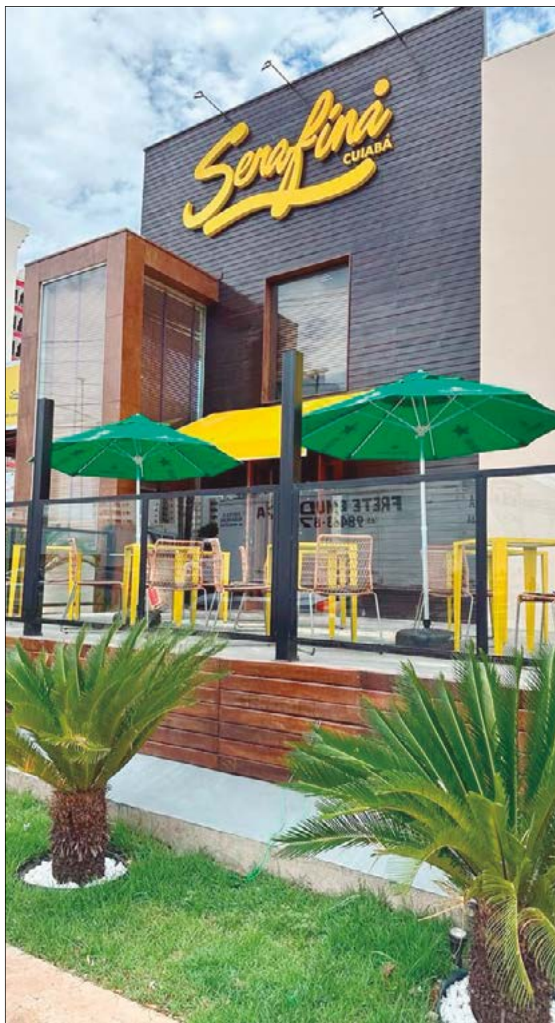
A nova fachada do Restaurante Serafina Cuiabá, que reinaugura logo mais hoje