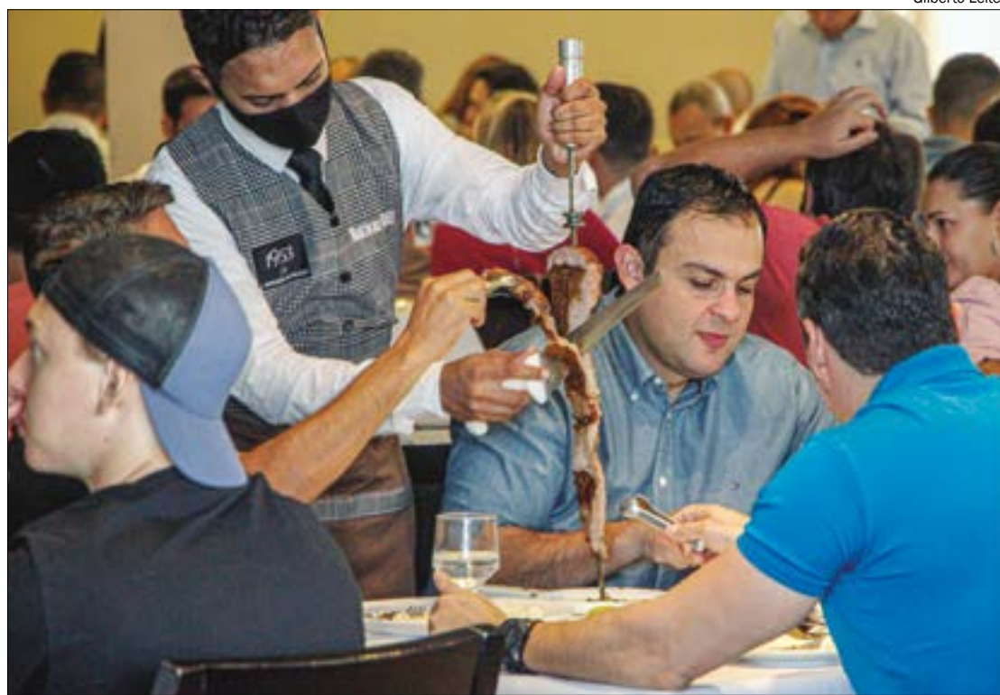
Rainha do churrasco, picanha teve queda de 20% no preço entre dezembro e fevereiro

Os principais cortes para churrasco apresentaram queda de até 20%. 'Rainha do churrasco', por exemplo, a picanha teve queda de 20% na Casa de Carnes Boa Qualidade, localizada no bairro Parque Cuiabá. Já na Casa de Carnes Tutano, localizado no bairro Cidade Alta, a queda foi um pouco menor: 13,80%.