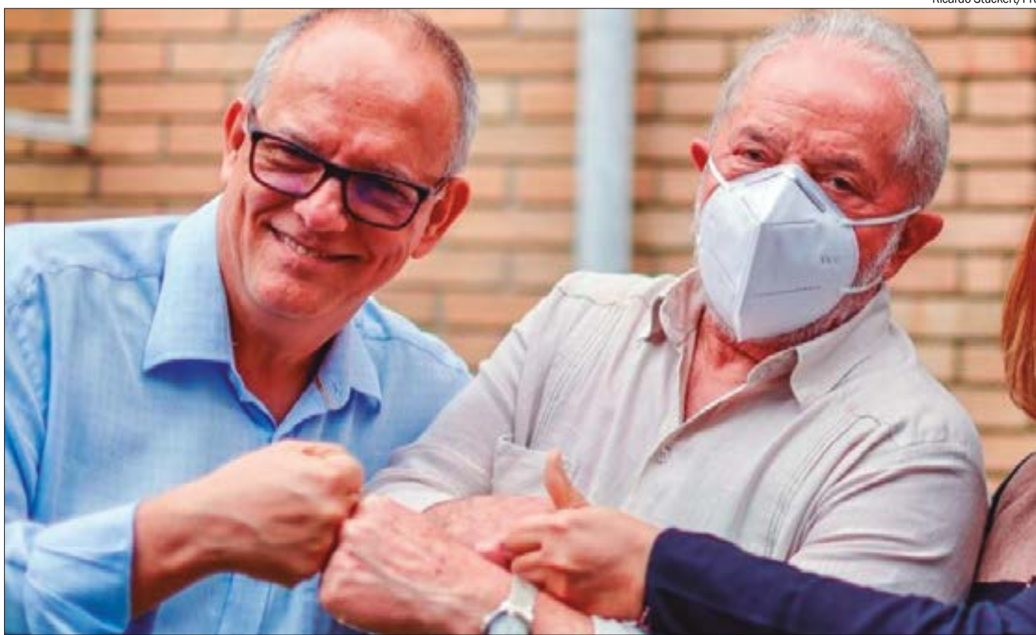
Pátio foi um dos maiores entusiastas da campanha de Lula em MT e está cobrando visita do presidente desde meados de janeiro

O presidente da Assembleia Legislativa, deputado