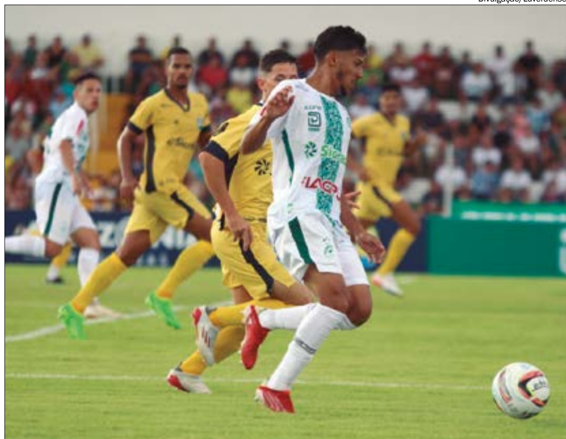
Luverdense e Vila Nova se enfrentaram 8 vezes, das quais o clube goiano levou a melhor em quatro

*Estagiário sob supervisão do editor Gabriel Soares