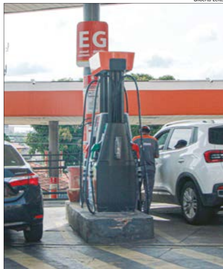
Preço do etanol teve queda em relação à última semana e pode ser encontrado por até R$ 5,17 na capital

REAJUSTES - A Petrobras está há 29 dias sem reajustar o preço da gasolina. O último reajuste foi feito em 25 de janeiro deste ano, quando a petroleira aumentou o preço desse derivado do petróleo em 23 centavos por litro, alta de 7,5%. Já o diesel foi reajustado 15 dias atrás, em 8 de fevereiro, quando a Petrobras reduziu em 8,89%, ou 40 centavos, o preço do litro desse combustível.