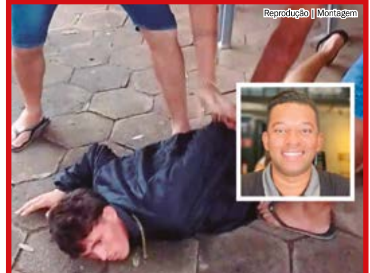
Reprodução | Montagem