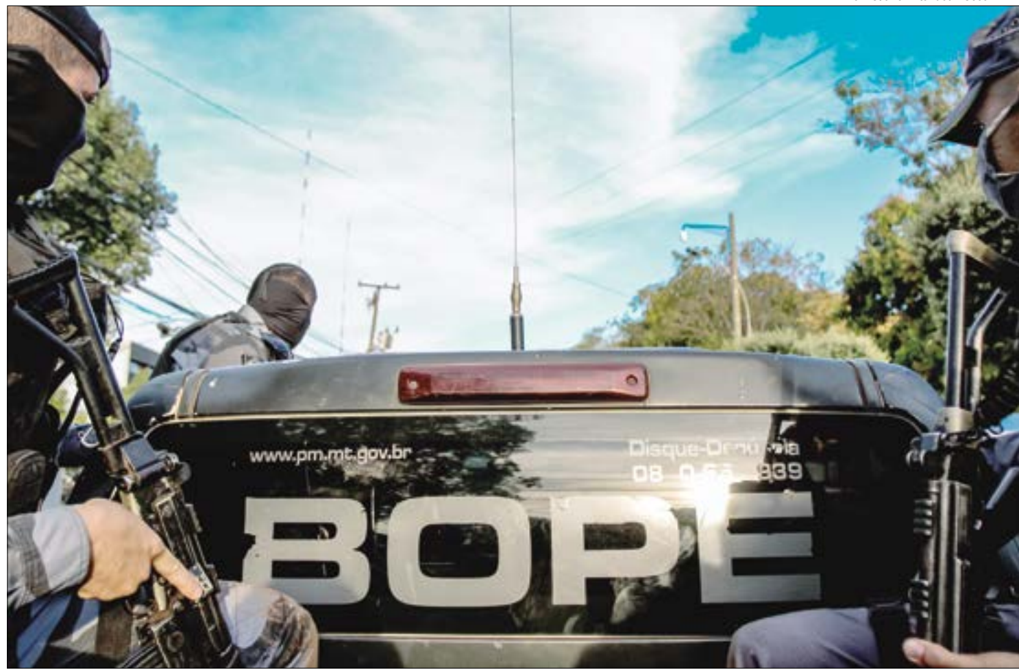
O Bope foi acionado pela Secretaria de Segurança Pública para integrar às buscas aos bandidos