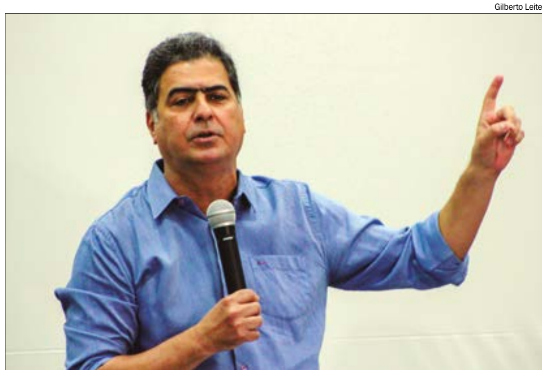
Emanuel ressaltou que não tem compromisso com erros e defendeu punição a quem cometer irregularidades

Ainda não há data para o caso voltar a ser julgado.