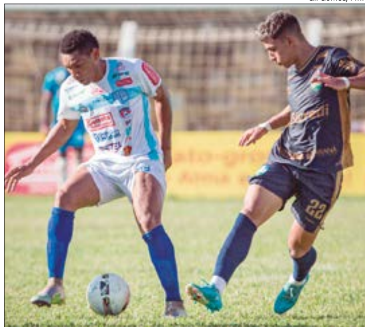
Esforço da torcida do Cacerense foi recompensado pelos jogadores com vitória, por 1 a 0, sobre o União