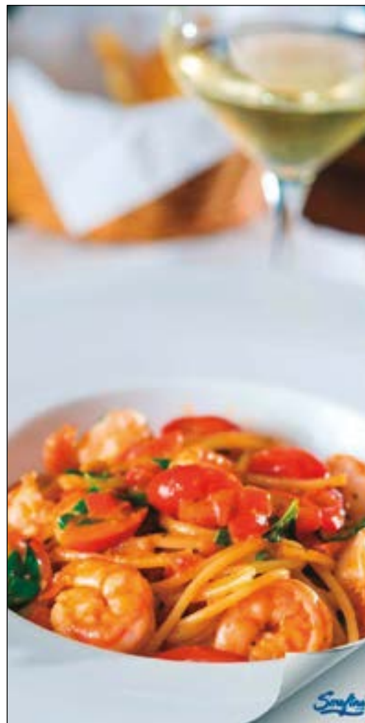
Pra dar mais água na boca, um delicioso spaguetti de camarão do restaurante Serafina Cuiabá