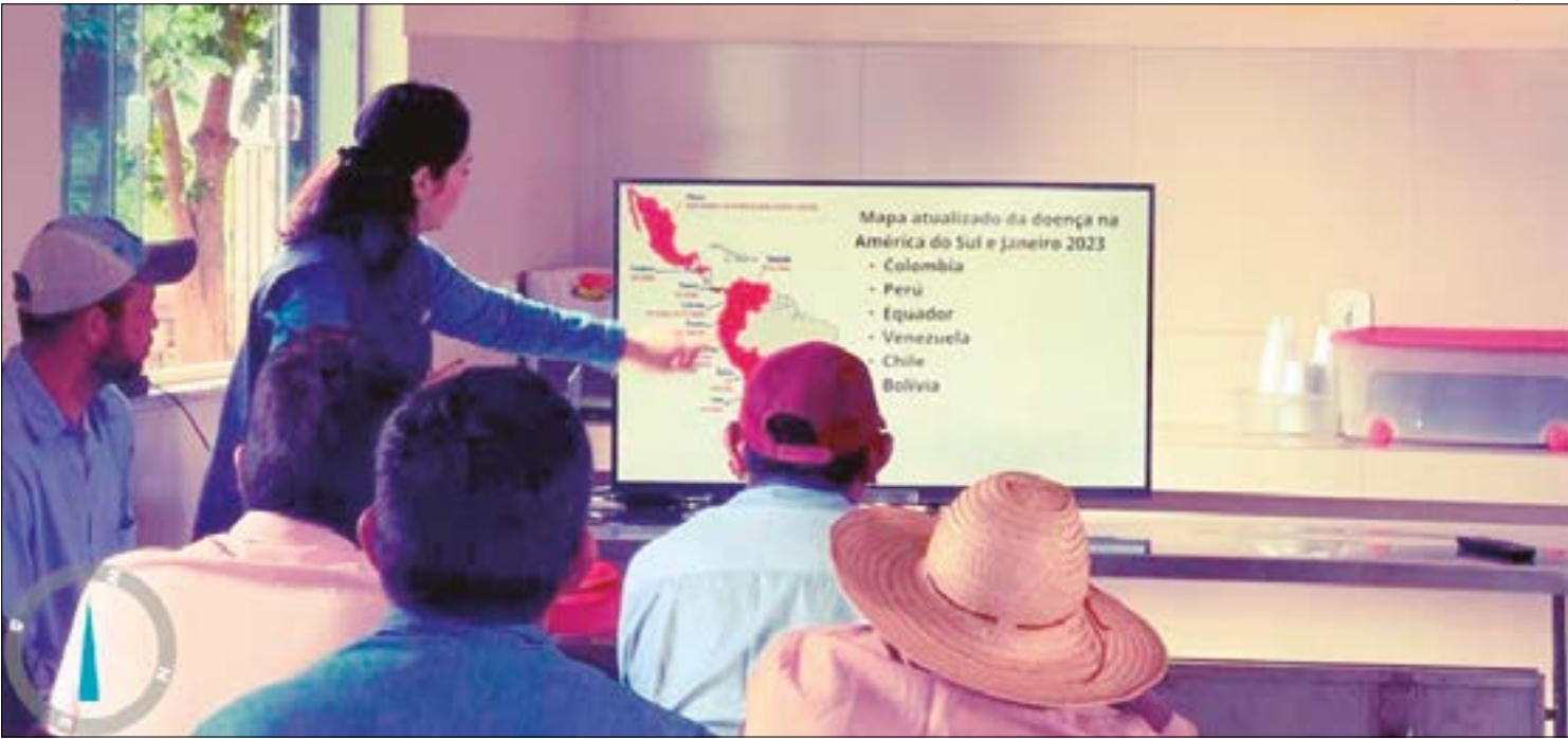
Técnicos do Indea estão realizando visitas nas propriedades consideradas de risco para a gripe aviária

"A principal forma de deslocamento da doença acontece pela migração de aves silvestres que carregam os vírus para longas distâncias. Quando em contato com aves domésticas, esses vírus podem causar doença grave dizimando plantéis de aves de fundo de quintal e comerciais. Para que o Brasil e Mato Grosso continuem livres da doença, visitas de vigilância e ações orientativas têm sido reforçadas", alerta a fiscal.