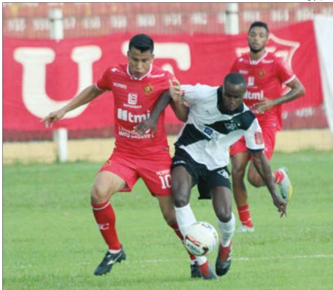
Vivendo uma crise dentro e fora do campo, Mixto perdeu com gol contra para o União neste domingo

O resultado deixou o Cacerense na sexta colocação,