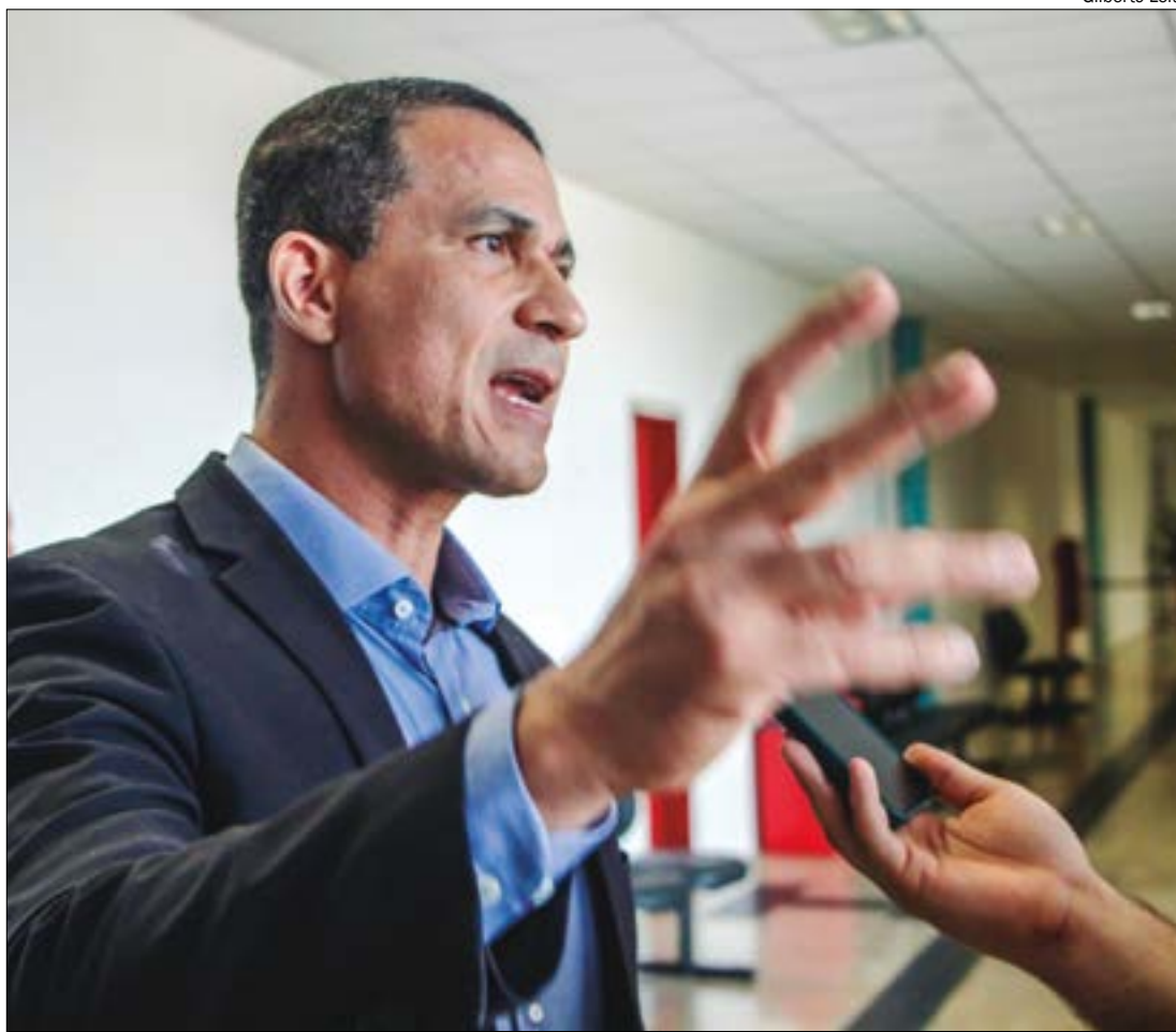
Assis tenta mobilizar bancada do União no Congresso para aprovar um decreto legislativo que derrube medida de Lula

Outro ponto sensível do decreto presidencial é a obrigação de cadastrar todas as armas já adquiridas