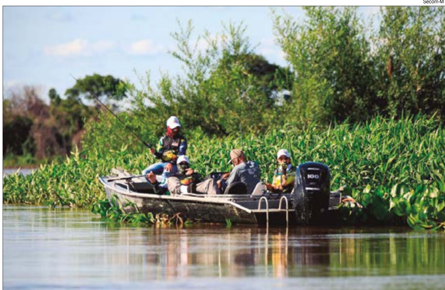
Os rios da bacia amazônica atraem grande parte dos amadores da prática "Pesque e Solte" no Estado