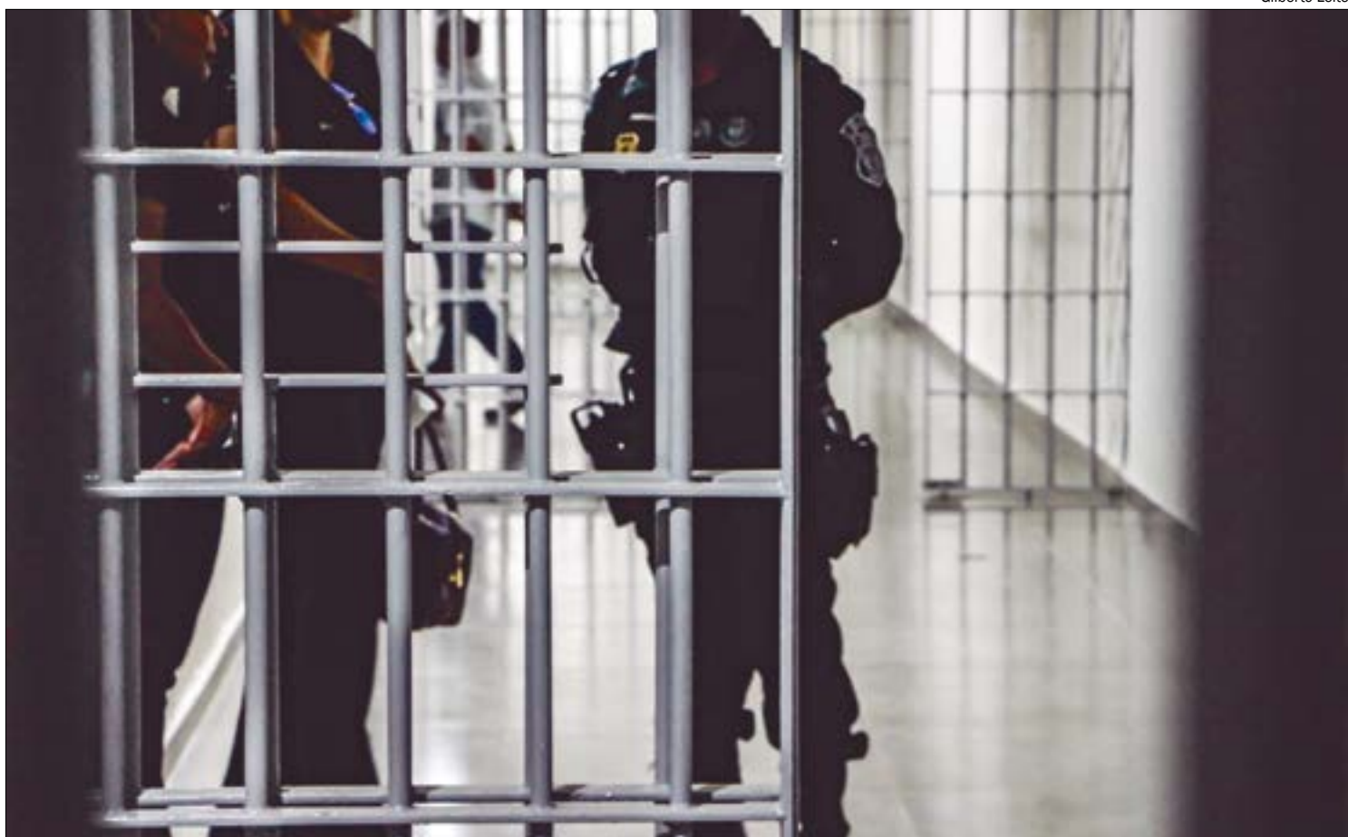
A ala, construída inicialmente para receber os líderes e facções criminosas, prevê regime disciplinar rígido

"Inúmeros presos provenientes do CCC estavam trabalhando no referido estabelecimento penal, contudo, ao ingressarem no Raio 8, perderam, abrupta-