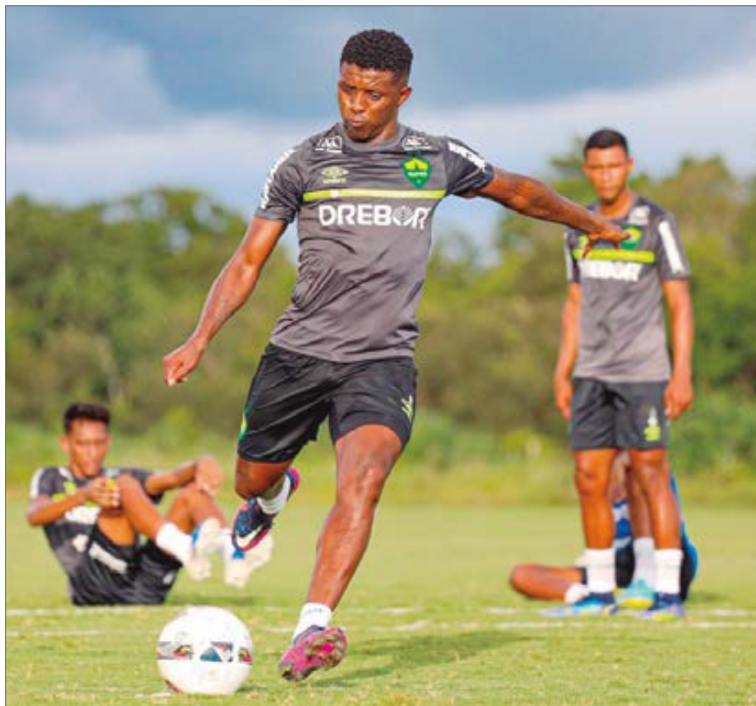
Cuiabá e Operário estão empatados em número de pontos, mas o Dourado leva vantagem no saldo de gols

OPERÁRIO E NOVA MUTUM - Para fechar a rodada, o vice-líder Ope-