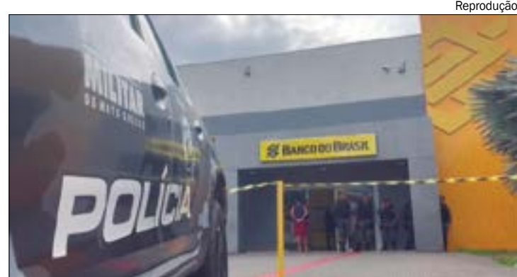
Dois dos suspeitos foram mortos em confronto com a PM, nas primeiras horas da manhã desta terça-feira