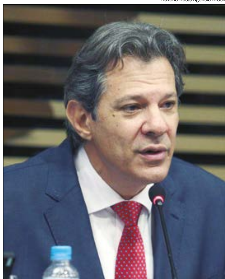
De acordo com Haddad, a reforma tributária será discutida em duas etapas, uma delas ainda no 1º semestre