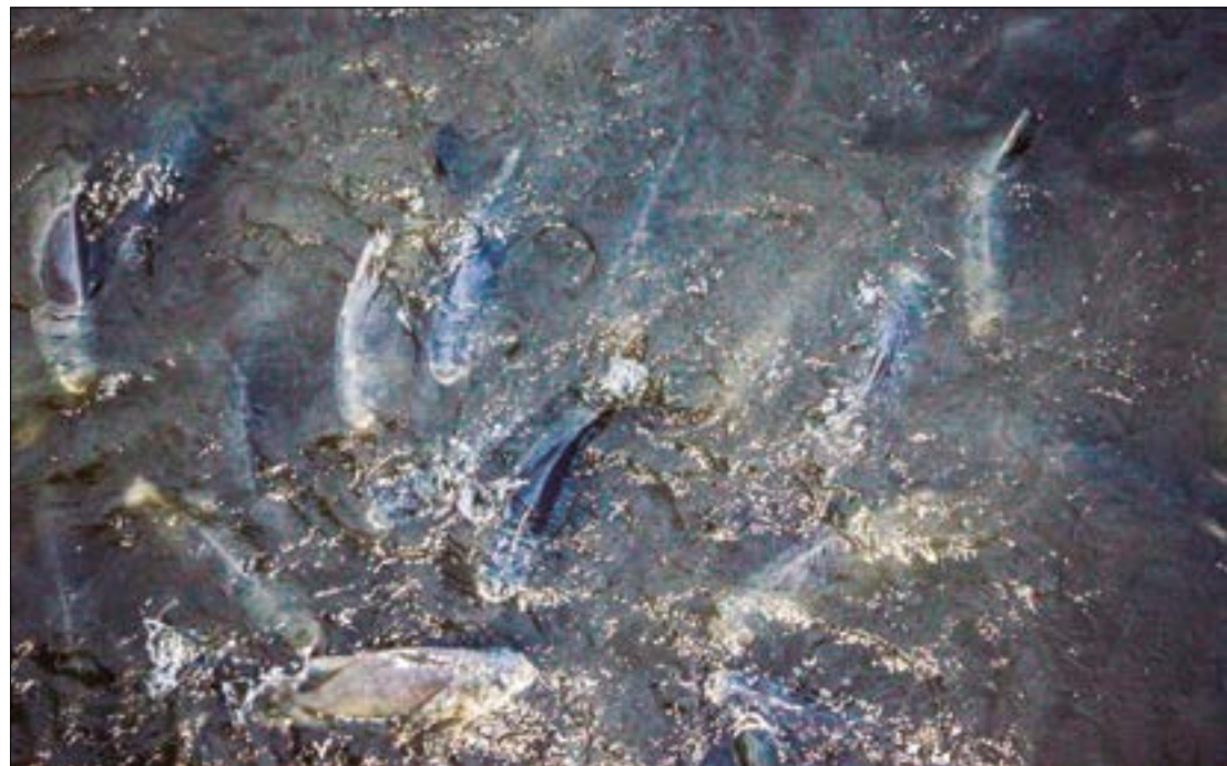
A partir do documento do Ministério do Meio Ambiente, caberá à Sema fiscalizar e apoiar a sua execução