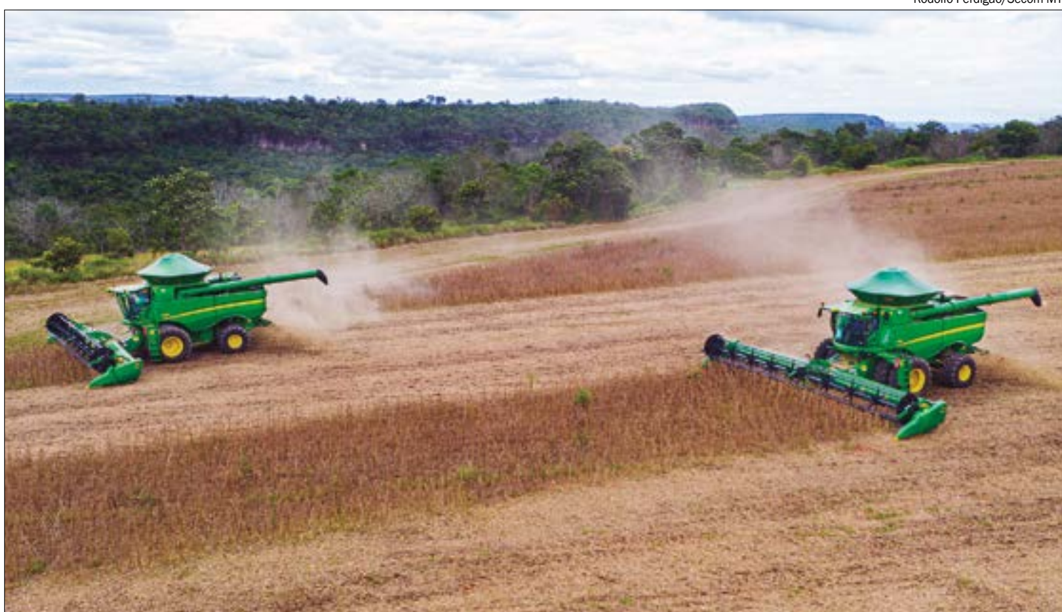
Colheita da soja está atrasada em 18,8 pontos percentuais em comparação com a safra 2021/2022

Os produtores devem continuar com essa dificuldade, pois os institutos de meteorologia apontam que, nos próximos 14 dias, deve chover entre 10 a 50 milímetros por dia.