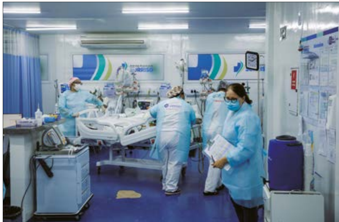
O tempo de espera mais longo é de um paciente que precisa fazer uma cirurgia ortopédica, há mais de 12 anos