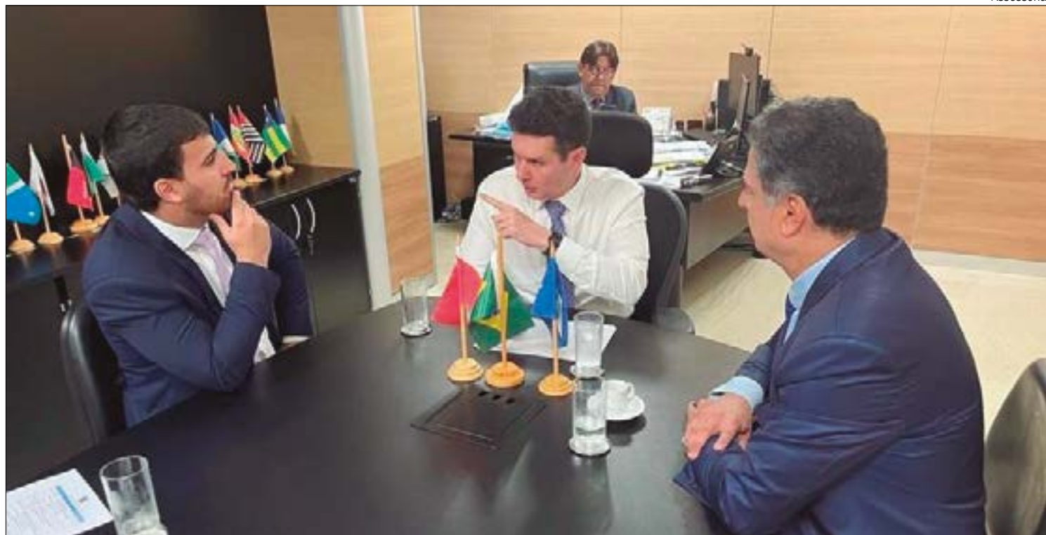
Emanuel diz que ministro ficou boquiaberto com decisão de trocar o VLT pelo BRT

"Eles não estão entendendo como uma obra dessa envergadura, com tamanho investimento, com tanto tempo passado, e que significava a redefinição do transporte público das duas