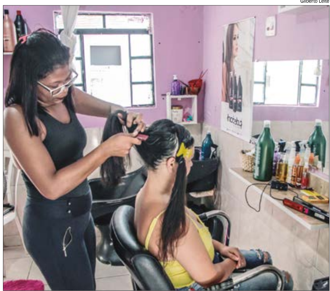
Ao todo, foram abertas 81,5 mil empresas em 2022, enquanto 30.282 fecharam as portas