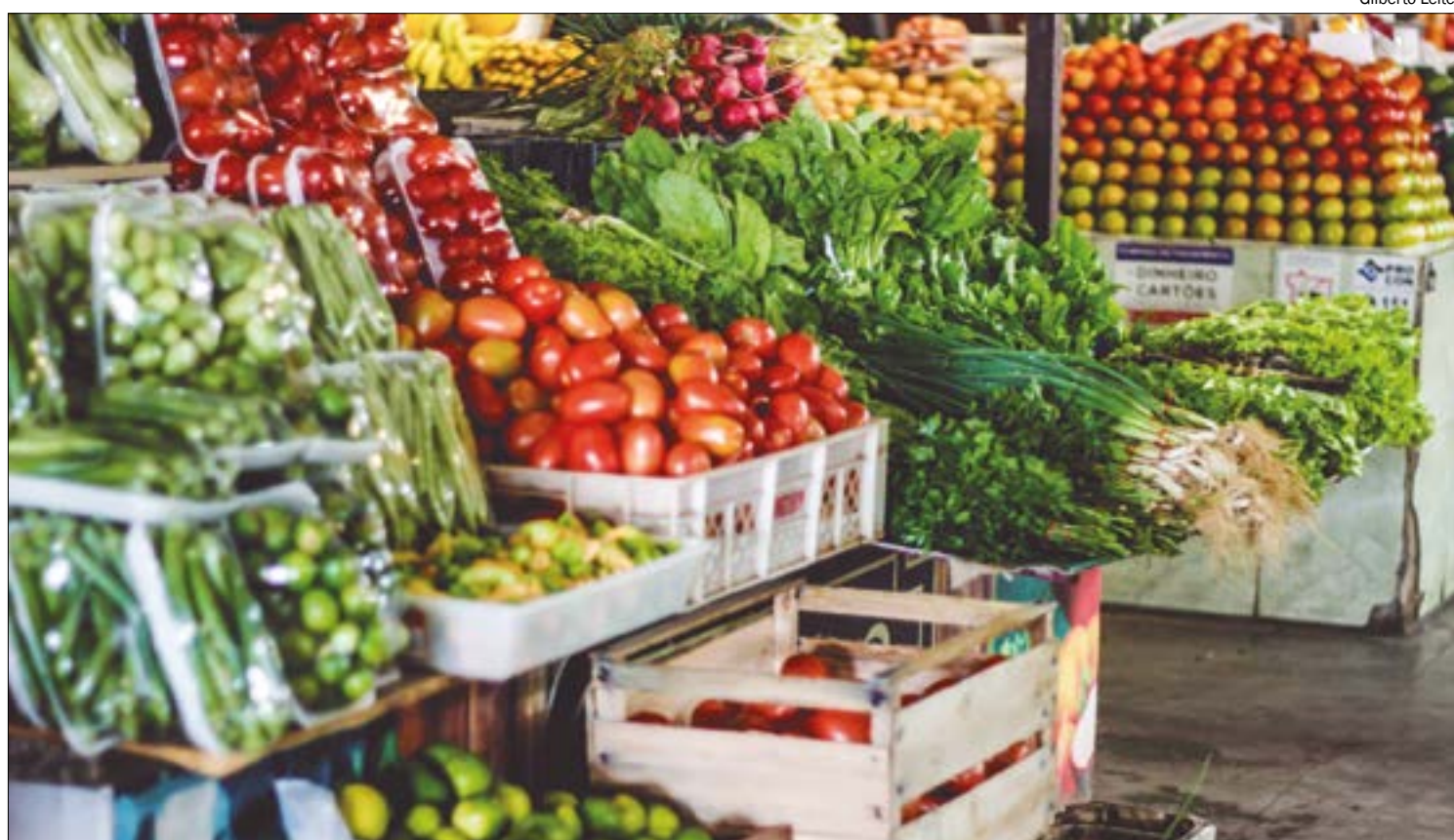
Excesso de chuvas nas regiões produtoras tem causado elevação nos preços dos alimentos, como a banana e o tomate

“Alguns itens, como o tomate e a banana, que estão com preços elevados,