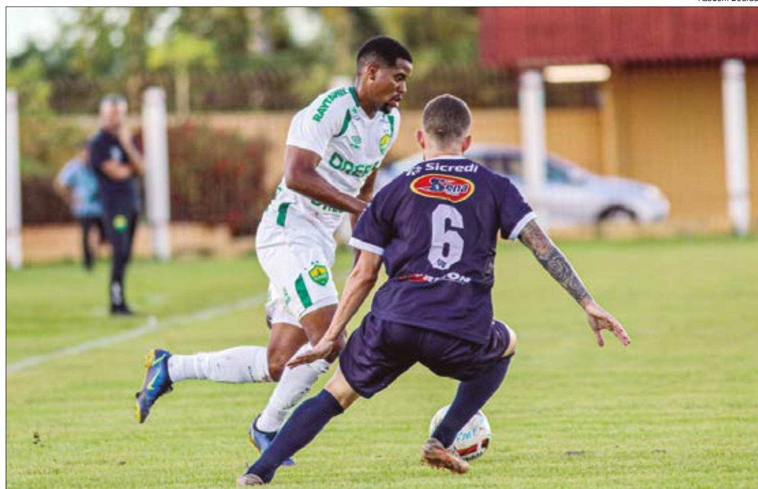
Cuiabá liquidou a fatura logo no primeiro tempo, com três gols sobre o Academia