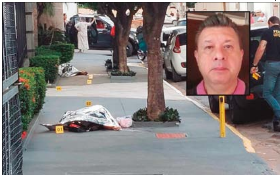
O assassino, que é filho do deputado federal Carlos Bezerra (MDB), executou os dois com três tiros, cada