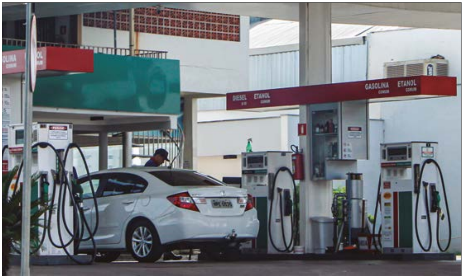
Preço da gasolina ao mesmo tempo em que o etanol barateou, aumentando a vantagem do álcool para os motoristas

Enquanto os preços dos combustíveis vivem uma disparada, o etanol está caindo em Cuiabá, e