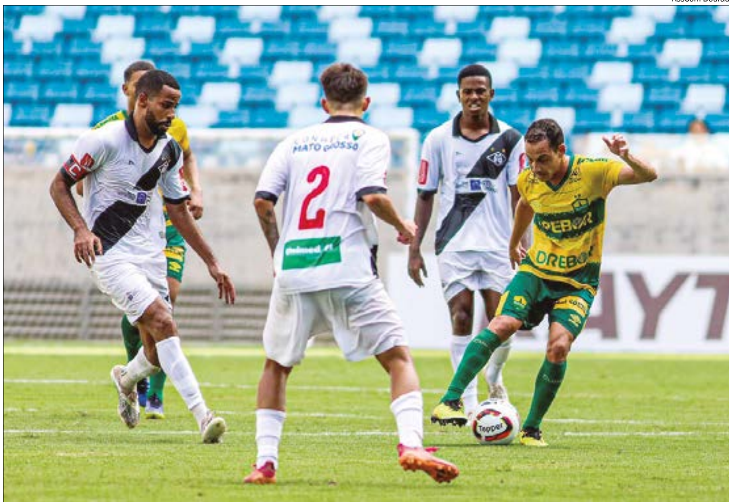
Após estreiar com derrota para o Cuiabá, Mixto se mantém confiante e projeta vitória sobre o Operário