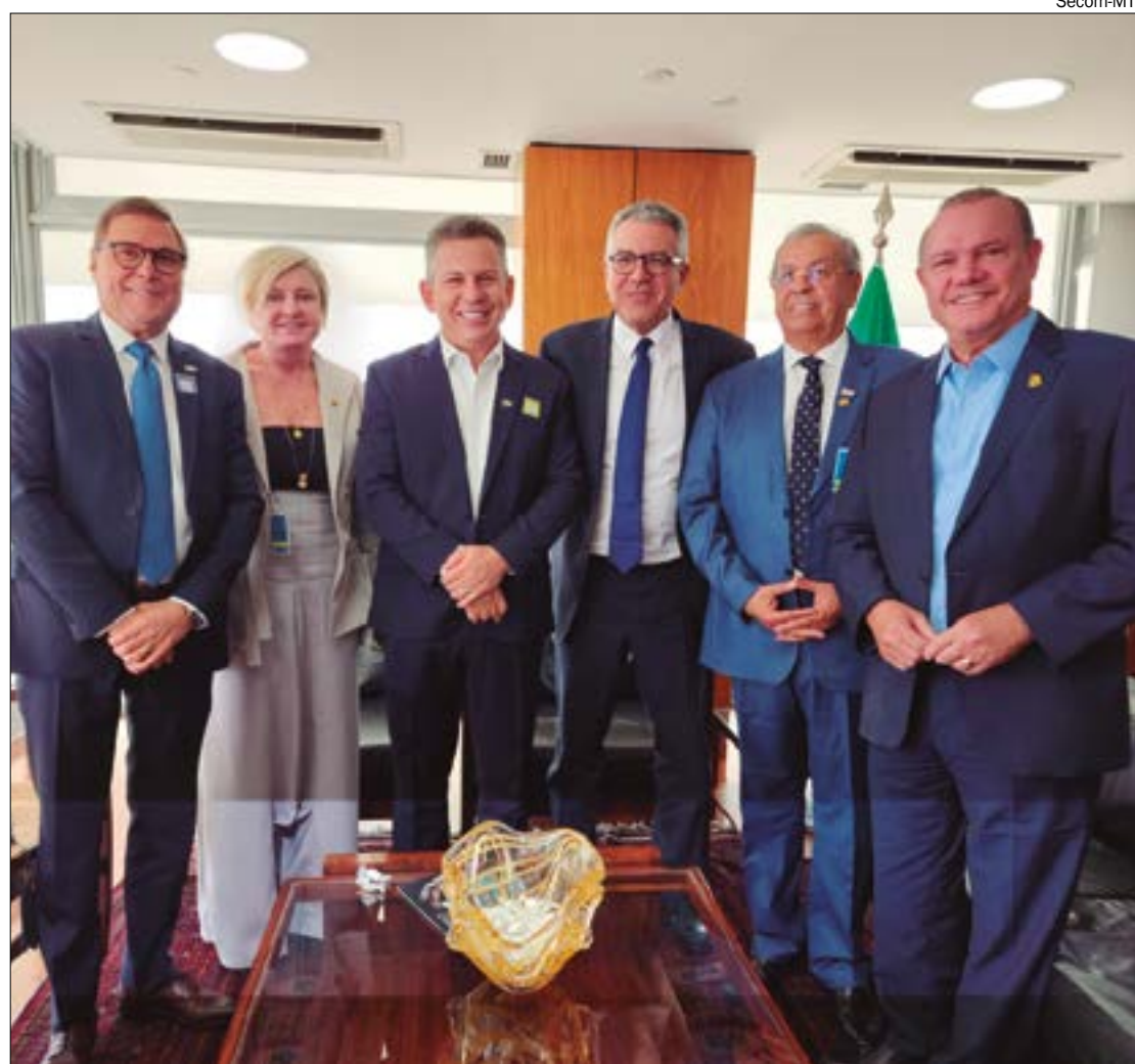
Governo aponta que tem R$ 50 milhões por ano para investir no Parque de Chapada