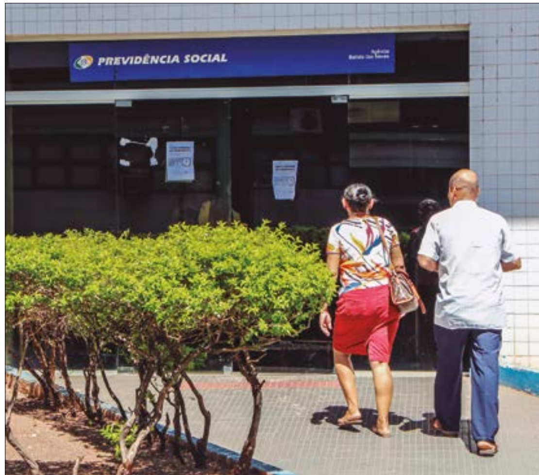
A partir de agora, caberá ao INSS comprovar se o beneficiário está vivo