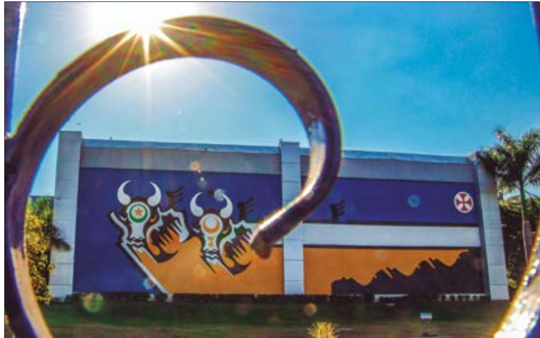
Conacate afirma que legislação estadual desvirtua o instituto da contratação temporária

so de considerável período de existência da lei ou do ato normativo impugnado, descaracteriza a urgência", observou a magistrada.