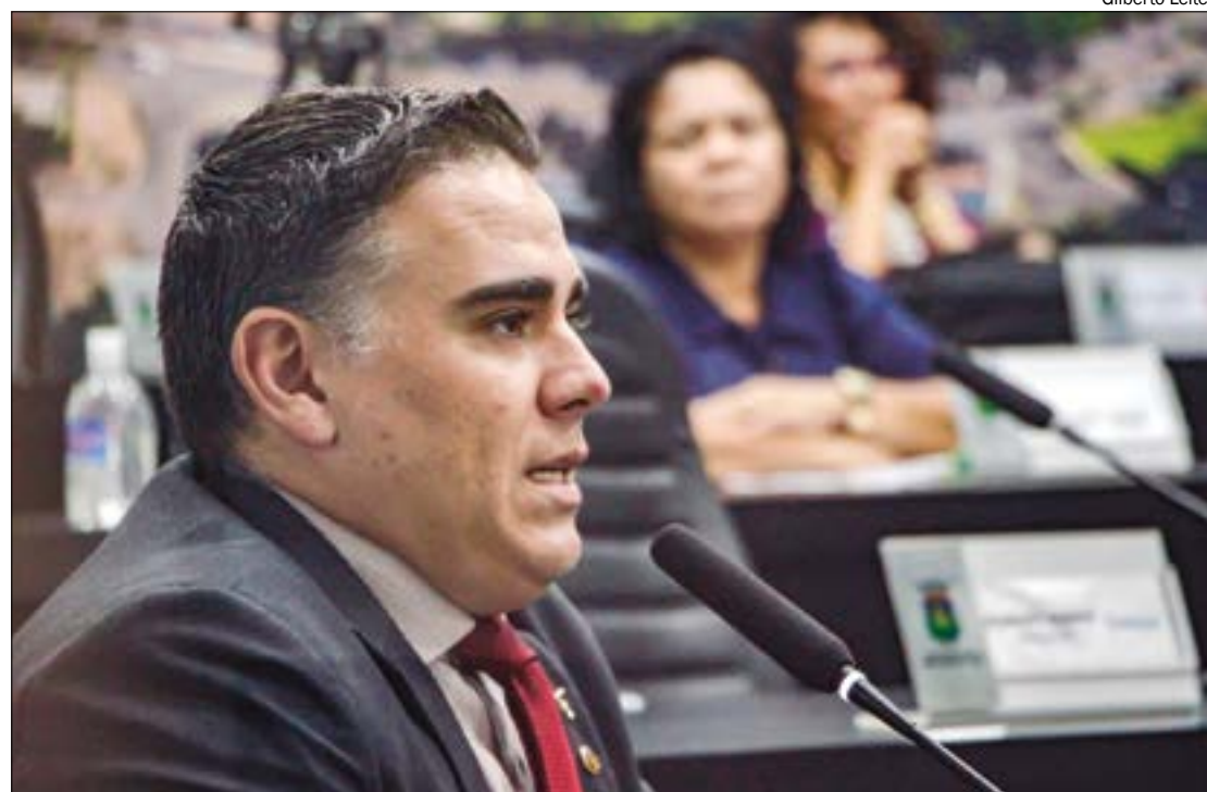
Paccola foi condenado por falsidade ideológica e inserir dados falsos no sistema da Polícia Militar

Segundo o MP, uma das armas com registro adulterado teve como objetivo ocultar a autoria de sete crimes de homicídios, sendo quatro tentados e três consumados, nos anos de 2015 e 2016, praticado por grupo de extermínio conhecido como "Mercenários".