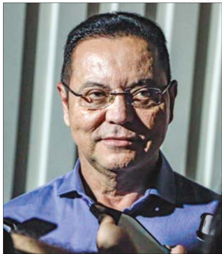
Emenda Constitucional impede reeleição de membros da Mesa Diretora para o mesmo cargo