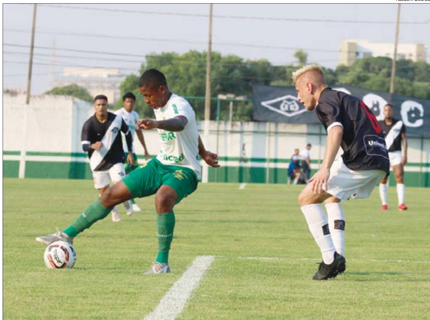
Cuiabá e Mixto já se enfrentaram 31 vezes e o Dourado leva a melhor no retrospecto, com 15 vitórias

“Vamos nos direcionar mais para questões táticas e aquilo que é a competição (estadual). Essas duas semanas foram