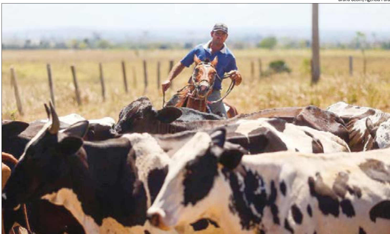
Preços pagos aos pecuaristas se mantém os mesmos de 2 anos atrás, mas o custo de produção aumentou significativamente

"A conjuntura de forte retenção de fêmeas ocorrida em 2020 e 2021 refletiu uma intensificação do descarte de matrizes em 2022 (o incremento no abate de fêmeas foi de 14,56%, enquanto o de machos variou apenas +0,74% ante a 2021)", afirma o Imea em seu último boletim, acrescentando que boa parte das fêmeas terminadas tem mais de 36 meses.