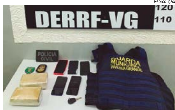
O trio, foi localizado em uma residência após pistas levarem os agentes até o local