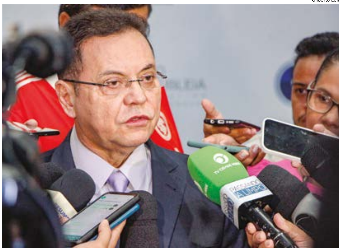
Botelho comentou que tem feito mobilizações alertando sobre os malefícios das hidrelétricas no Rio Cuiabá

Ao ingressar com a ADI, a Abragel afirmou que a medida usurpa a compe-