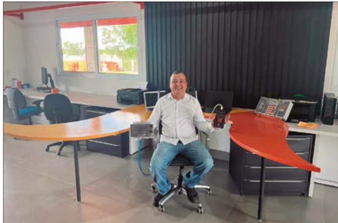
Uma das empresas beneficiadas com o crédito em 2022 é a Unite Solutions, que atua em Cuiabá há 30 anos

operações no ano passado ficou em torno de R$ 32 mil e de R$ 19 mil em 2021, o que representa um aumento de 68% no último ano.