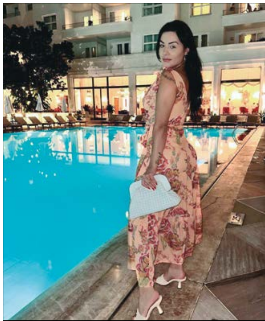
A famosa Carla Bora, em dias de merecido descanso no Copacabana Palace