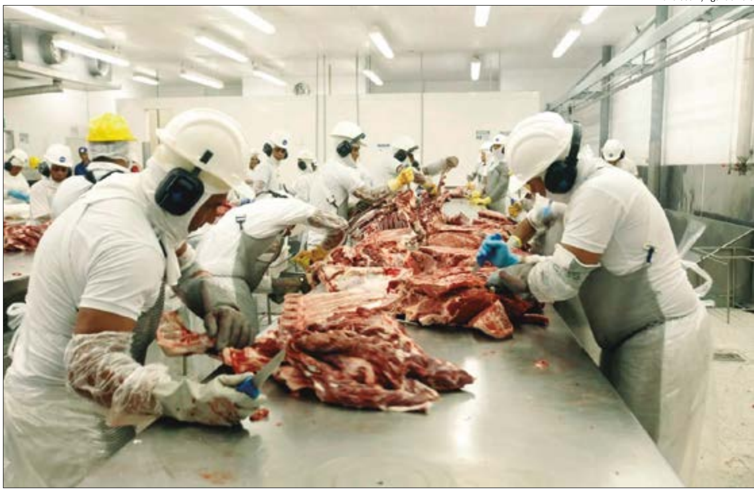
Dois plantas de MT foram liberadas para exportar à Indonésia; outras duas seguem impedidas de exportar à China

O economista também afirma que há boas perspectivas para o setor de alimentos, mas vê com