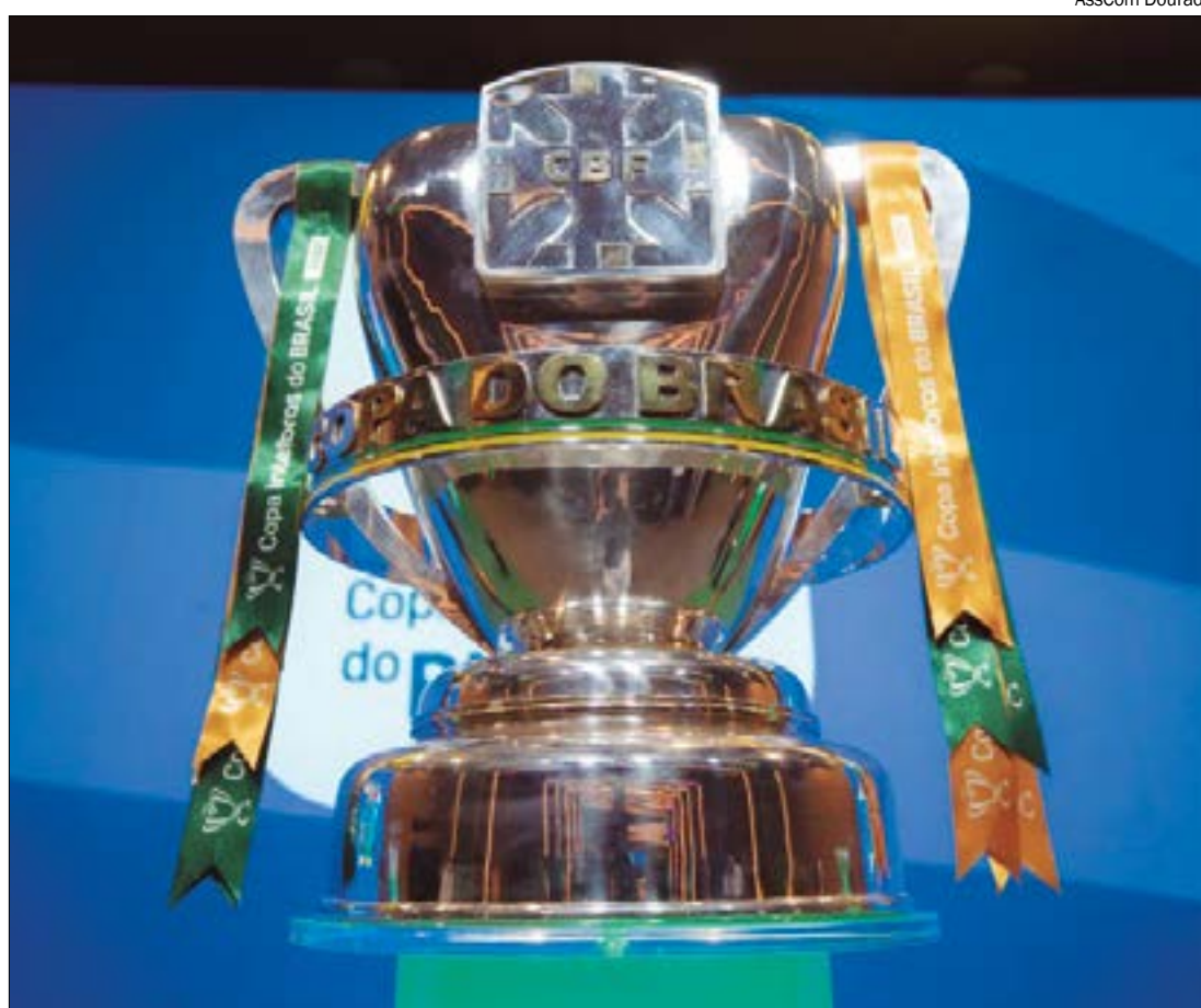
Os três times de MT não devem se enfrentar na primeira fase da Copa do Brasil, mas dois deles terão grandes desafios

Os times do grupo 3 ganharam R$ 620 mil em caso de avanço de fase. As equipes do grupo 2 receberam R$ 1,09 milhão, enquanto os clubes do grupo 1 ficaram com 1,27 milhão.