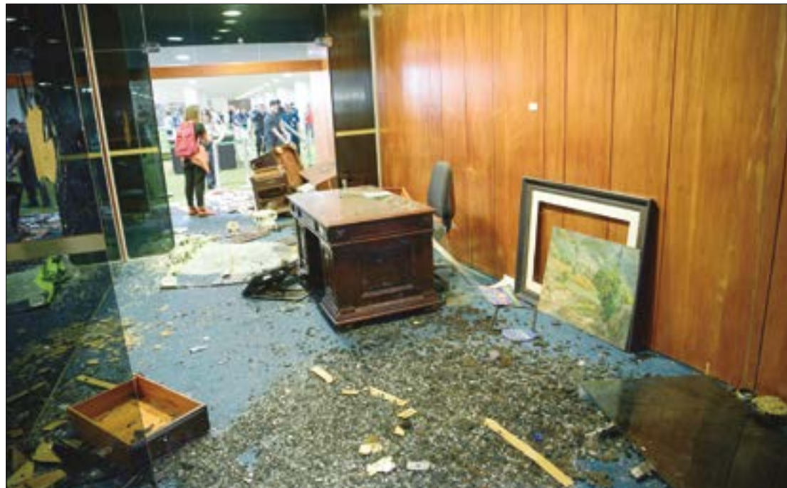
Houve depredação e vandalismo nos prédios do Congresso Nacional, do Supremo Tribunal Federal e no Palácio do Planalto

“O ministro considerou que as condutas foram ilícitas e gravíssimas, com intuito de, por meio de violência e grave ameaça, coagir e impedir o exercício dos poderes constitucionais constituídos. Para o minis-