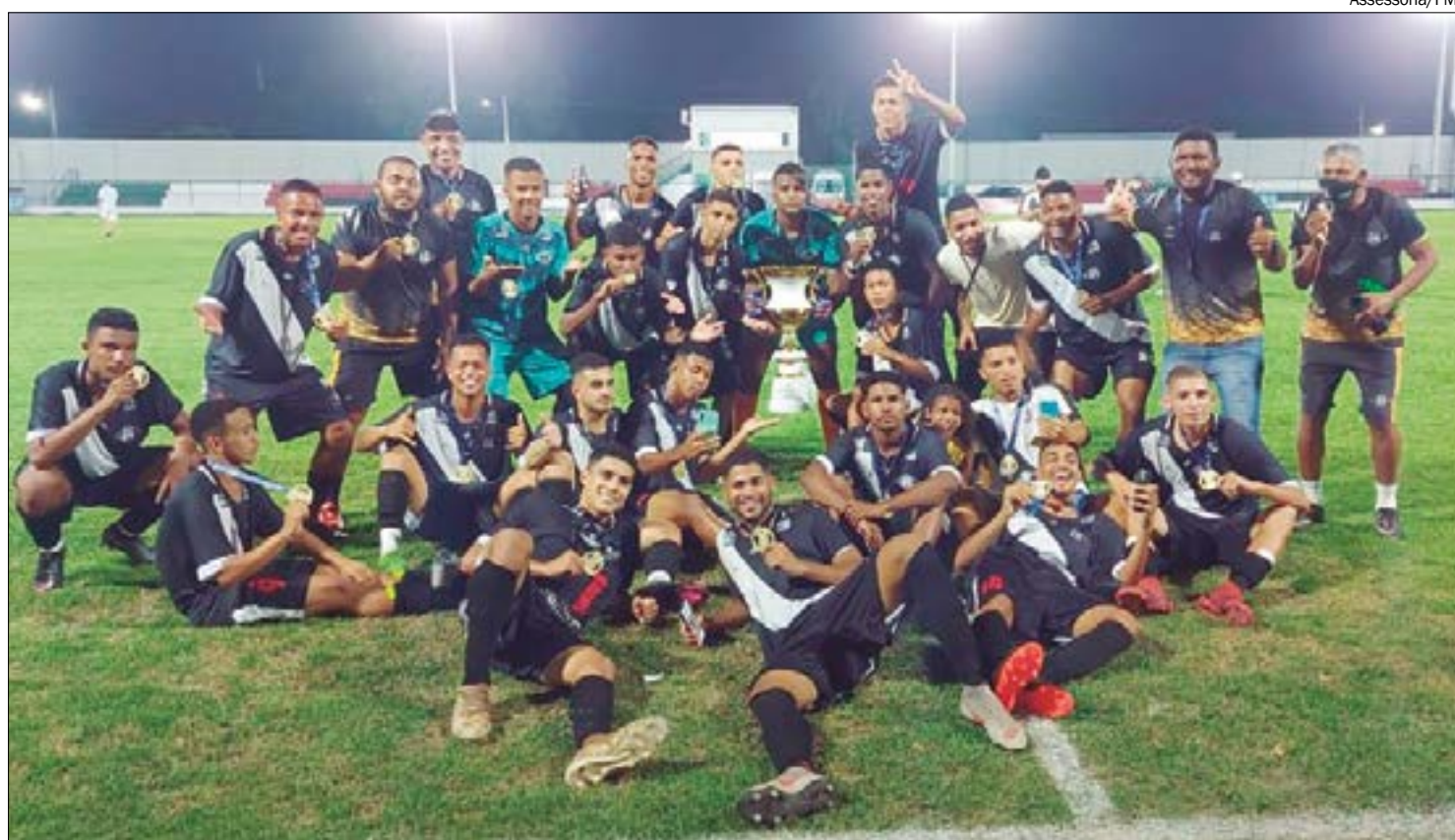
Nova diretoria do Mixto encontrou sala de troféus vazia e luta para recuperar os símbolos de suas conquistas

"Chegamos e não encontramos um troféu sequer das conquistas históricas do clube, todos os troféus desapareceram, literalmente. Ninguém sabia dizer onde encontrar. Muitos já conseguimos recuperar. Esta semana conseguimos recuperar 46 troféus e, aos poucos,