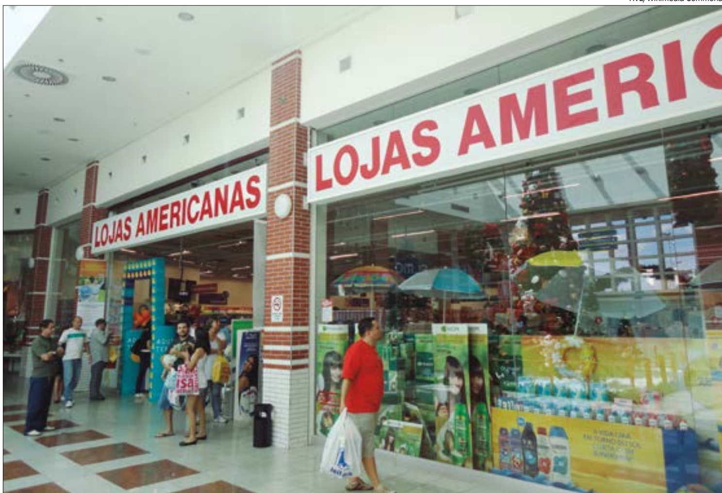
Americanas sinaliza rombo de R$ 40 bilhões e deve entrar em processo de recuperação judicial