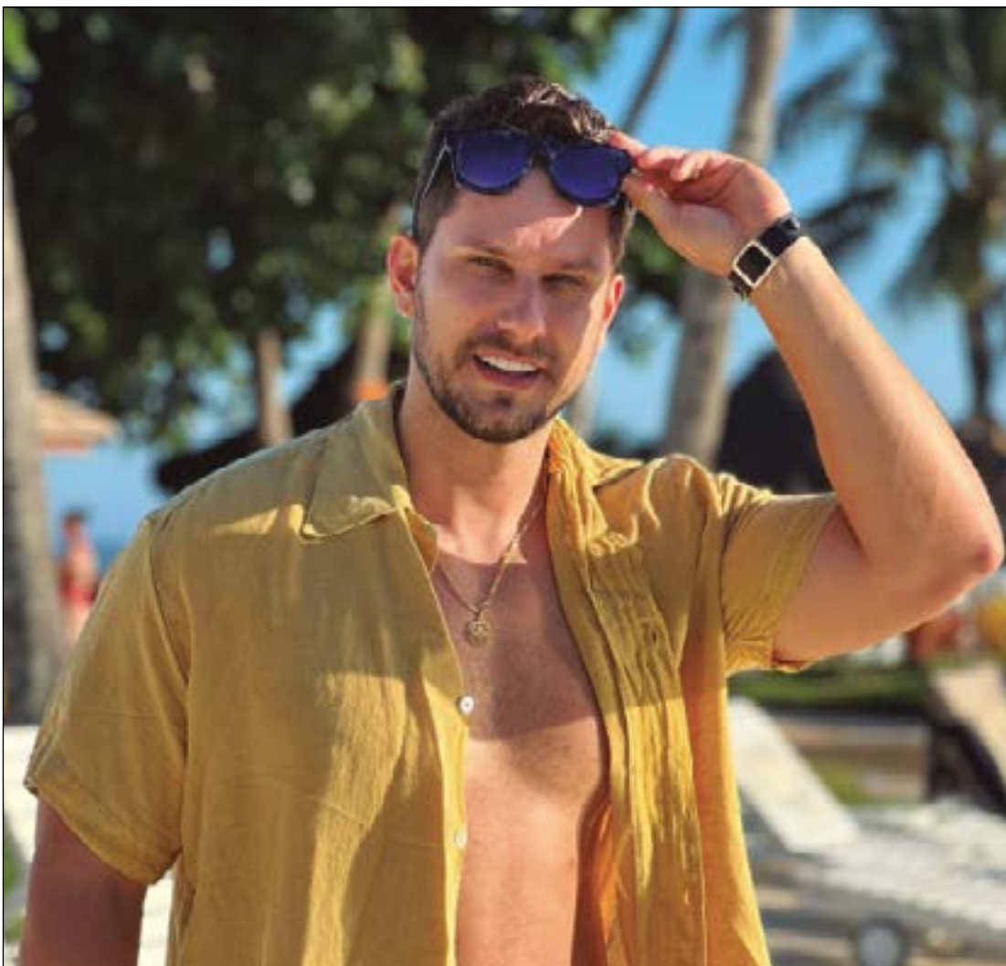
Amigão da coluna, o ex-BBB e DJ Eliéser Ambrózio