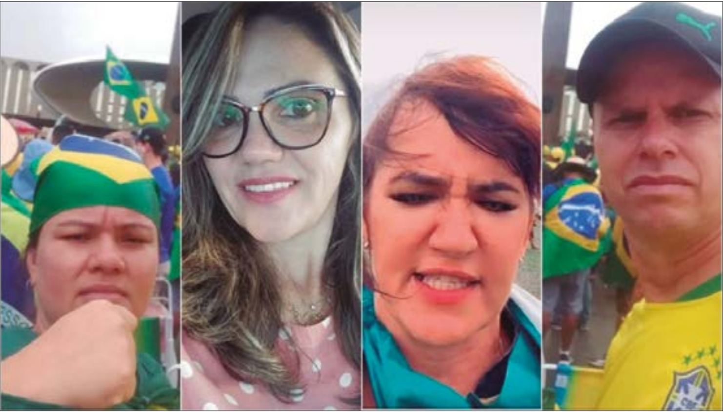
Os nomes dos participantes dos atos golpistas foram divulgados pelo Governo do Distrito Federal

Grupo de bolsonaristas extremistas atacou os prédios do Três Poderes no último domingo, 8 de janeiro