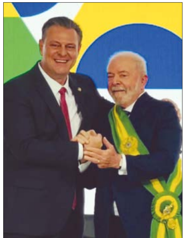
Sendo empossado ministro da Agricultura e Pecuária pelo presidente Lula, o senador Carlos Favaro

“Para nós da família é muito representativo e satisfatório, pelo reconhecimento ao nome do nosso irmão, que foi uma pessoa que deixou um legado para família, amigos e município, sempre se doando, sempre amando ao próximo, fazendo o bem sem olhar a quem. Ficamos muito contente e alegre de saber que após 18 anos que ele nos deixou, recebe essa linda homenagem. Muito importante essa homenagem porque ele vivia aqui em Várzea Grande, gostava daqui. É muito gratificante”.